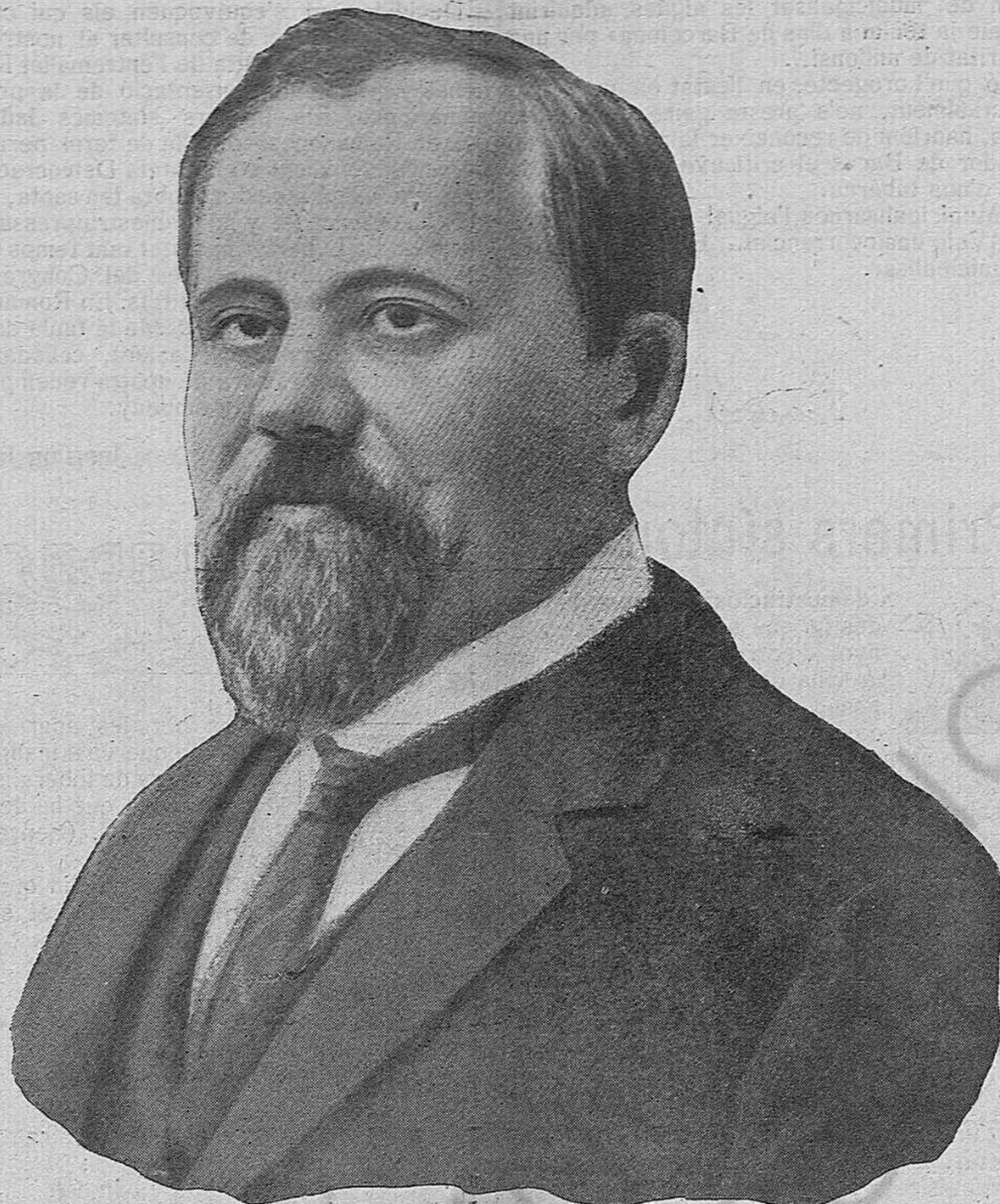
M. RAYMOND POINCARÉ nou President de la República Francesa.

amics y enemics li reconeixen per igual. És lleal, coratjós y obstinat, com a bon fill de la Lorena.