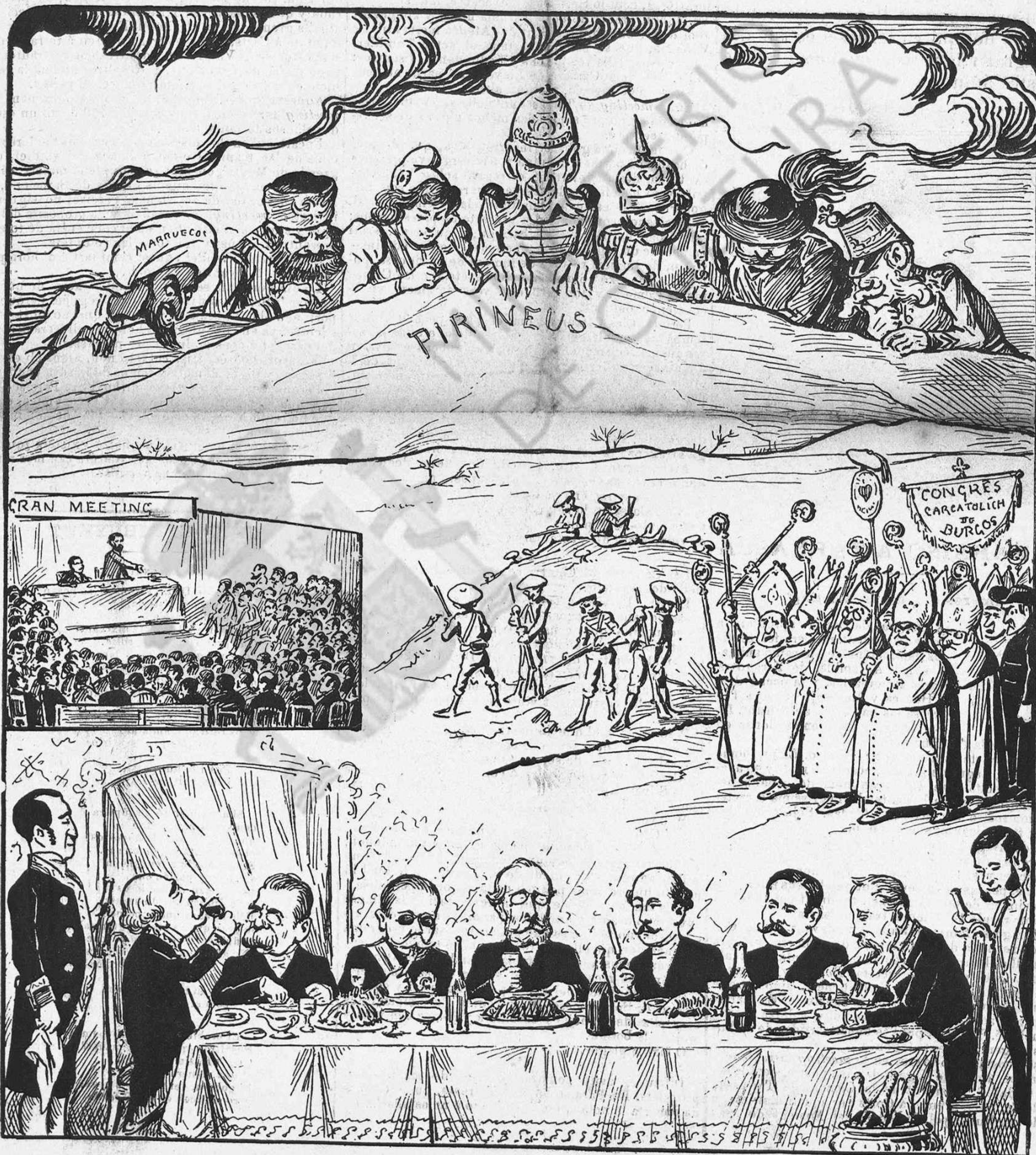
LAS NACIONS EXTRANJERAS:—¡Bé, noys, bé! Aixó va posantse á punt... de carmetlo.