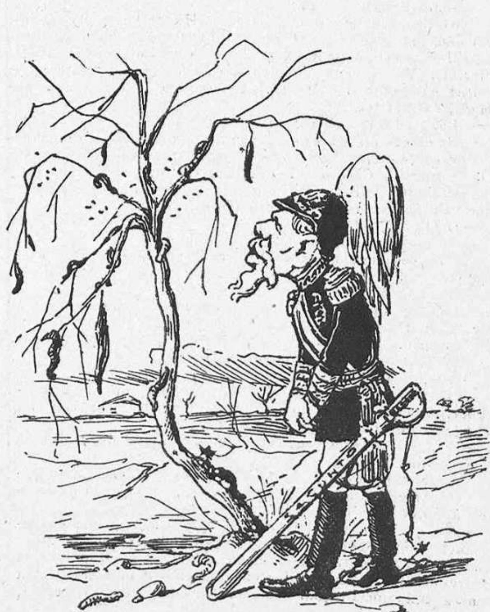
¡Y miréulo com está!