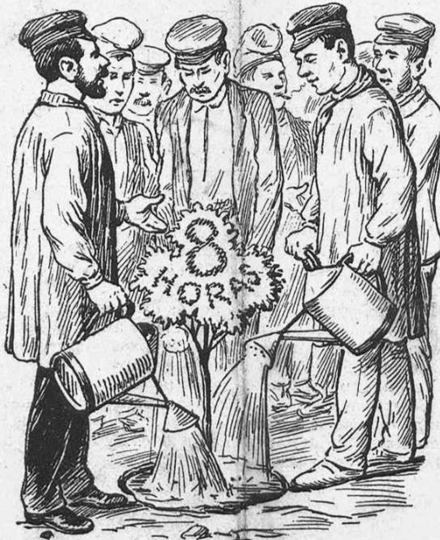
No deixeu de regarlo aquest arbre, que ja creixerá.

ja contats els ceps qu' encare llevan fruyt: á Valencia, á la Bisbal, á Tarragona, á Mahó, á tretze ó catorze districtes mes hém veremat alguna cosa. Los restants permaneixen estérils, ab los serments migrats, els pámpols esgroguets, próxims á assecarse. La mala herba s' ha apoderat de la vinya: l' invisible insecte, qui sab si alentat per la reacció y 'l jesuitisme. s' aferra á las arrels dels ceps. La vinya, per altra part, s' ha anat fent vella, y fins haventla cuydada mes de lo que s' ha cuydat ben poch ne podríam esperar.