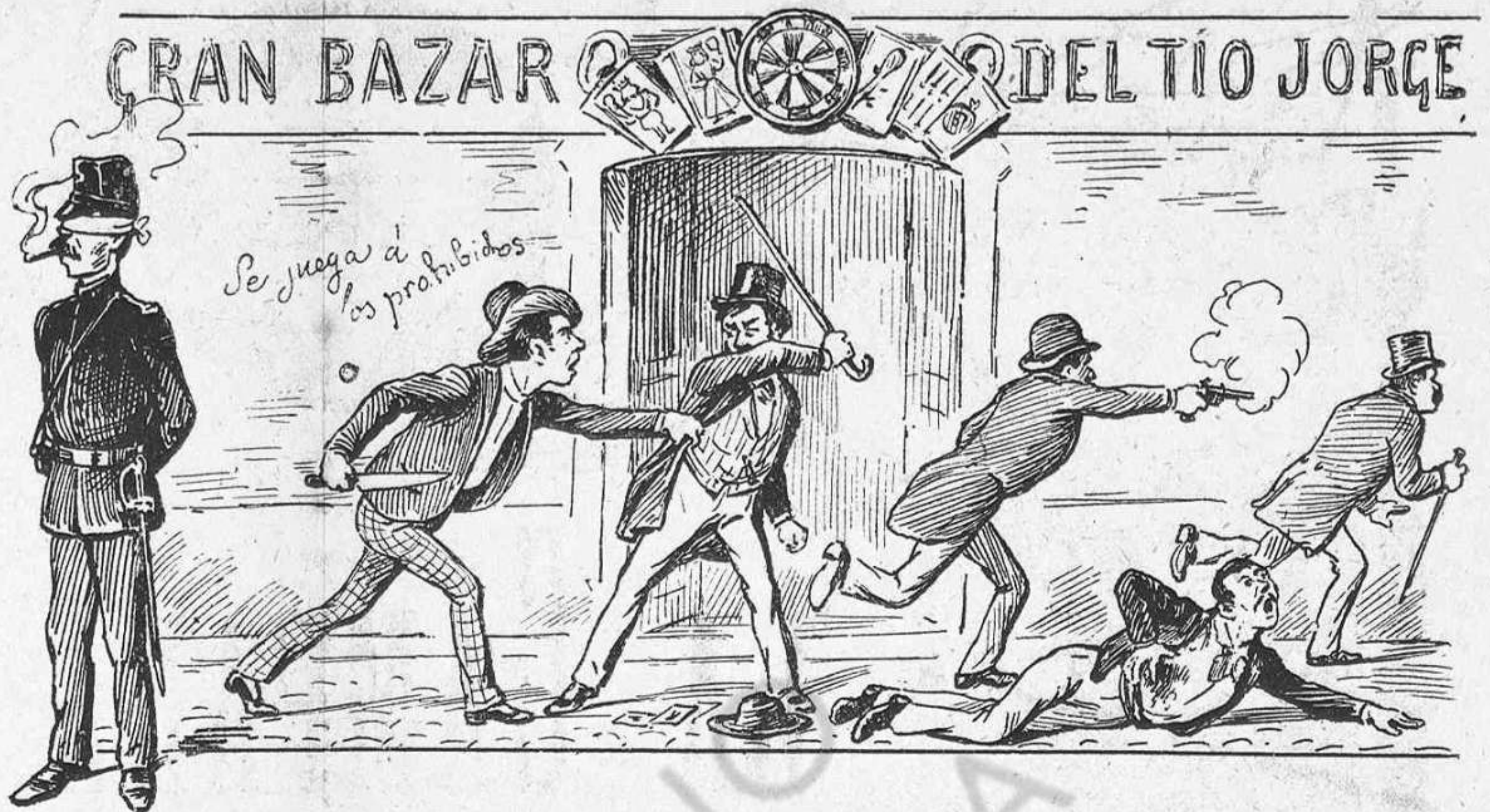
Jugant á la regeneració.

gloria de un torero triunfante, mientras, á la sombra, els governants ineptes carregan els daus electorals pera preparar els futurs desastres.»