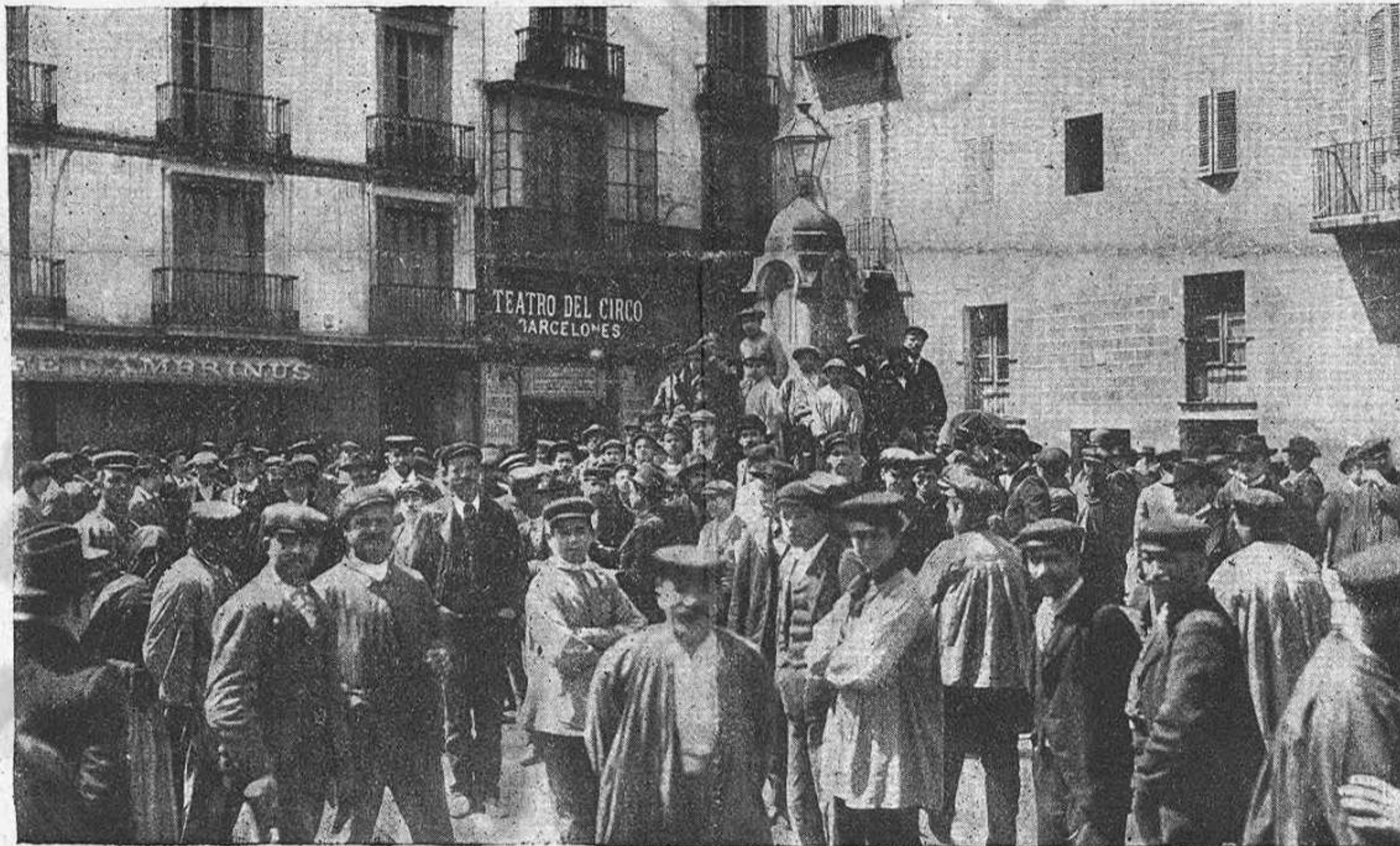
La sortida del Meeting.

En las passadas eleccions ho acabém de veure. Son