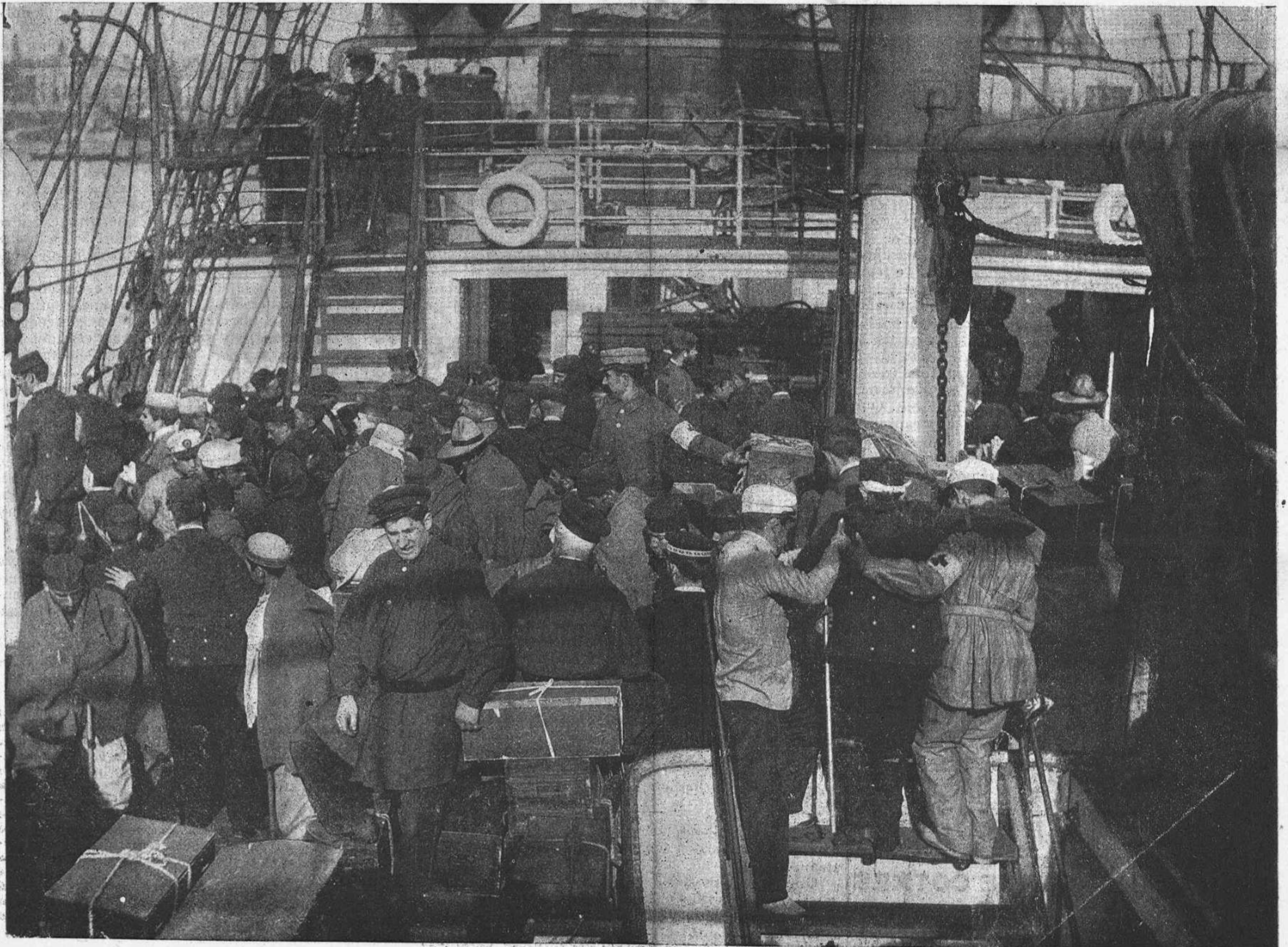
La cuberta del vapor Cachemire , al arribar de Manila '1 día 18 del corrent.