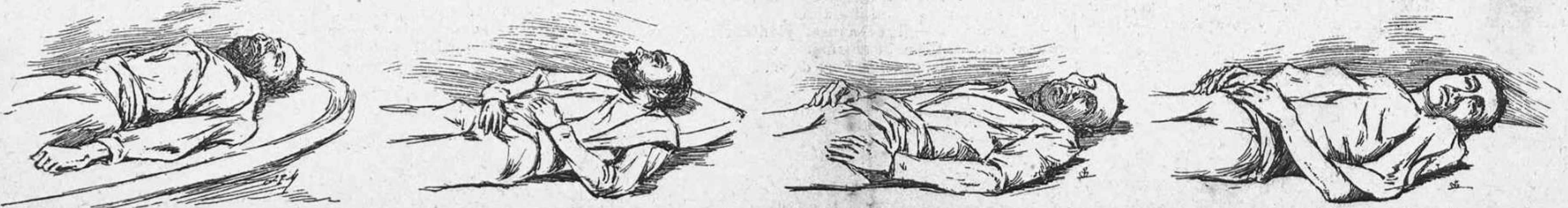
Extracció dels cadàvers del fons de la cloaca.—Los quatre cadàvers, tal com quedaren depositats en l' Hospital de Gracia.