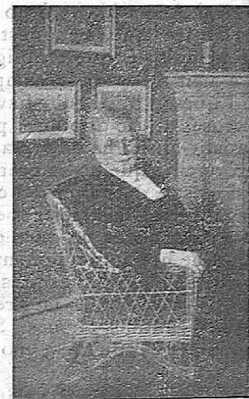
La senyora Nina Rang, ministre d'Instrucció Pública a Dinamarca.

No coneixem a la senyora Nina Bang, no en tenim la més petita notícia, però des d'aquest moment, sense conèixer-la, sense tenir d'ella la més petita notícia, nosaltres la preferirem a la majoria dels ministres d'Instrucció Pública que en Espanya han sido. Per què? Per manca de patrio-