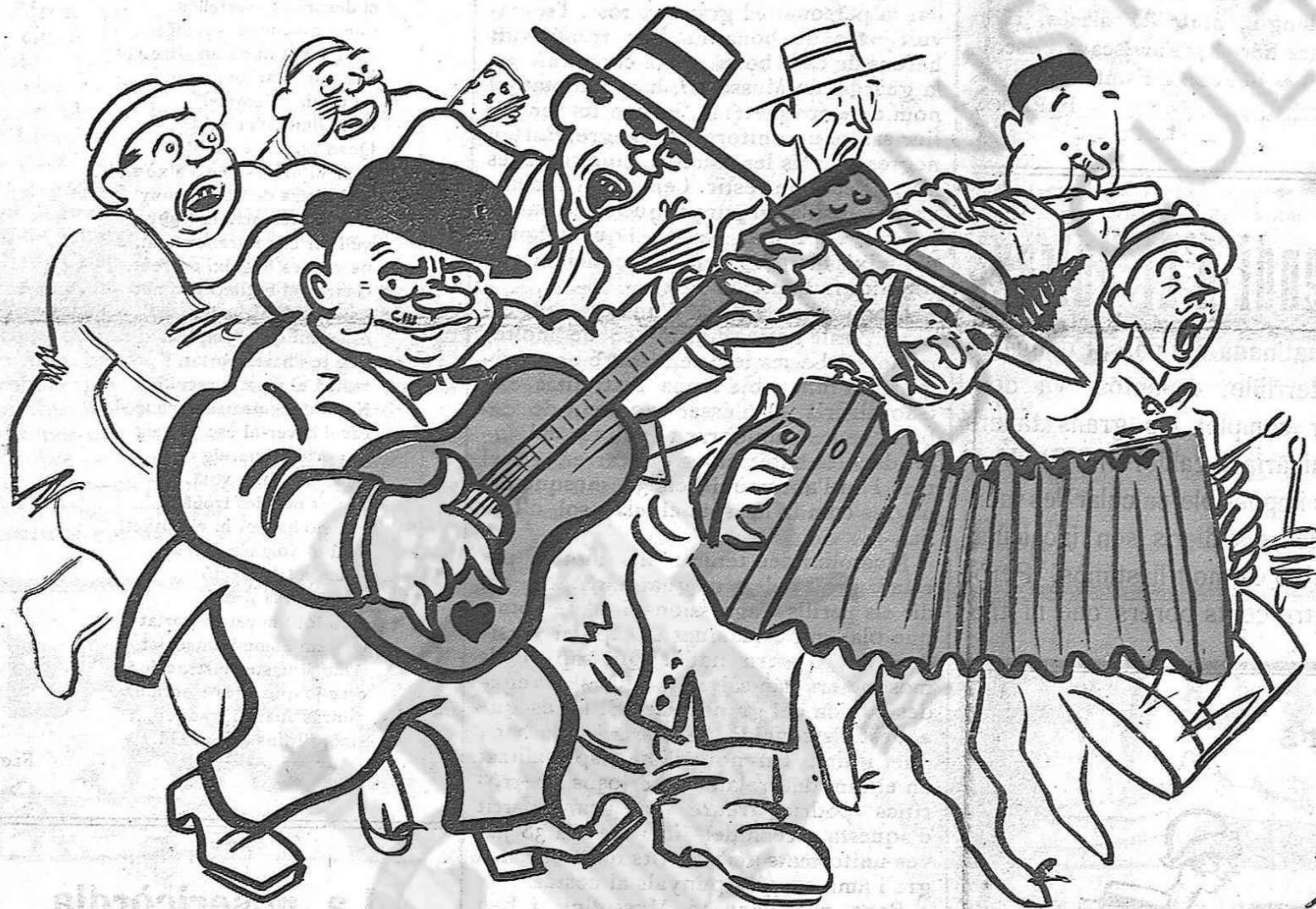
Una "juerga" a finals del segle passat.

PREUS DE SUBSCRIPCIÓ Fora de Barcelona cada trimestre: ESPANYA, pessetes 1'50. — ESTRANGER, 2'50