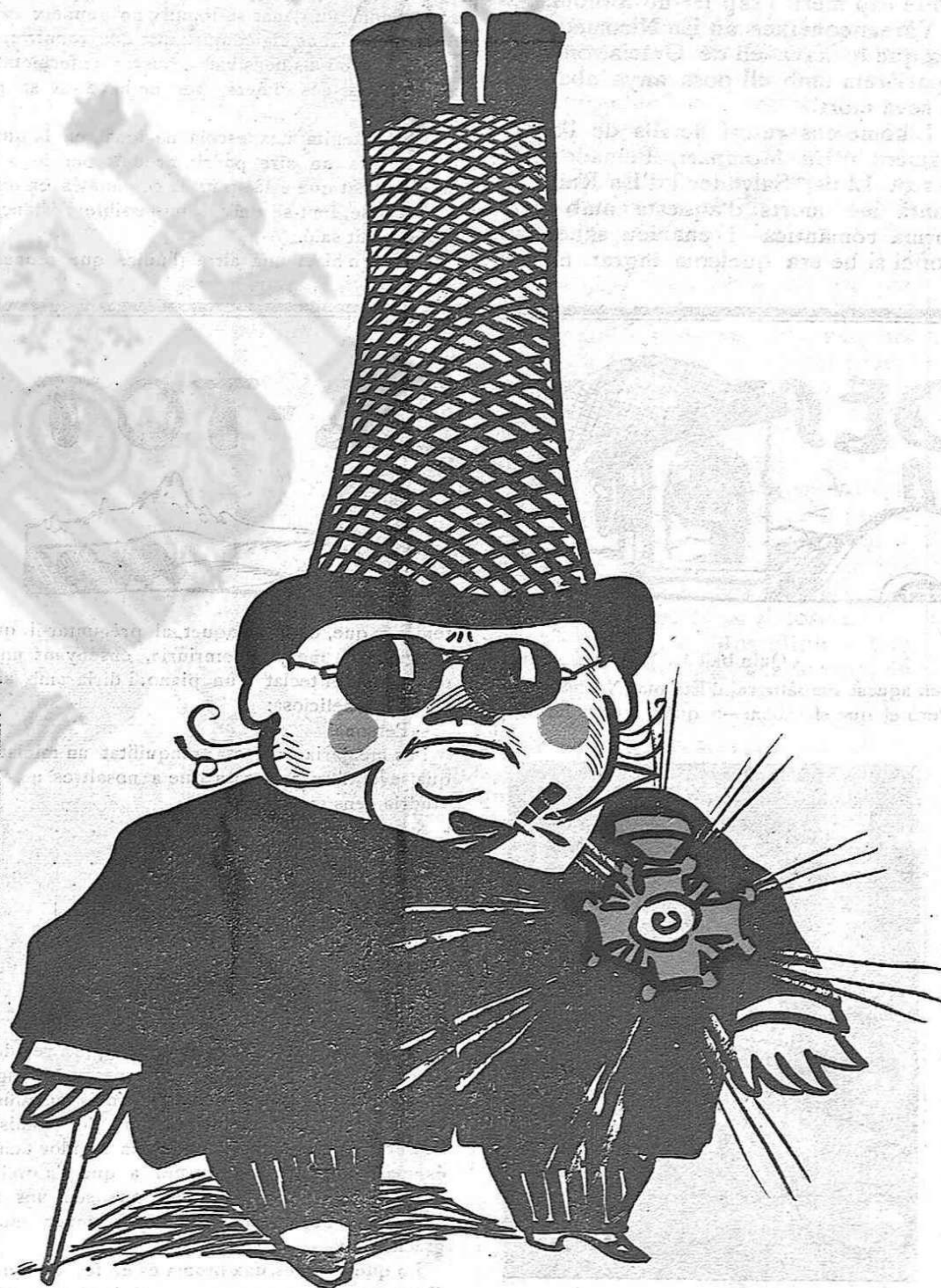
—Fins el barret sembla que m'ha crescut un pam!

perquè hi té la mà trencada; però mai podrà fer el miracle, perquè és massa gran, de proveir del material necessari durant l'any, per l'escola, amb 147'46 pessetes que cobra de l'Estat. Amb el que s'ha encariat el material escolar en aquests últims temps, no n'hi ha ni per a paper d'estressa.