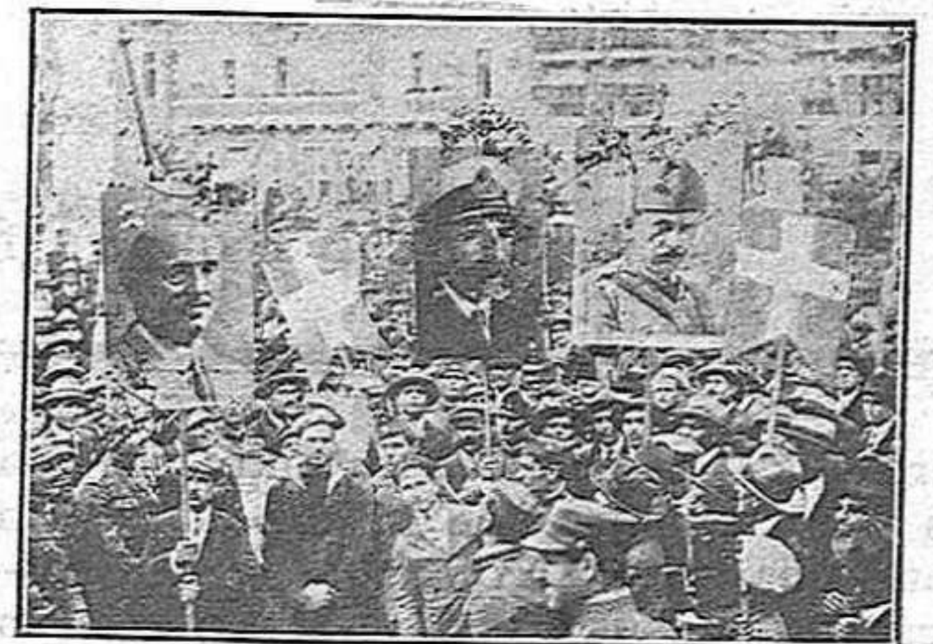
Una manifestació republicana a Atenes.

Aquest soldat s'arrenca l'escut reial del kepis. Somriu Sap que els reis són lluny i que, segurament, no tornaran mai més. El sol avui, an aquest soldat, li sembla com una immensa rosa d'or, en la llavor del cel meravellos d'Atenes.