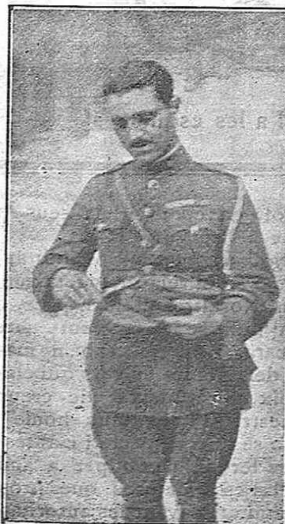
Un soldat grec arrencant del kepis l'escut reial.

Aquest soldat somriu. El somriure brolla en la seva boca com una meravellosa flor d'optimisme.