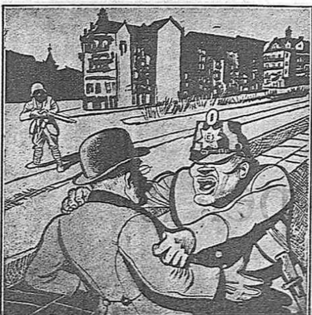
—Ara et tinc, lladregot! —D'un tret mataré dos ocells!

Es tracta dels jueus, senyors, dels jueus, vic-