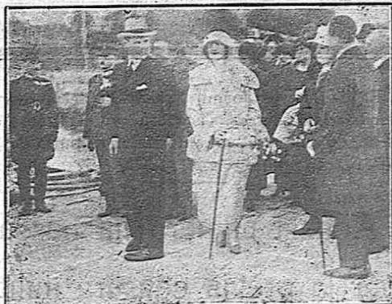
Els reis de Grècia s'embarquen a Pirée el 19 de desembre