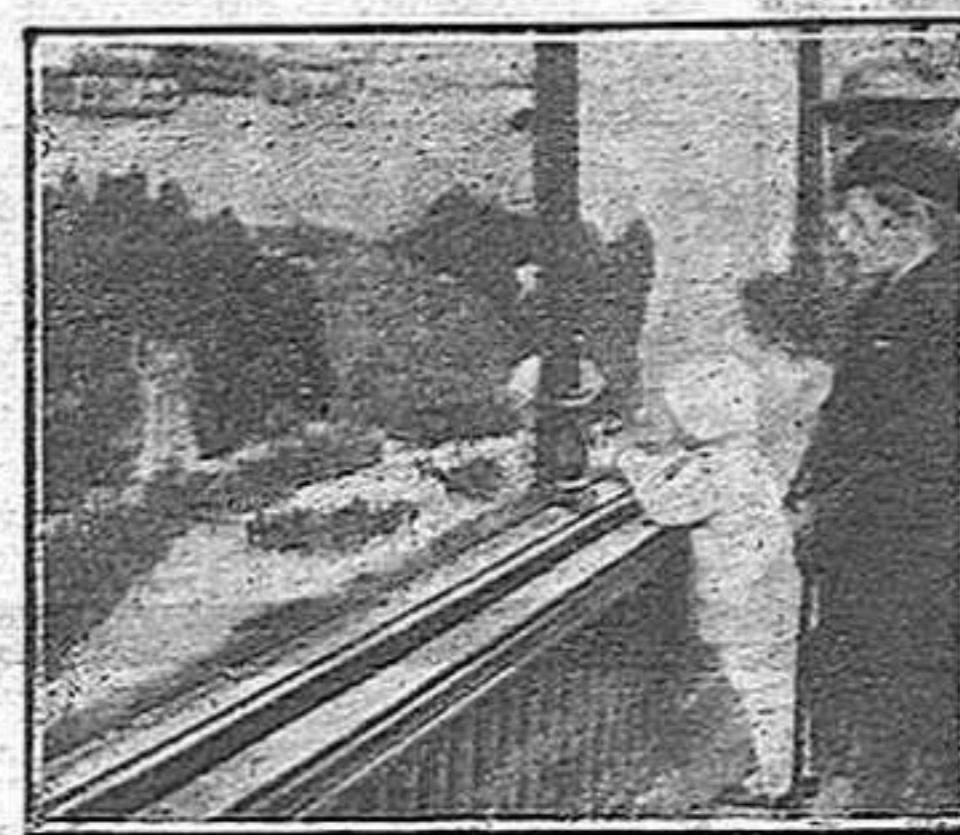
Un aparador en vigília de reis

S'ha d'educar la seva estètica i el seu intel·lecte