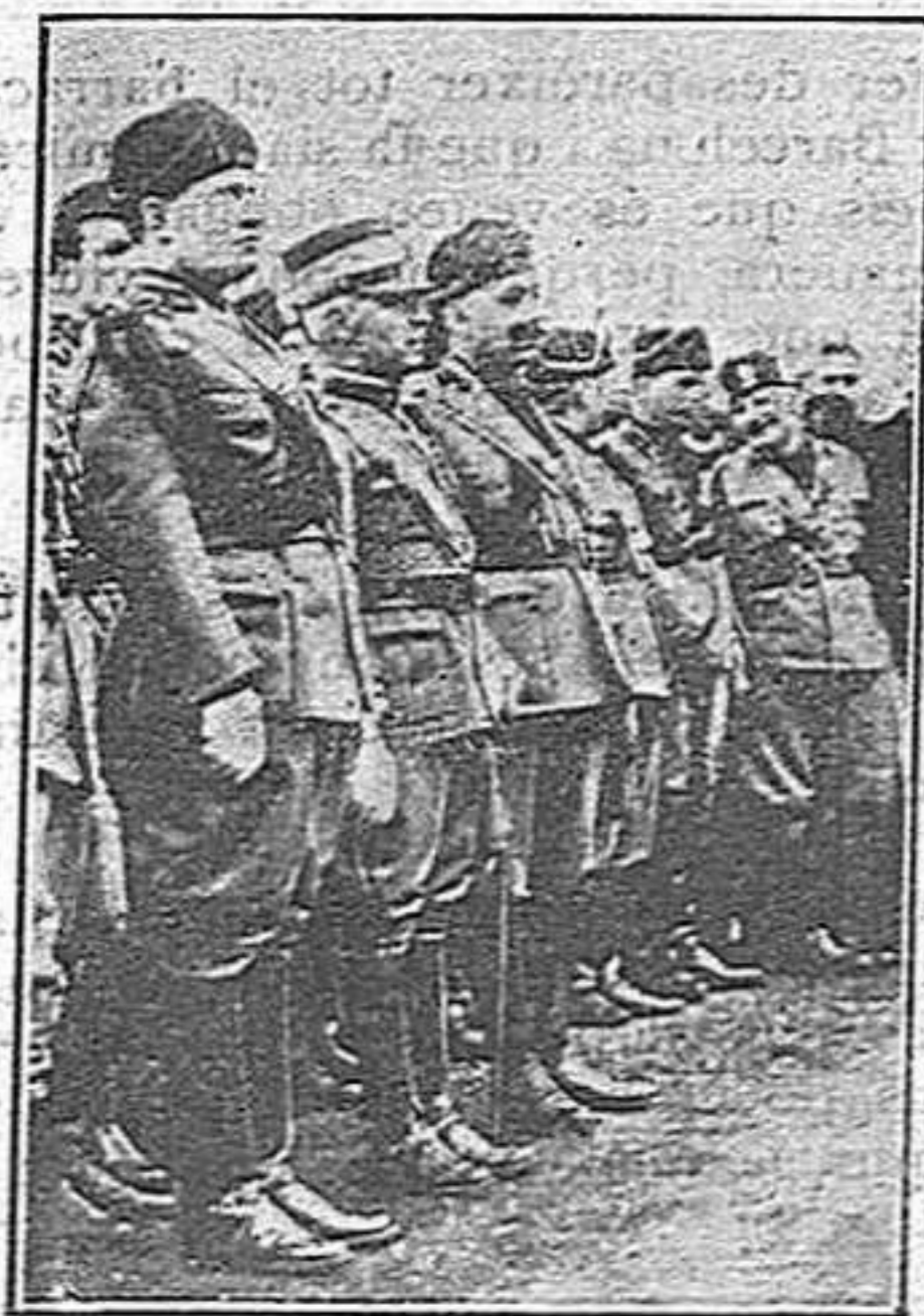
Mussolini en una revista militar a Milà