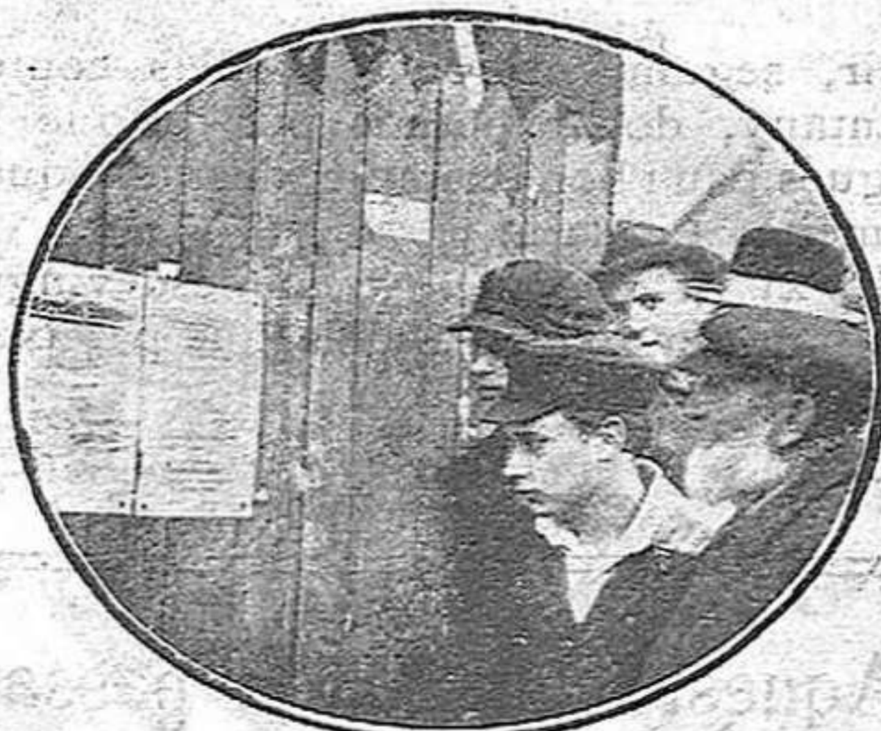
Obrers sense feina enterant-se de que s'apugen els queviures