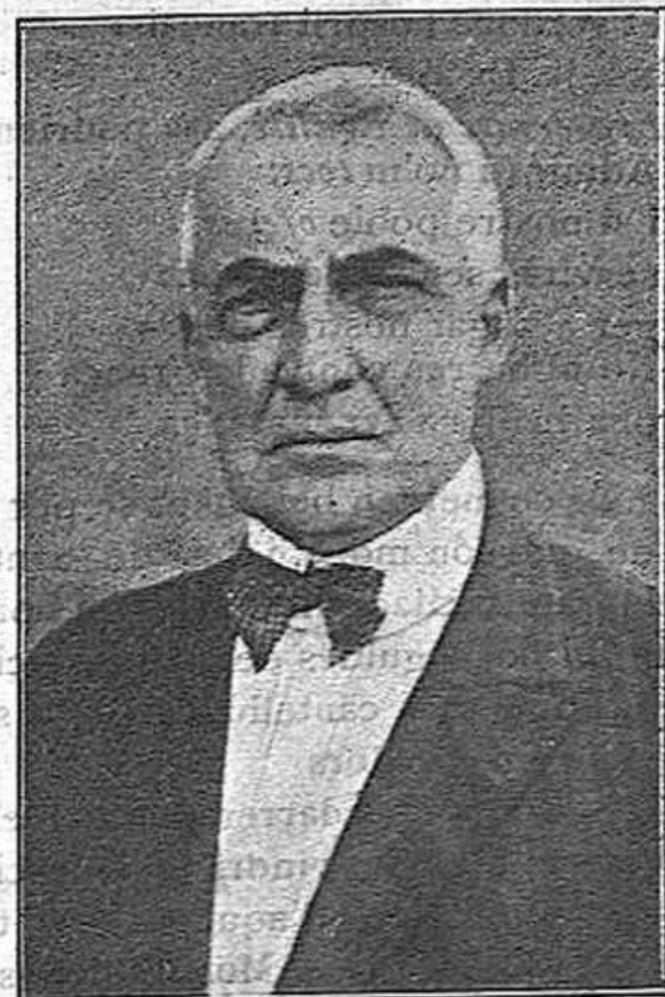
El president Harding

Aquesta és la sexta vegada que un cap d'Estat no acaba normalment els dies de la seva presidència. Tres són els presidents morts assassinats, i tres de malaltia. La Constitució nordamericana