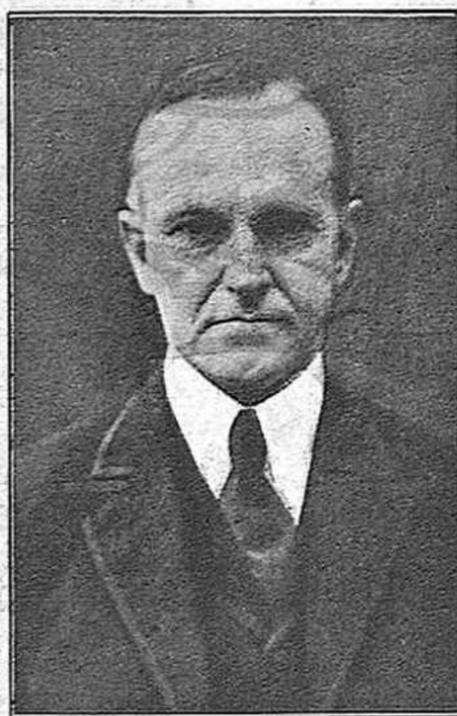
El nou president Coolidge

Mr. Calvin Coolidge que substituirà al malaguanyat president, és una figura diferent del tot. És més que un nord-americà un perfecte anglès. És fred, inflexible, magre, no riu mai. Reservat en extrem, silenciós, és enemic acèrrim de les manifestacions oratòries. La seva vida privada és d'una corpenedora simplicitat. És molt sever, molt per a ell i per als altres. Una vaga de pollicemen que esclatà a Boston, ell la reprimí amb tant rigor, que encara se'n parla a hores d'ara i fa tretze anys.