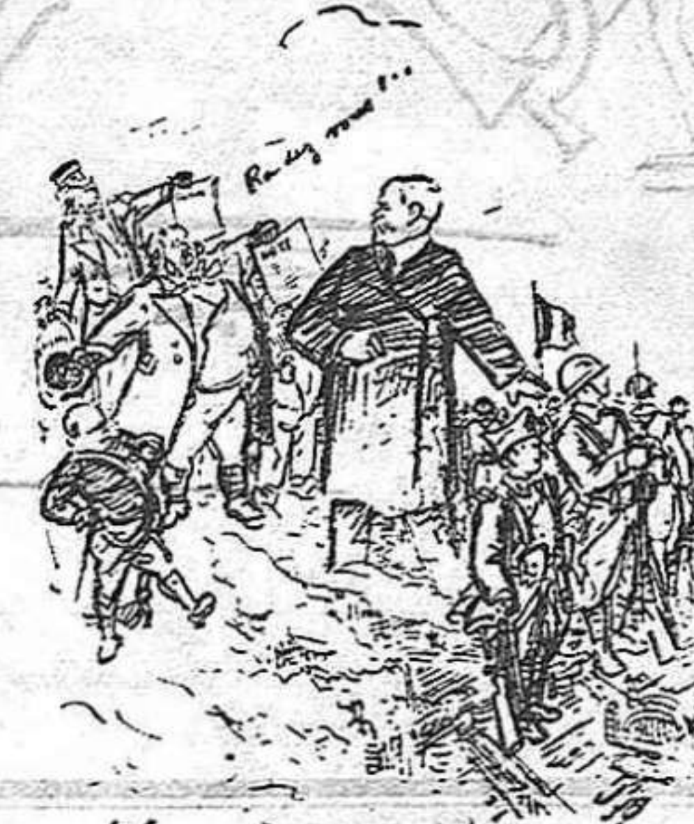
—Tinc aquí la guàrdia, i no es rendirà pas! (De Le Rire)

No s'acaba ni s'acabarà. Uns i altres tossuts. Notes i més notes i vinga no entendre's i vinga fastiguejar a tothom.