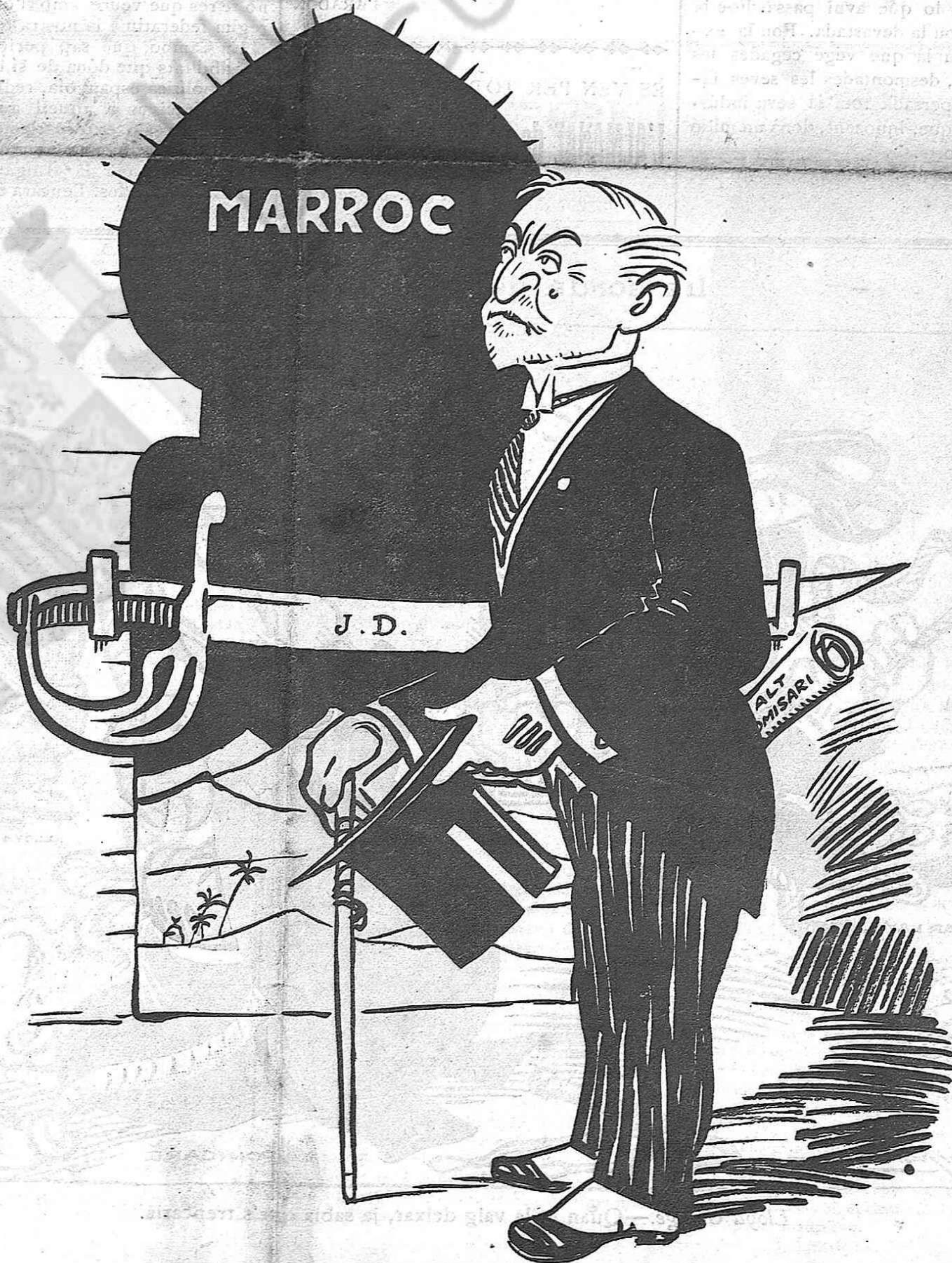
En Villanueva.— Aquí és l'espasa la que no'm deixa passar a mí.