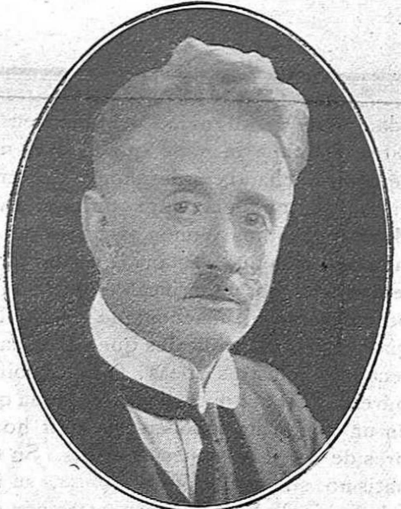
William Cosgrave President

MADRID No val a fer judicis temeraris. Estiguin tranquils els madrilenys i els barcelonins que a la nostra peccadora ploma, avui per avui no li volem fer dir res que posi en entredit a cap de les dues ciutats. De moment no volem esbrinar quina de les dues té més aire de capital, ni si la plaça del Sol és més gran que la de Urquinaona. Madrid, aneu a sapiguer perquè, sempre ens ha sigut molt simpàtic. Podem sentir fins fàstic pels homes que governen i que circumstancialment sojornen an ella, però pel poble, pel poble de la vila de l'ós, no. Ells tindran tots els defectes que's vulguin, però tenen alegria, i això als nostres ulls els redimeix de molts pecats. An aquí, quan la moda de les cues arribà en el seu punt àlgic, veieu, per exemple a la que's formava davant de la carboneria, homes i dones amb cara de tres déus, maleint el seu destí i tot lo que hi hagi per maleir, i total per fer cua. A Ma-