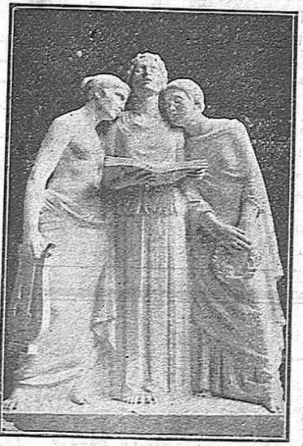
Grup en marbre que corona el monument al cèlebre compositor belga Cèssar Frank

PRESENT DE PAU La Ville lumière , la gran ciutat de París, ha fet un present de Pau a la heroica Bèlgica. París ha ofrenat a la nació germana el monument erigit en honor de Cèssar Frank, el cèlebre music a Lieja, vila natal del gran compositor. Es certament bonic, i molt bonic, que quan la vella Europa torna a sentir l'esgarrinxada, la febre de la guerra, París, on es cova el germen d'una nova tragèdia, alçant-se per damunt dels seus dolors, faci tan bell present al poble que oterí el