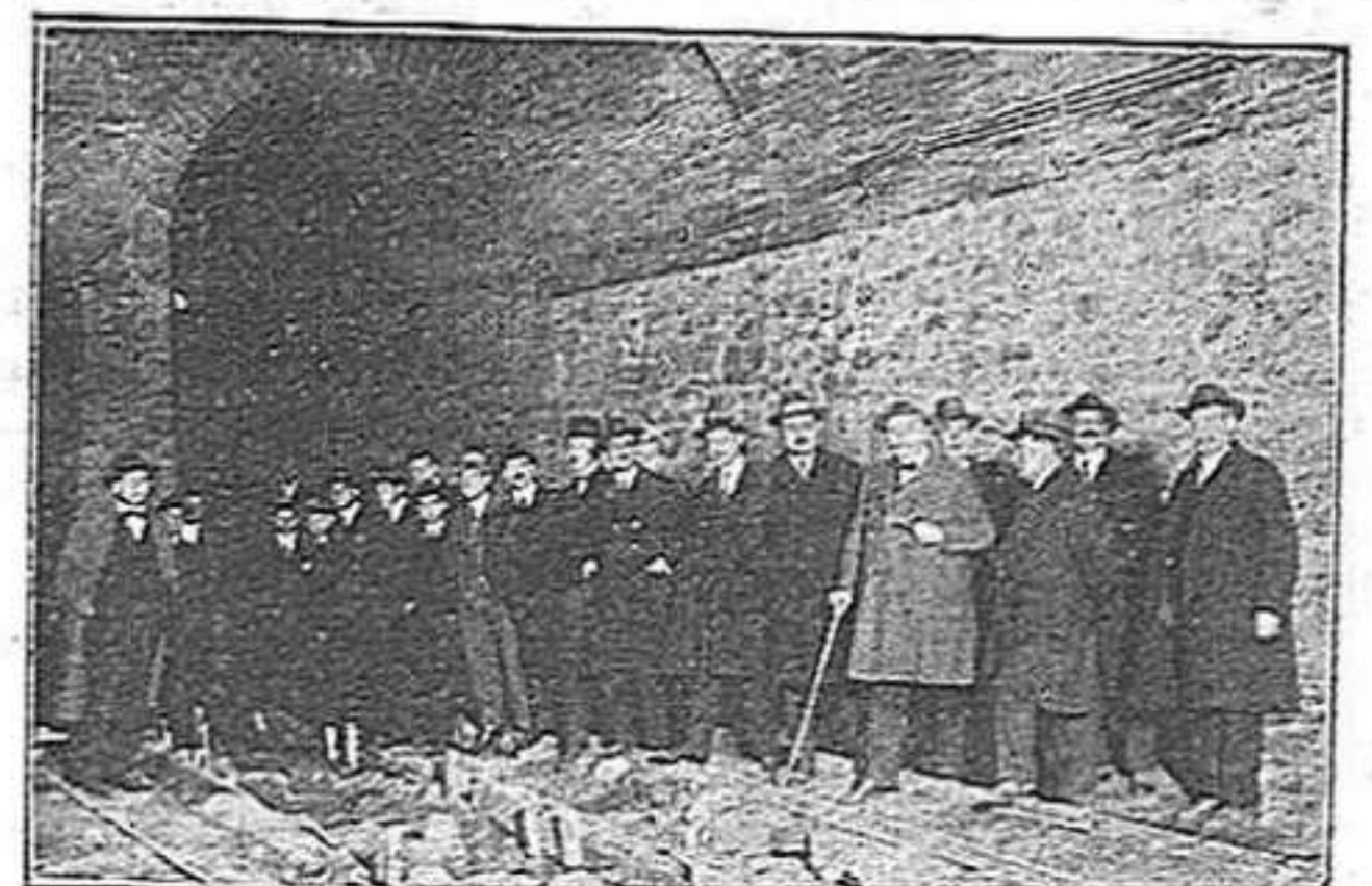
La visita a les obres del Metropolità de Barcelona

L'esforç realitzat per la Companyia portant a