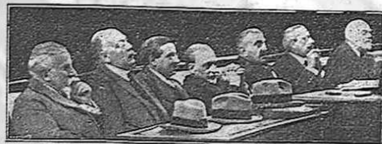
Gouvaris i els ministres grecs escoltant l'acusació pronunciada contra ells en la sessió del Consell de Guerra

La sort d'aquests homes, que no fa gaire tenien