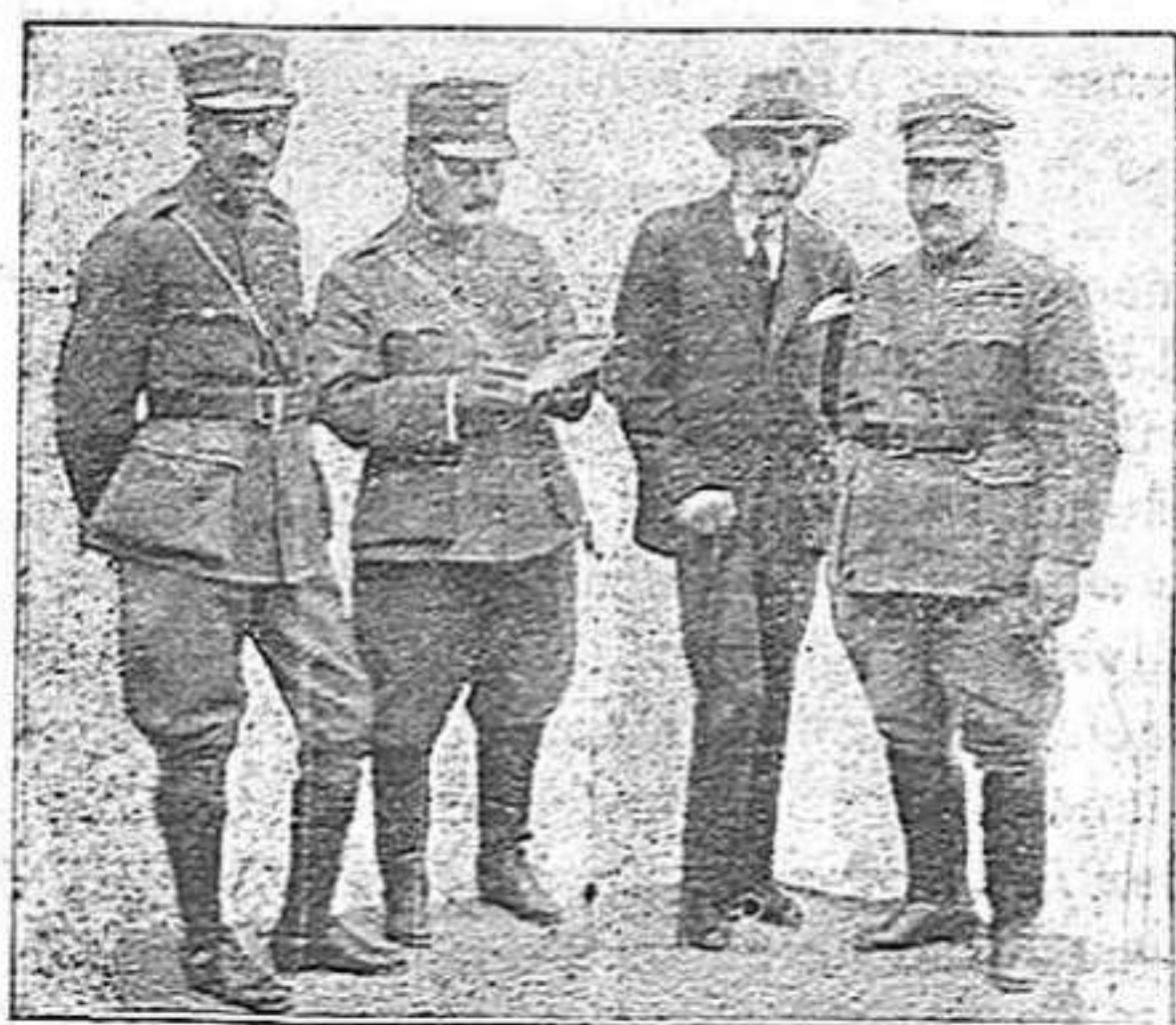
El Comitè Revolucionari d'Atenes

I és que quan es té raó, no hi valen forces, ni potències. Lo millor és pendre exemple i tindre'l present per quan arribi el cas.