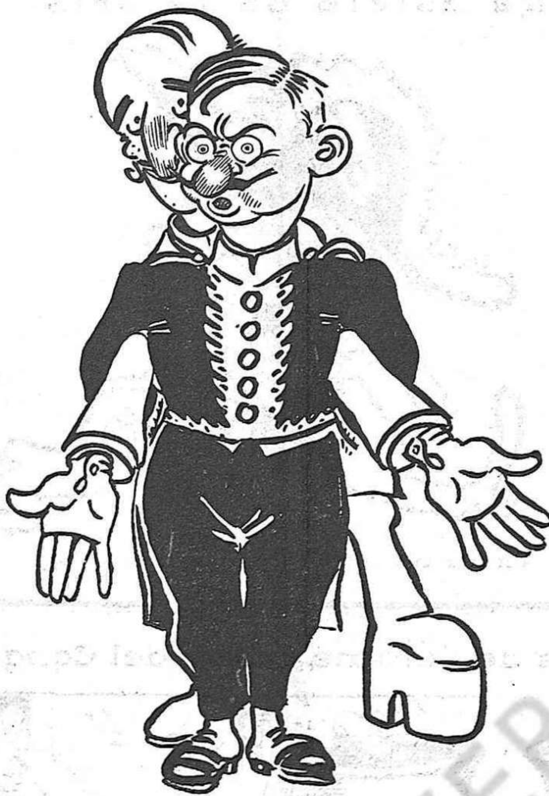
El Pelele d'En Romanones

reposin en pau els deu mil morts. Ara vindran les eleccions i tothom farà plataforma electoral de ses ossamentes. Tots els pescadors d'actes voldran venjar la desfeta de Mont-Arruit. Tots prometran exigir formalment, fermament, enèrgicament les més estretes responsabilitats als causants indirectes i directes de l'enfonsament d'Annual. I al parlar