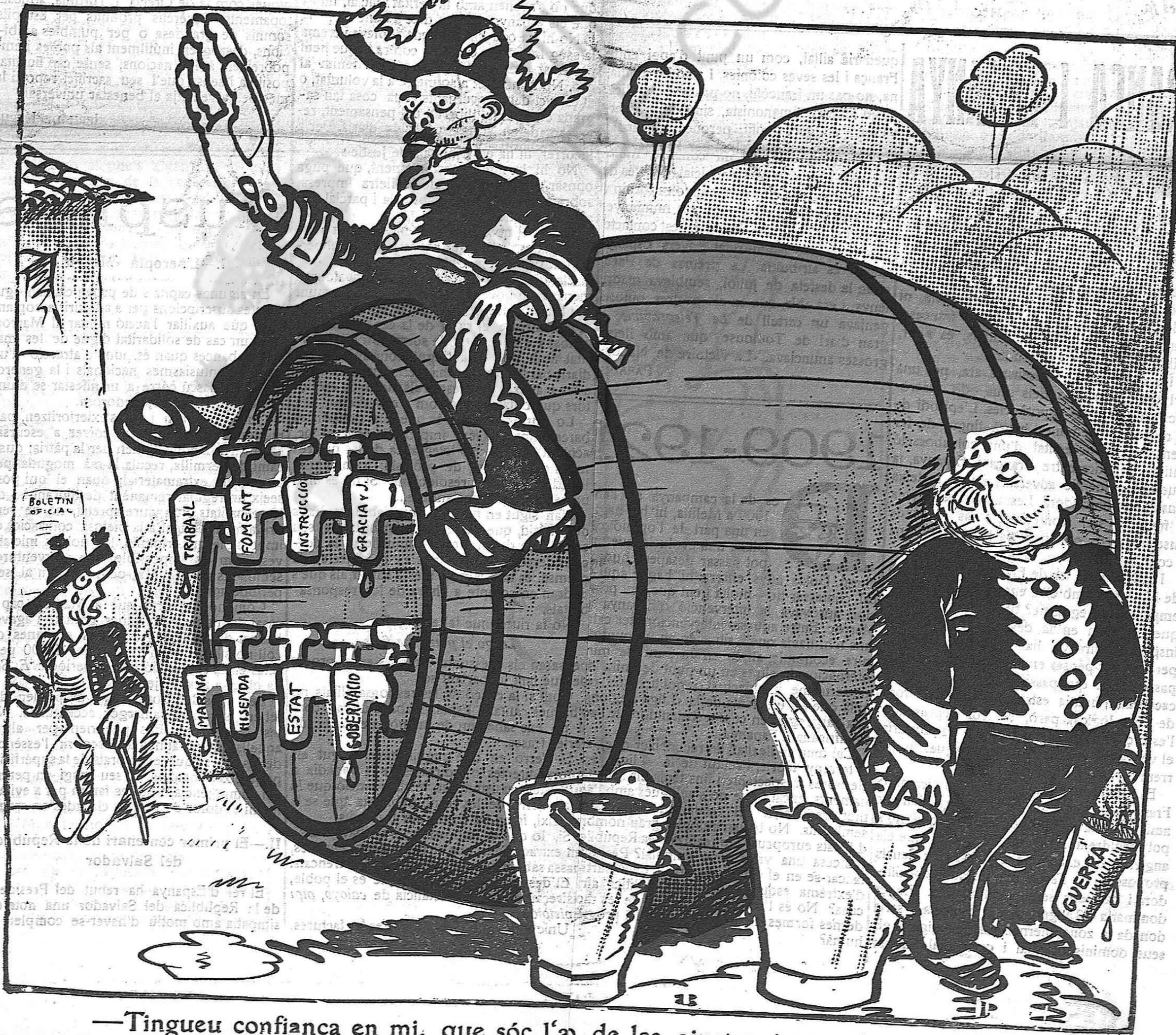
—Tingueu confiança en mi, que sóc l'ab de les aixetes, i estan ben tancades.