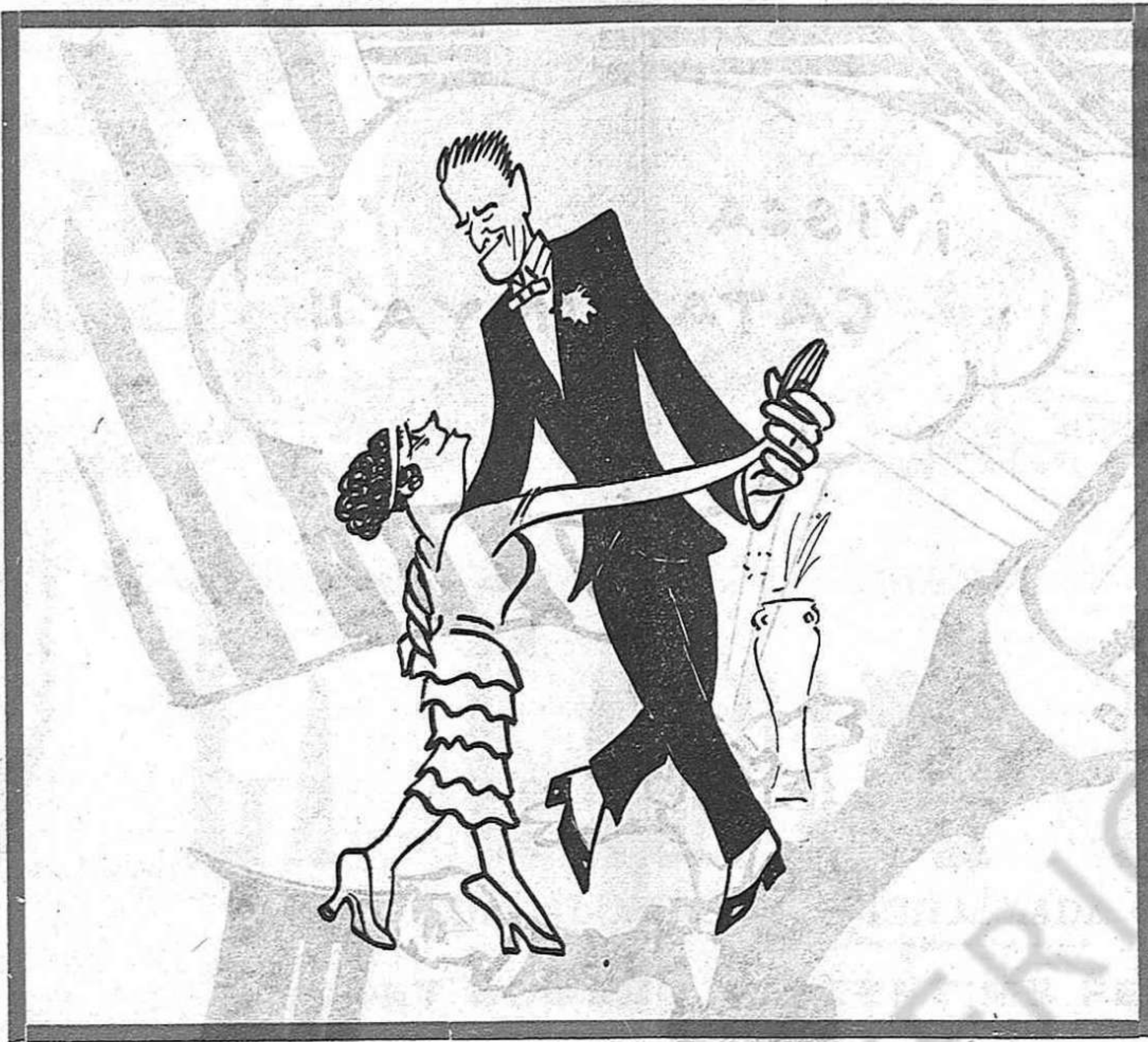
Este mundo es un fox-trot y quien no lo baila... un estaquirot.