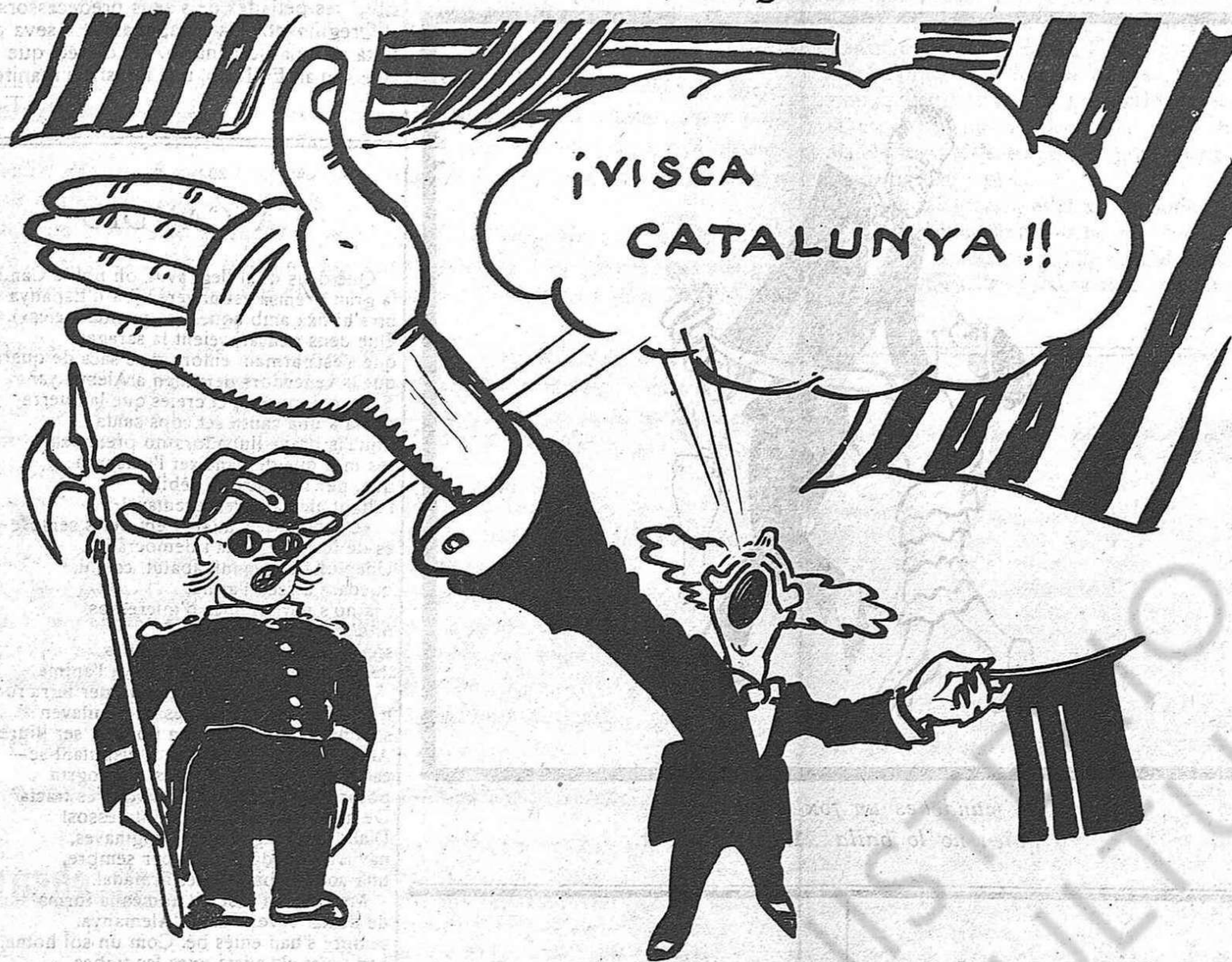
El senyor Esteve.—Quin remei li queda, pobre home!...

velas galantes, Catálogo de piropos andaluces i Declaraciones amorosas en versos libres.