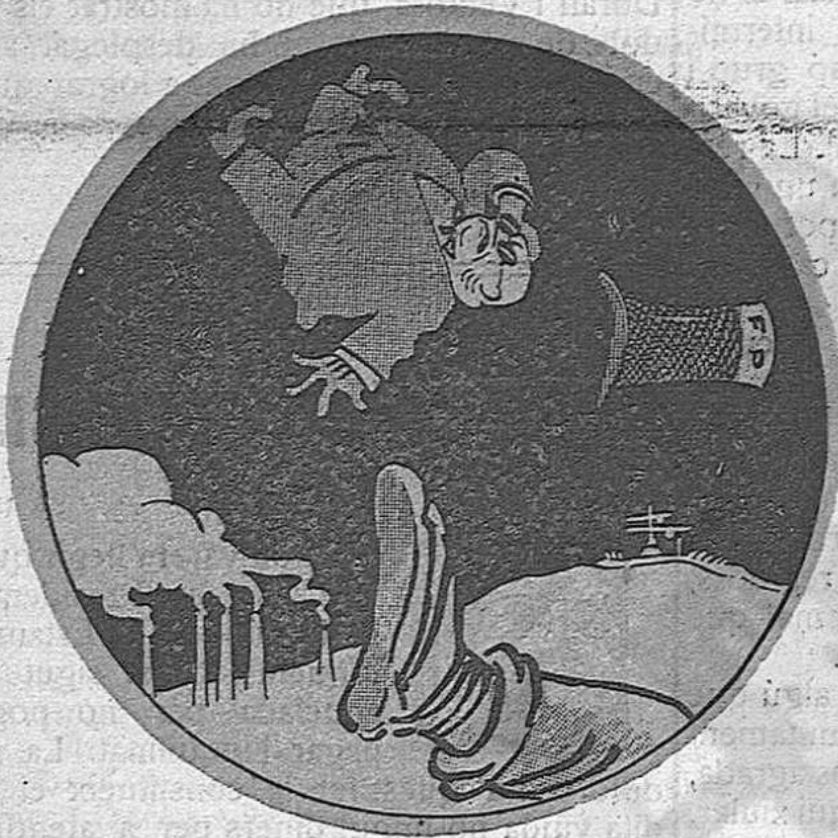
La «Federació Patronal» queda a l'al-tura del betum.