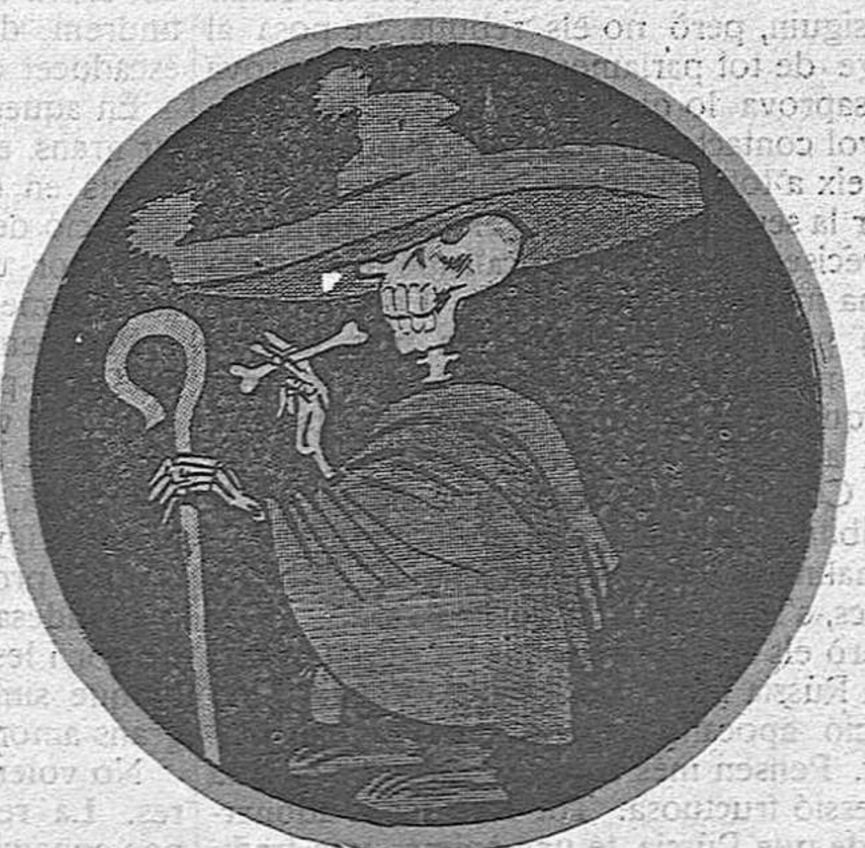
I mentrestant el poble segueix atipant-se degut a la baratura de les sub-sistències.