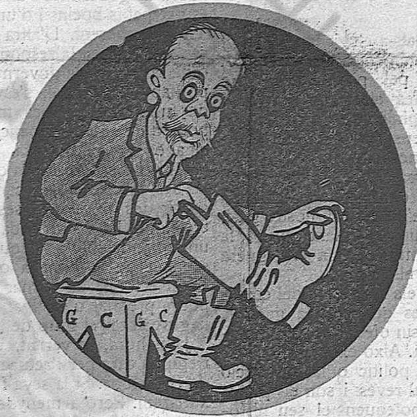
El governador s'ha calsat les botes