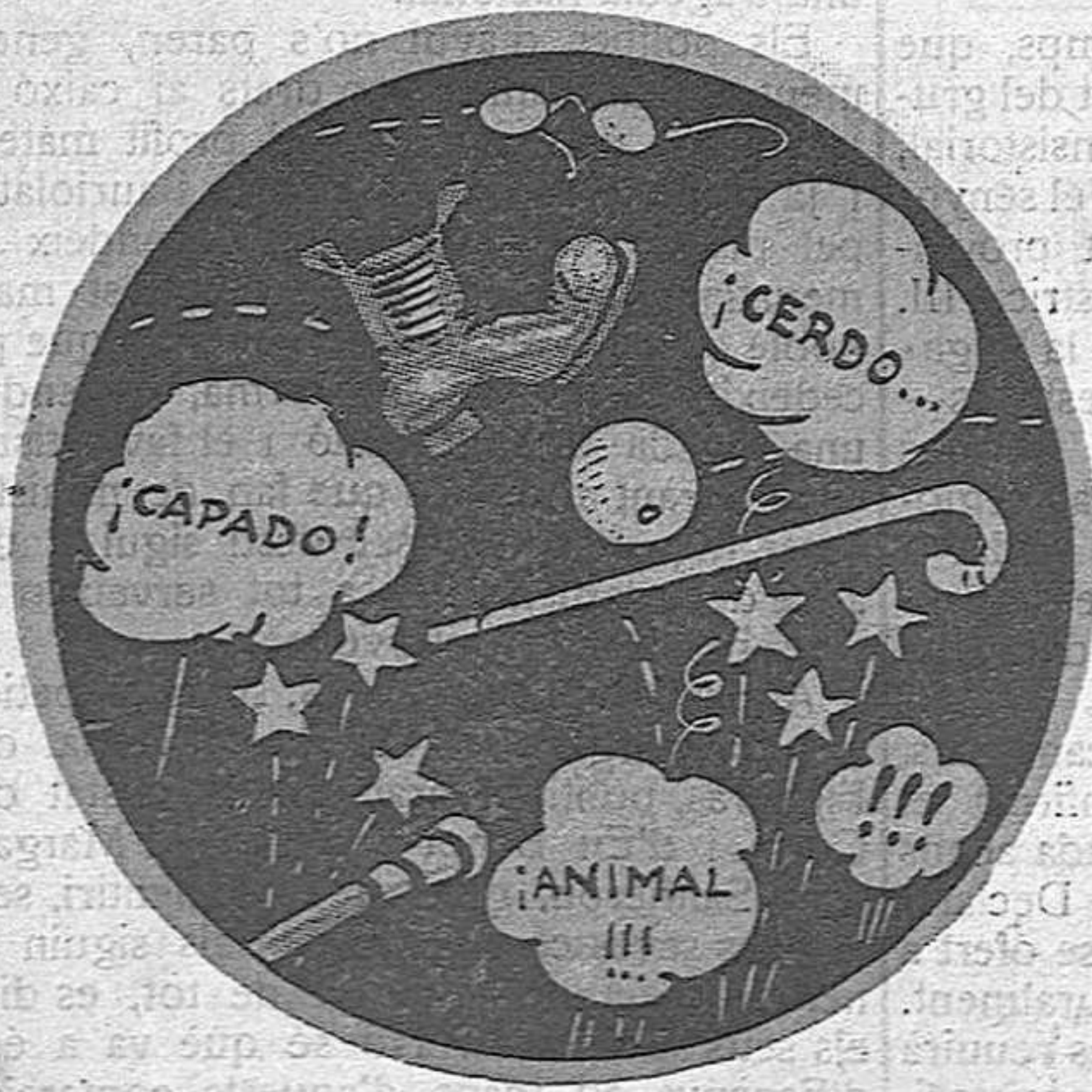
En el Congrés d'Espanya, segueixen els debats amb una harmonia que encanta.