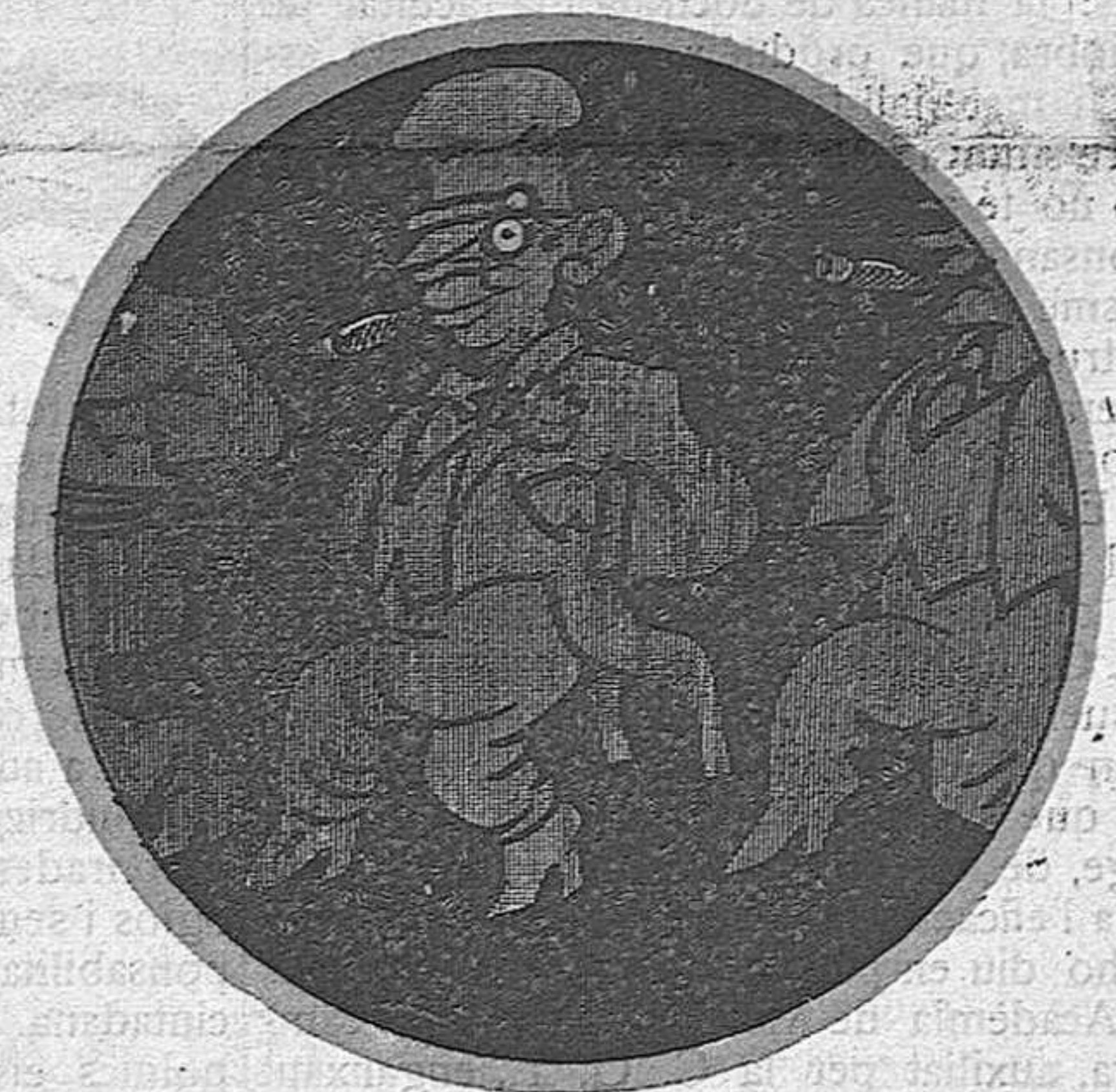
Els radicals presenten uns quants candidats banquers amb els quals la Hisenda Municipal anirà d'allò més bé.