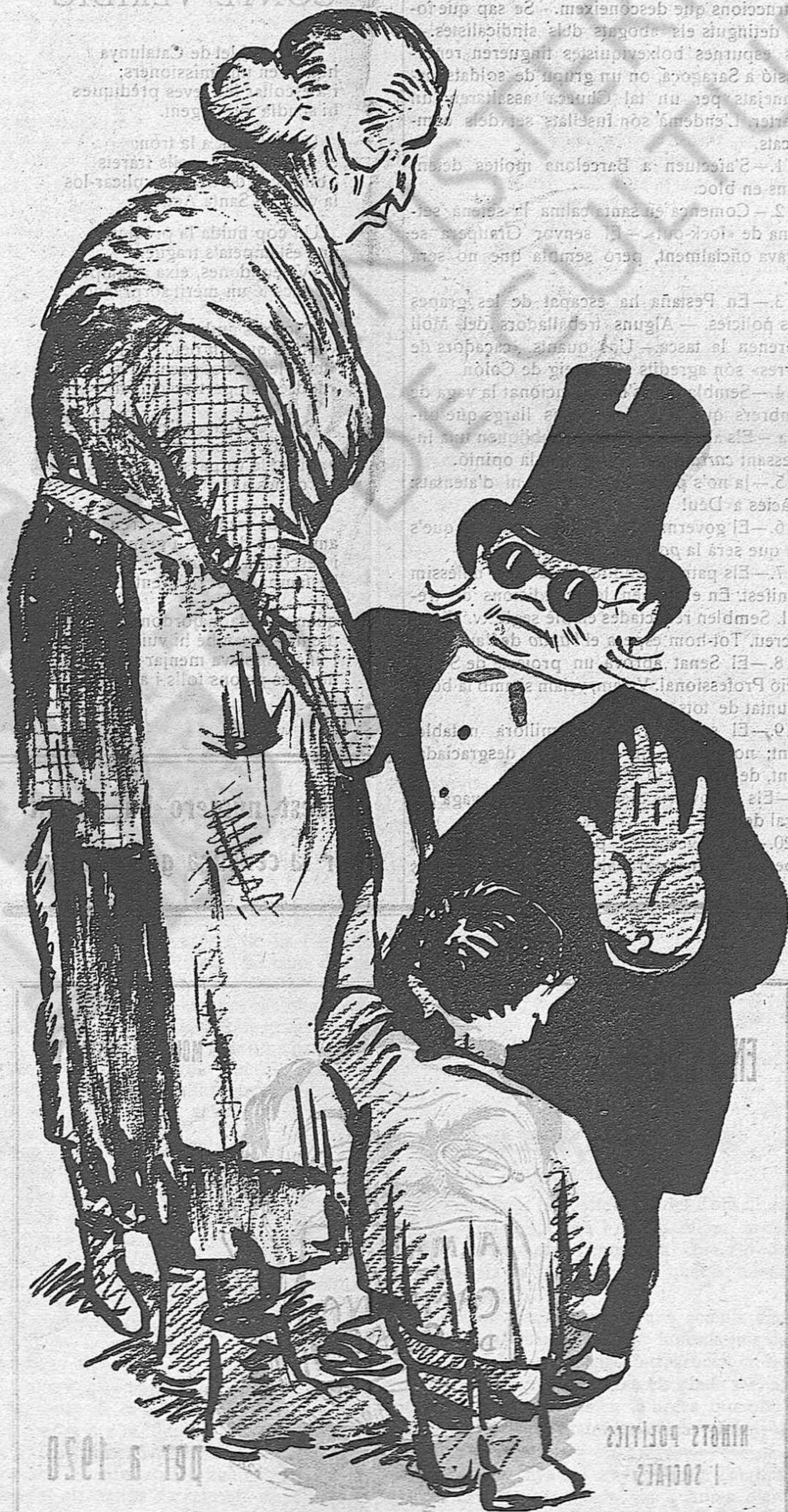
—Senyoret... Set setmanes que no treballem... — Jo fa cinquanta anys, i no em queixo.

Havia vist arrenclerades i arrodonides, sobre una safata monumental, un veritable