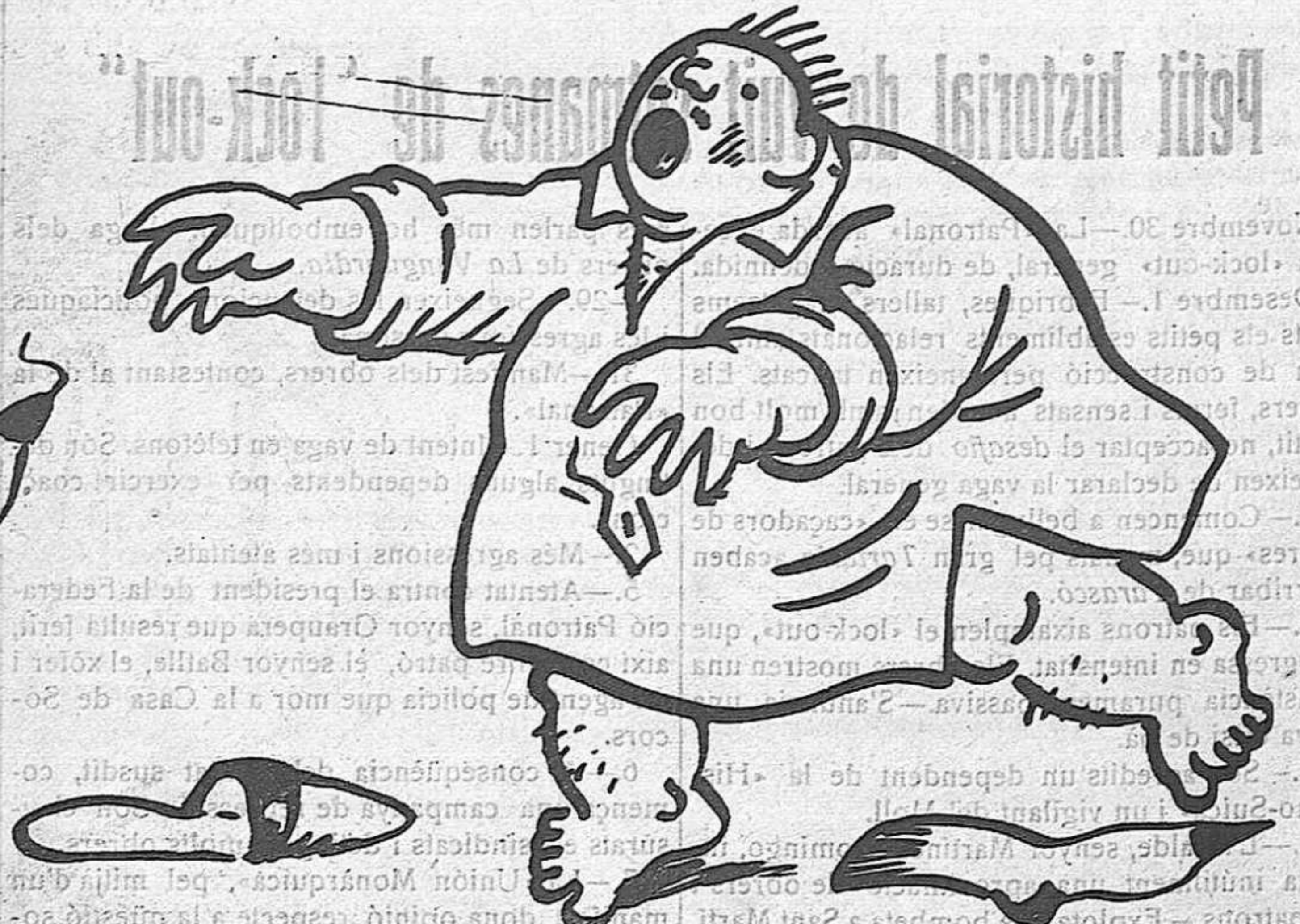
Lladres!... Lladres!... que a dins de la butxaca hi tenia el tabaco!