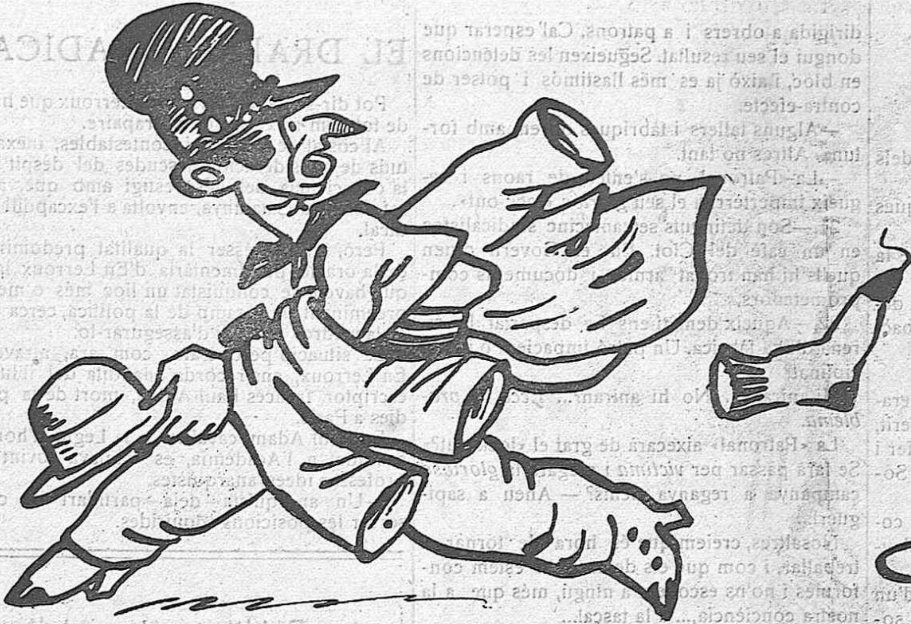
EL MAL MAJOR