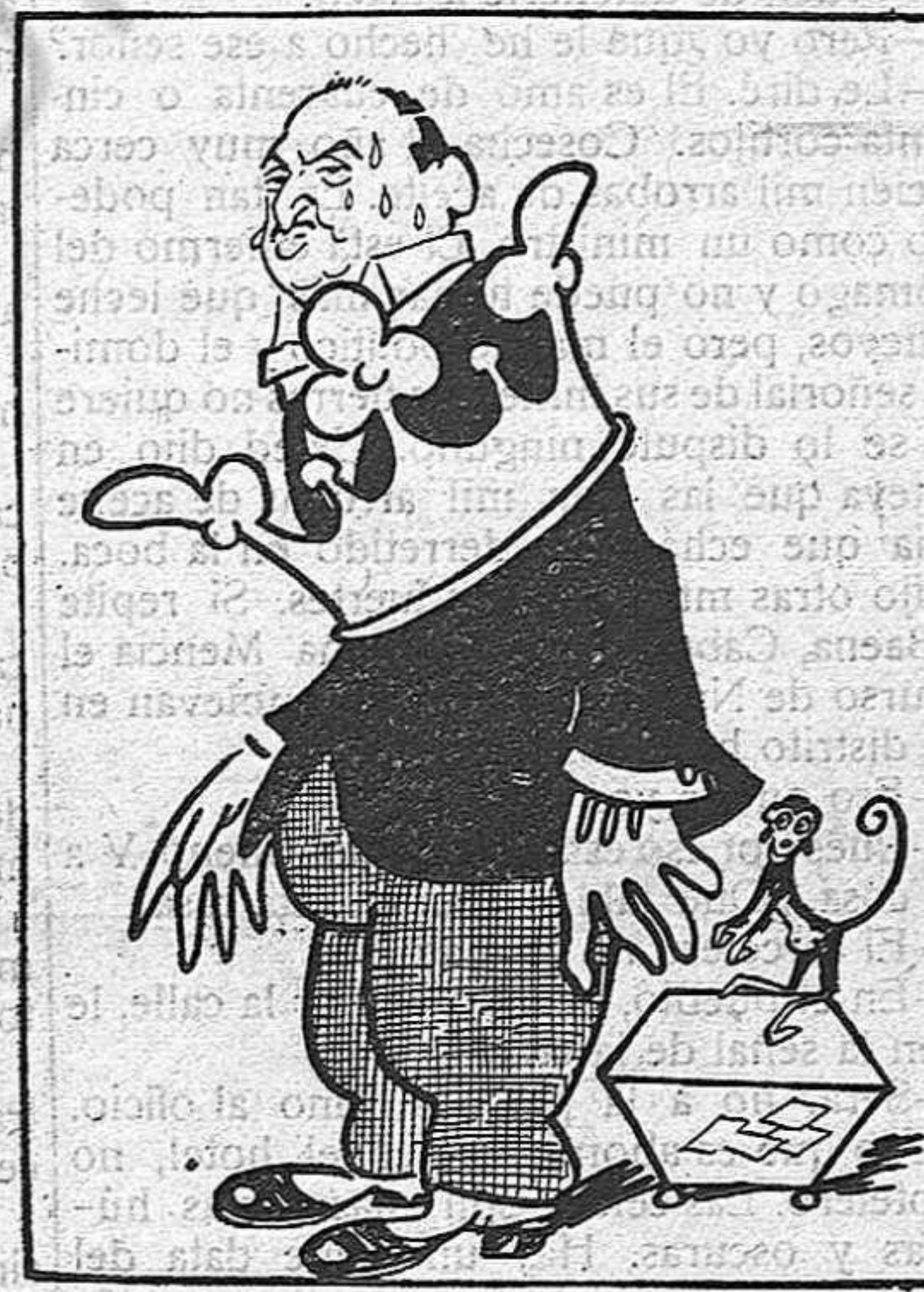
—Ja és trist i desesperat, el paper de derrotat!...