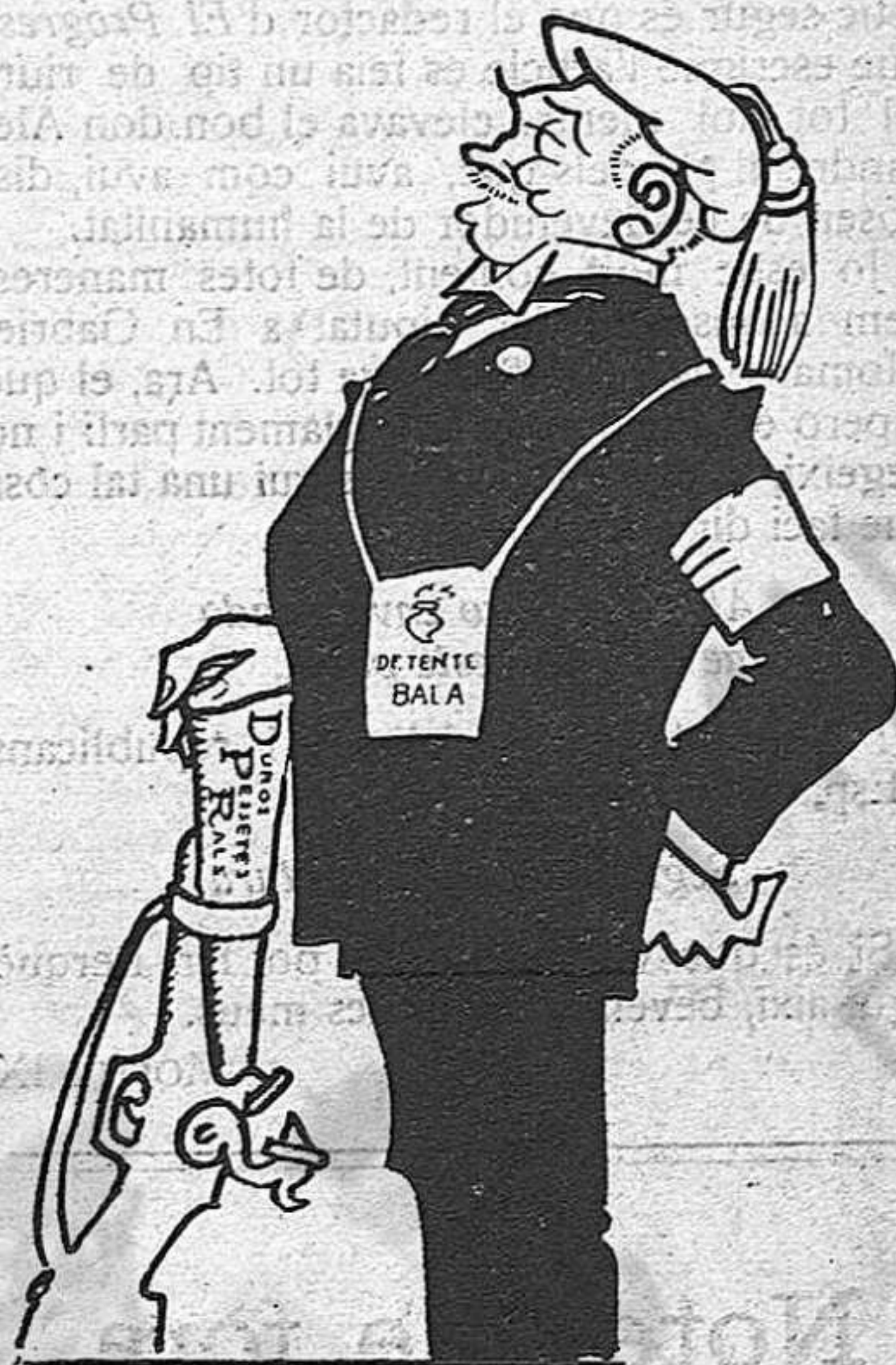
—Pobre «Lliga»! Com ho faria sense el «Déu, Pàtria i Rei» de la meua bandera?