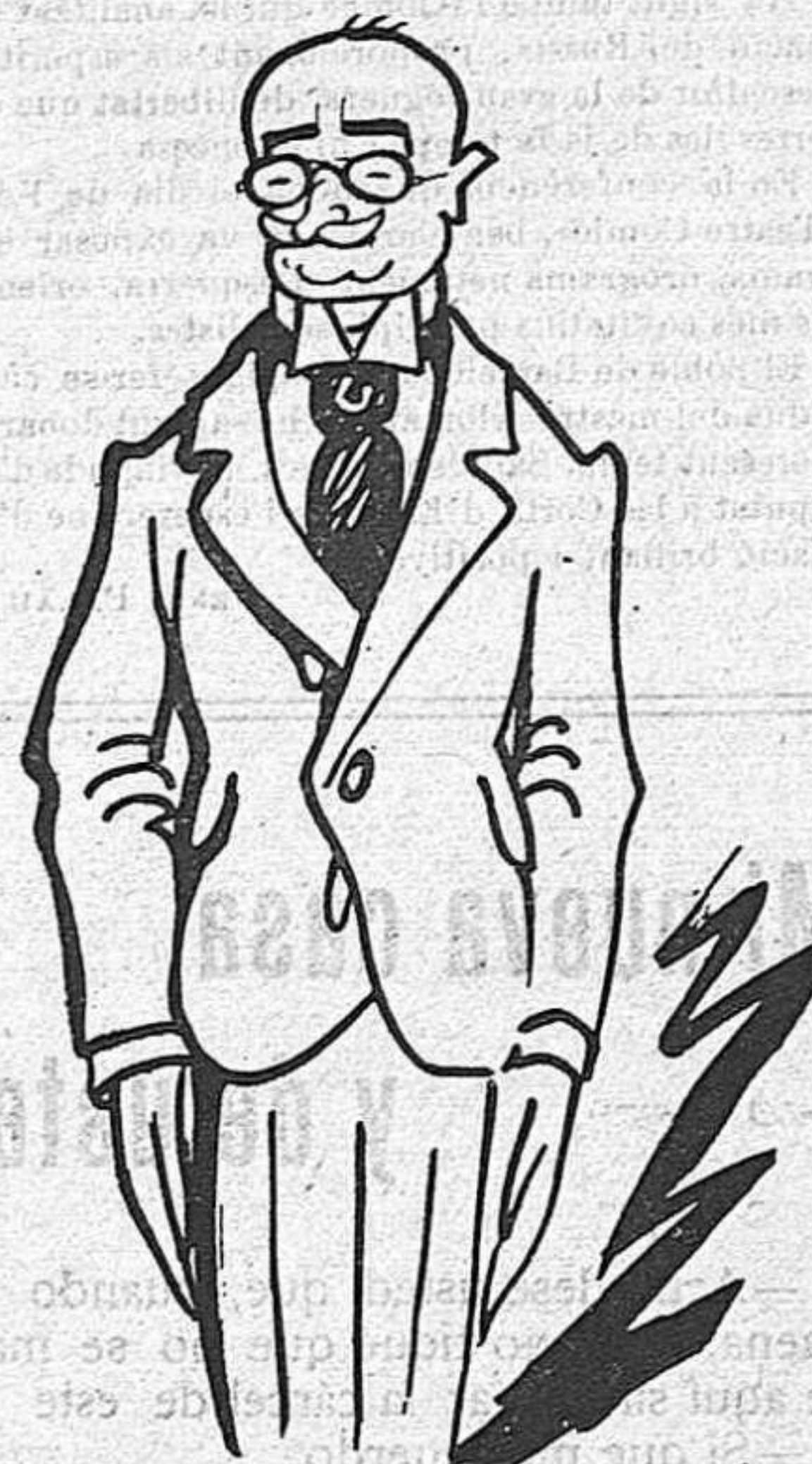
—A mi potser no'm sentiran la veu, però, en canvi, traduiré tres o quatre sonets d'En Shakespeare.