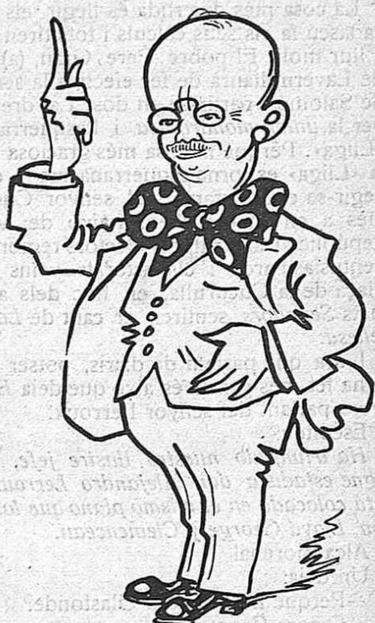
—No s'impacientin: el dia que inauguri la companyia, debutaré jo.