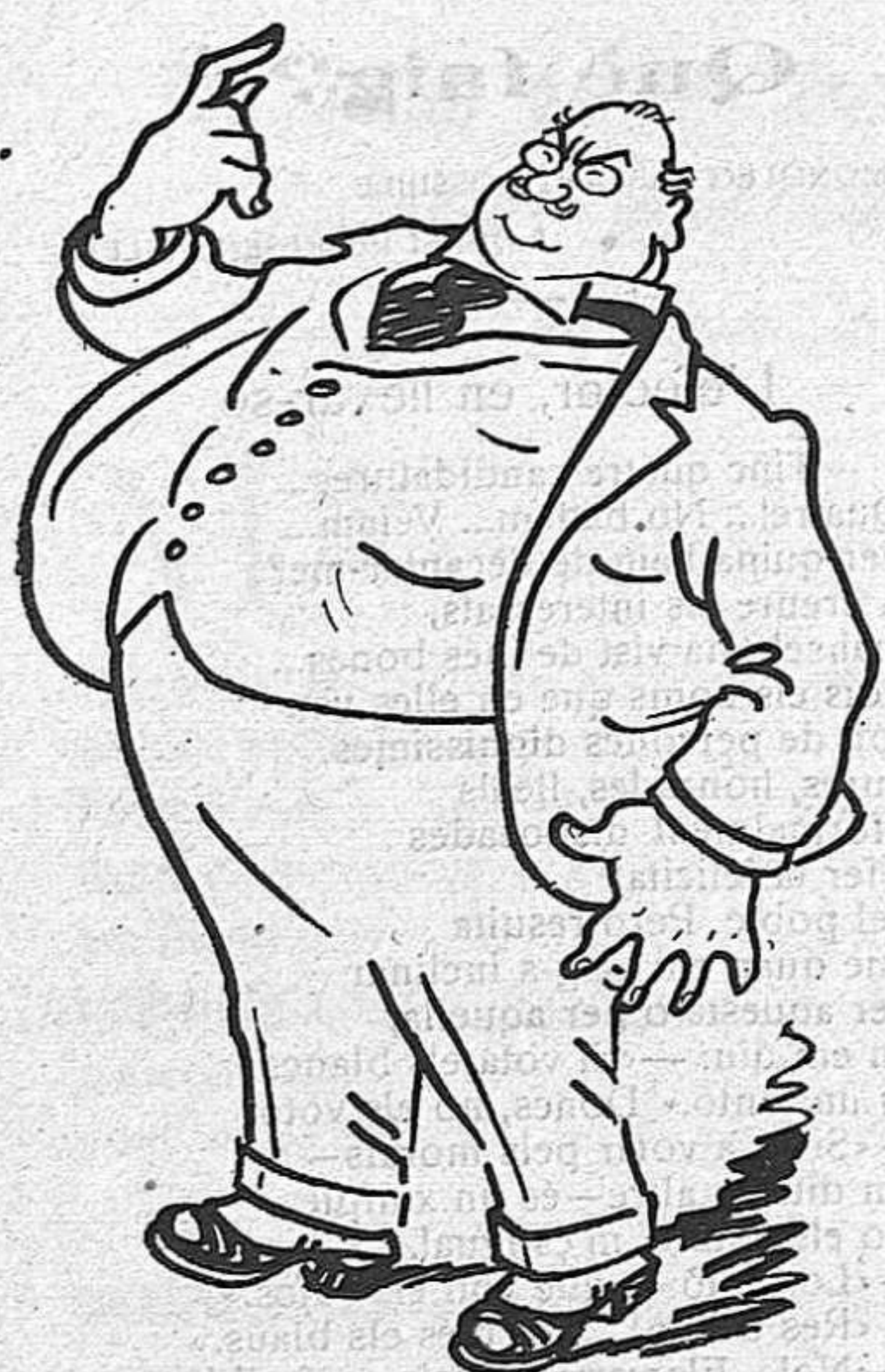
—Quien se va de Sevilla, però conserva una cadira a Barcelona... no pierde su silla.