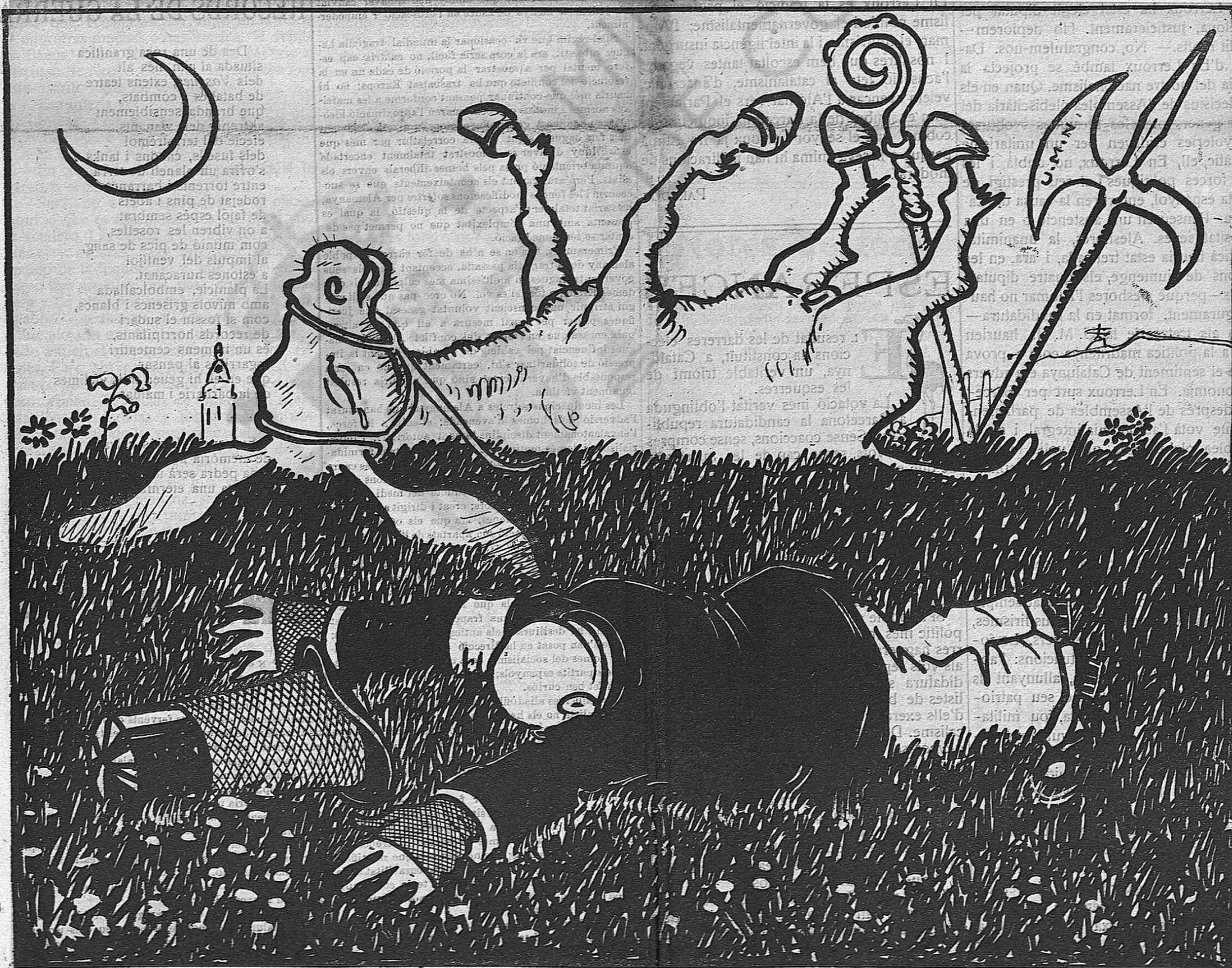
—Ara sí que puc ben dir que he caigut del burro.