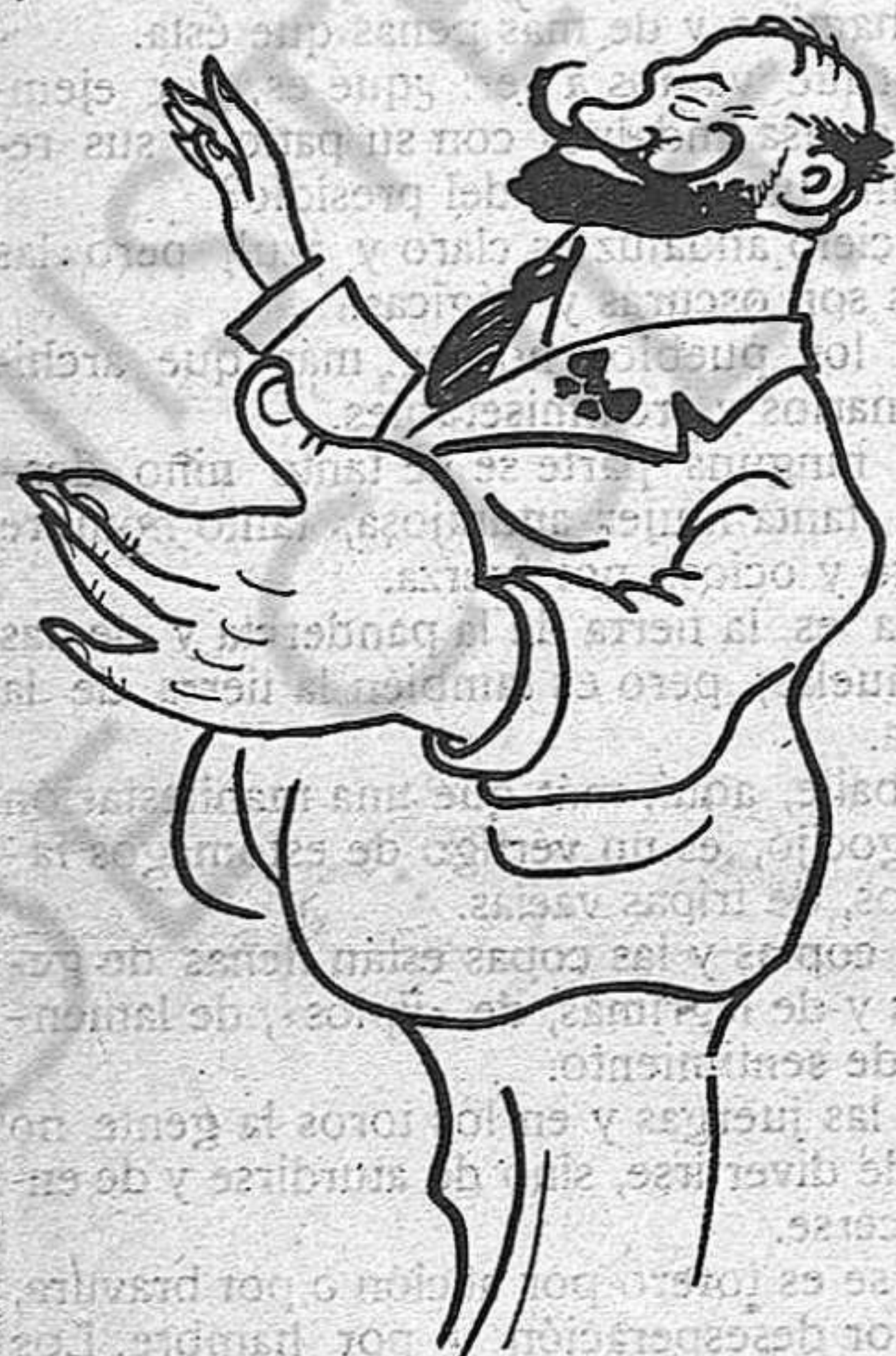
—Alegrin-se, cavallers; entre l'Alomar i jo, resta a salvo l'Esquerra Catalana.