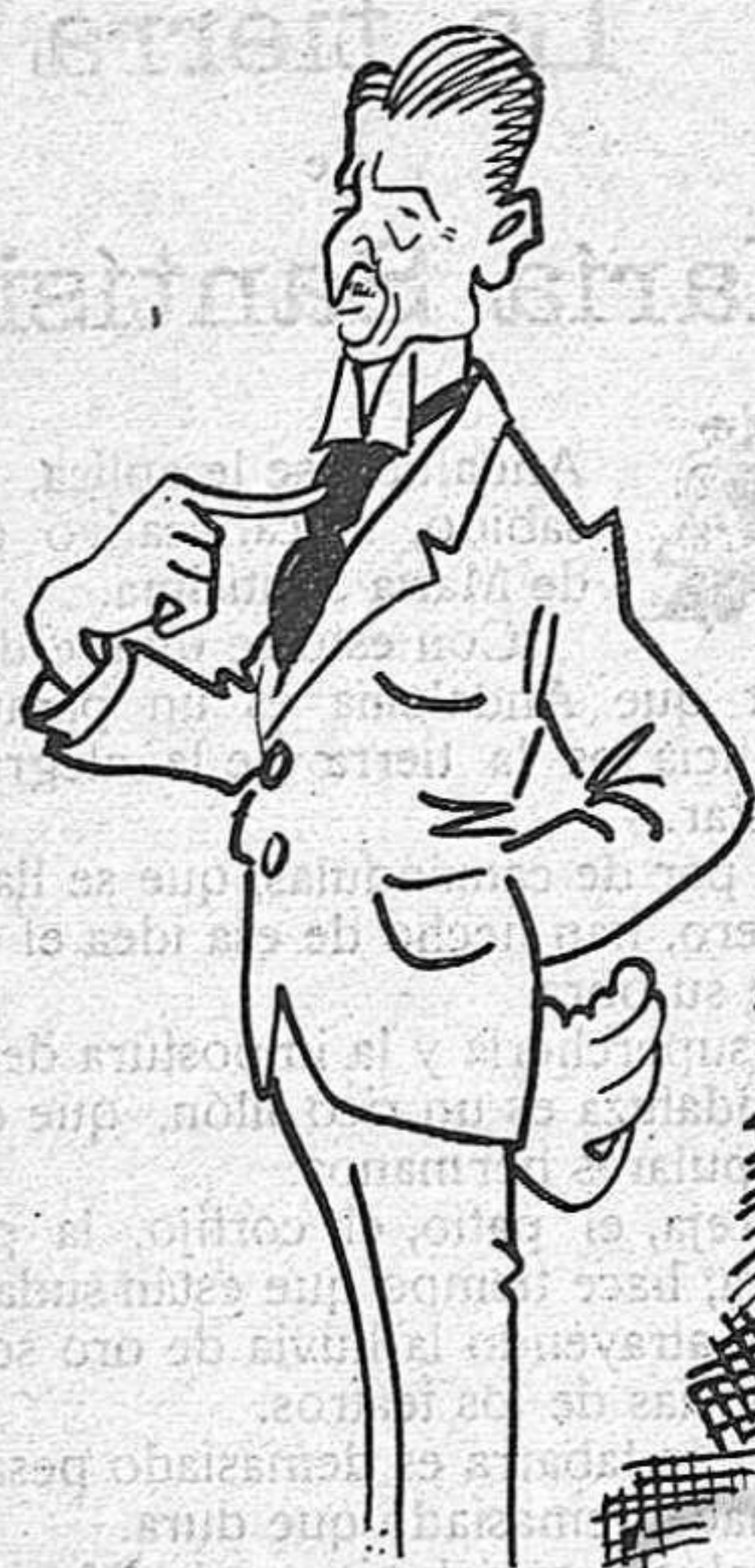
—Jo, com sempre, el mateix de ahir, el mateix d'avui, el mateix de demà.