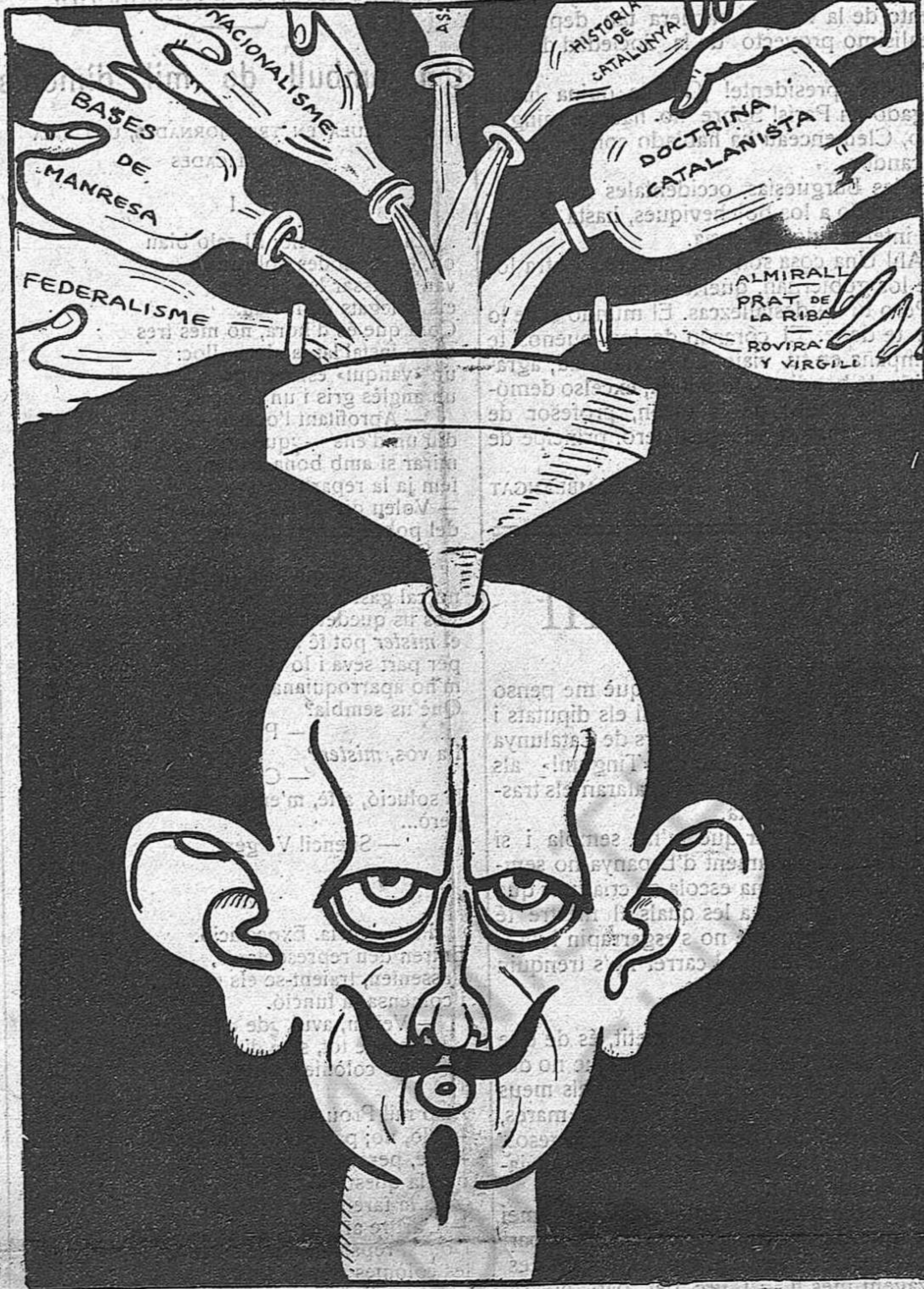
Per a acabar amb la incomprensió del problema català en terres castellanes