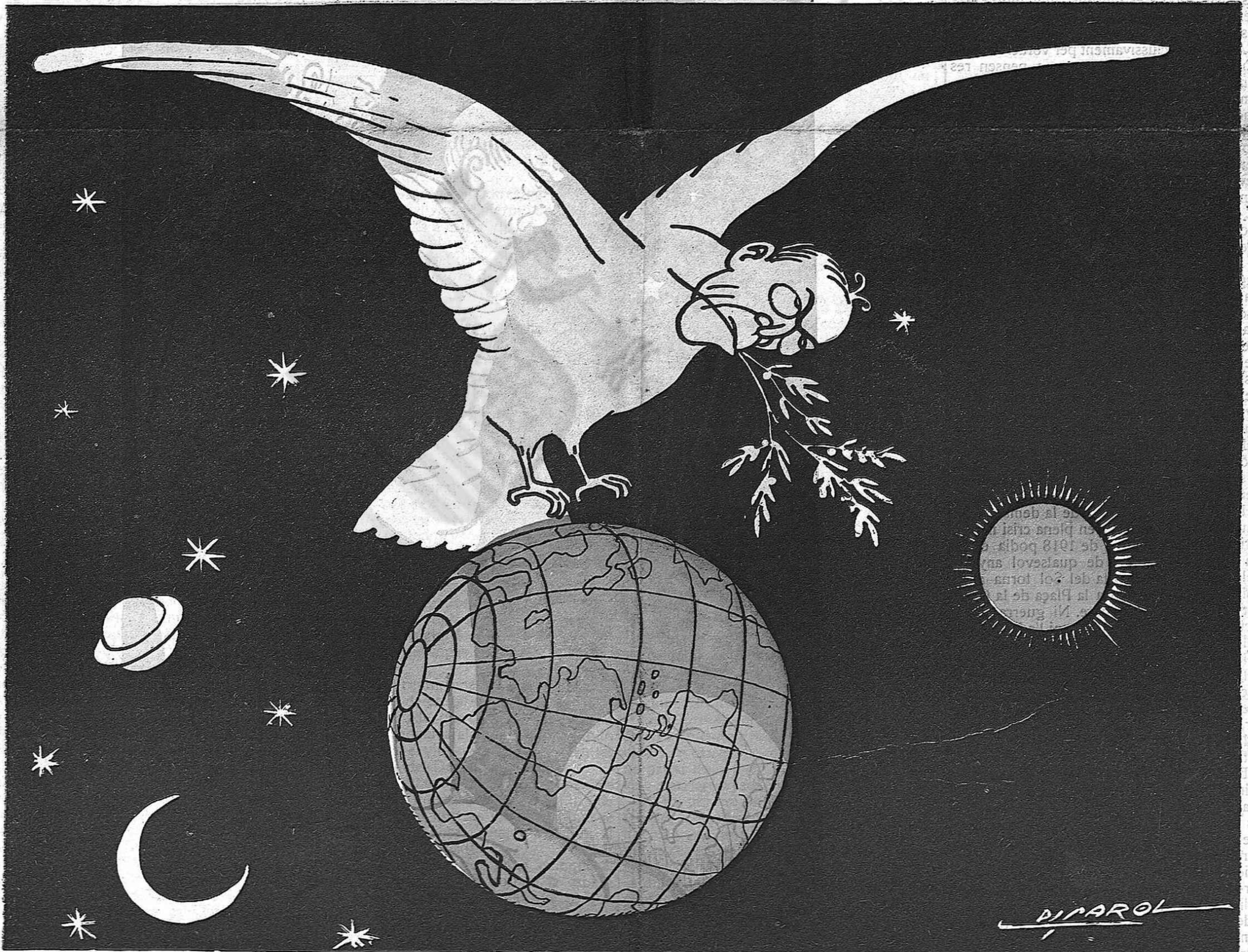
El veritable colom de la pau