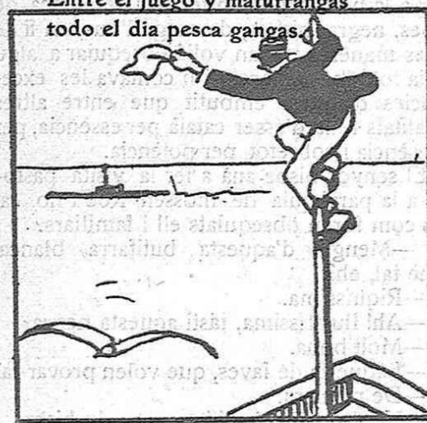
Al salir nuestros marinos avisa a los submarinos.