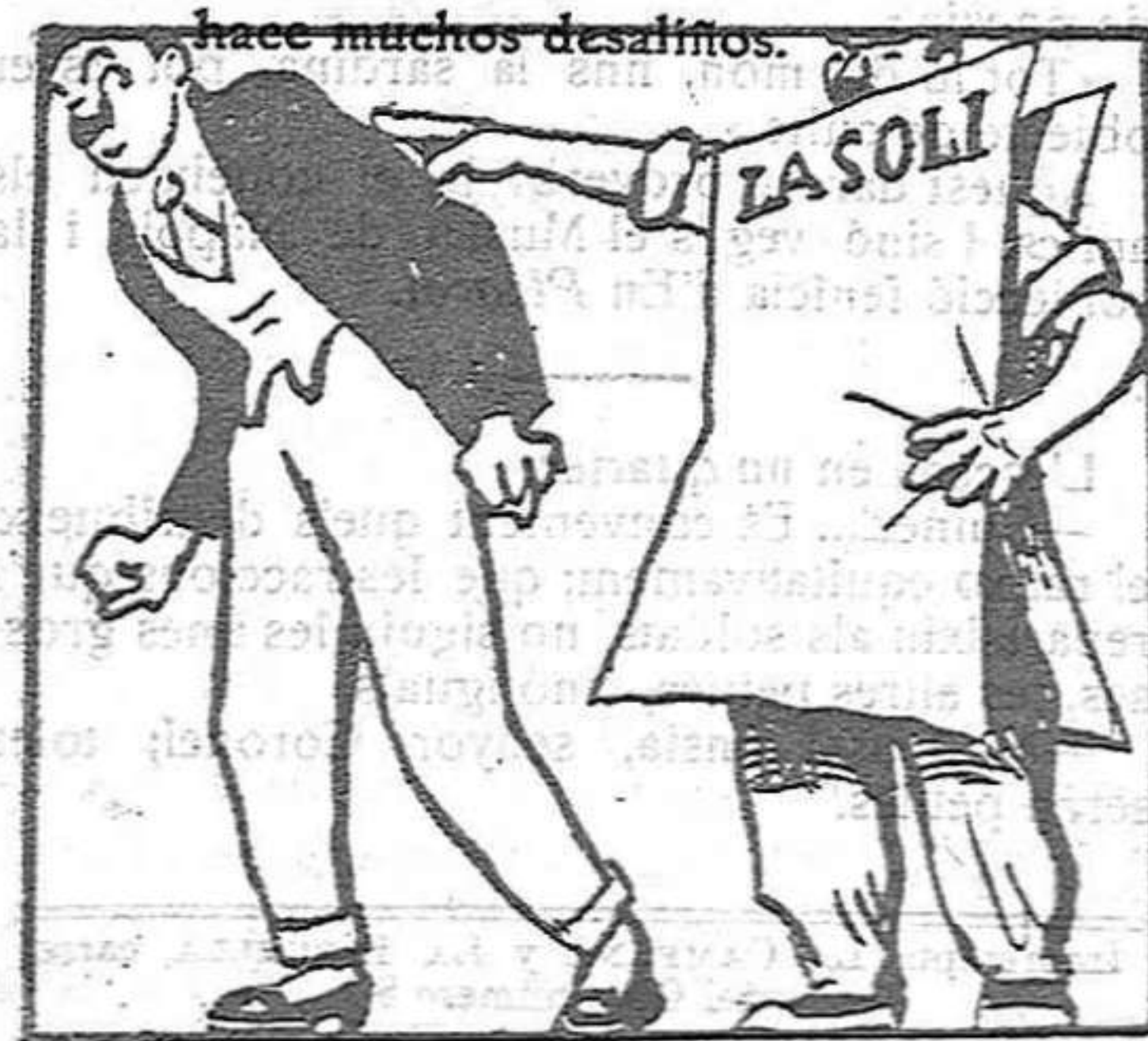
Un diario socialista le denuncia y da la pista.