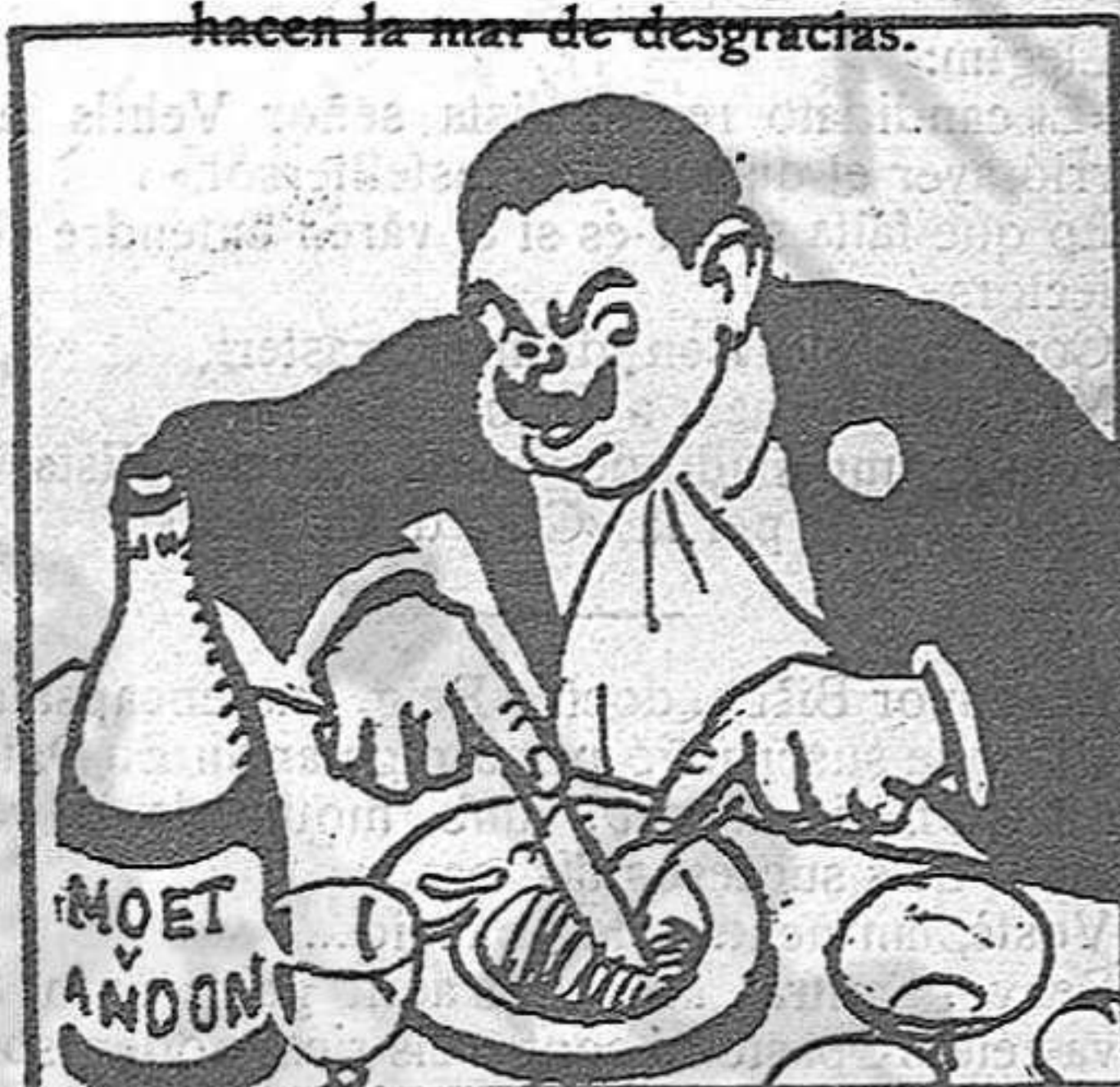
Cada noche en el Lyon cobra fama de glotón.