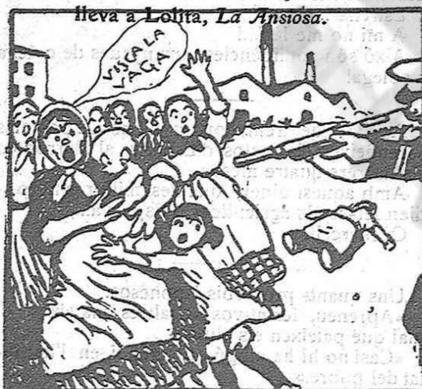
Con mujeres y con niños hace muchos desafitos.