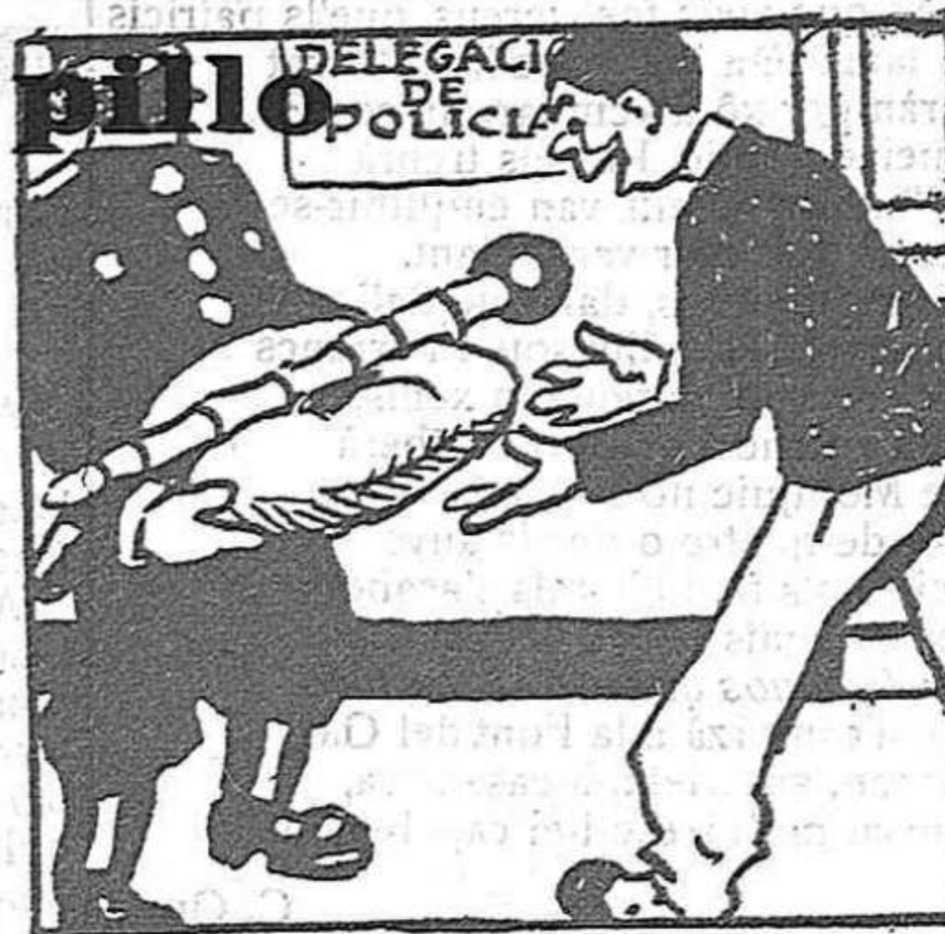
Aprendiz tan genial, pronto llegó a oficial.