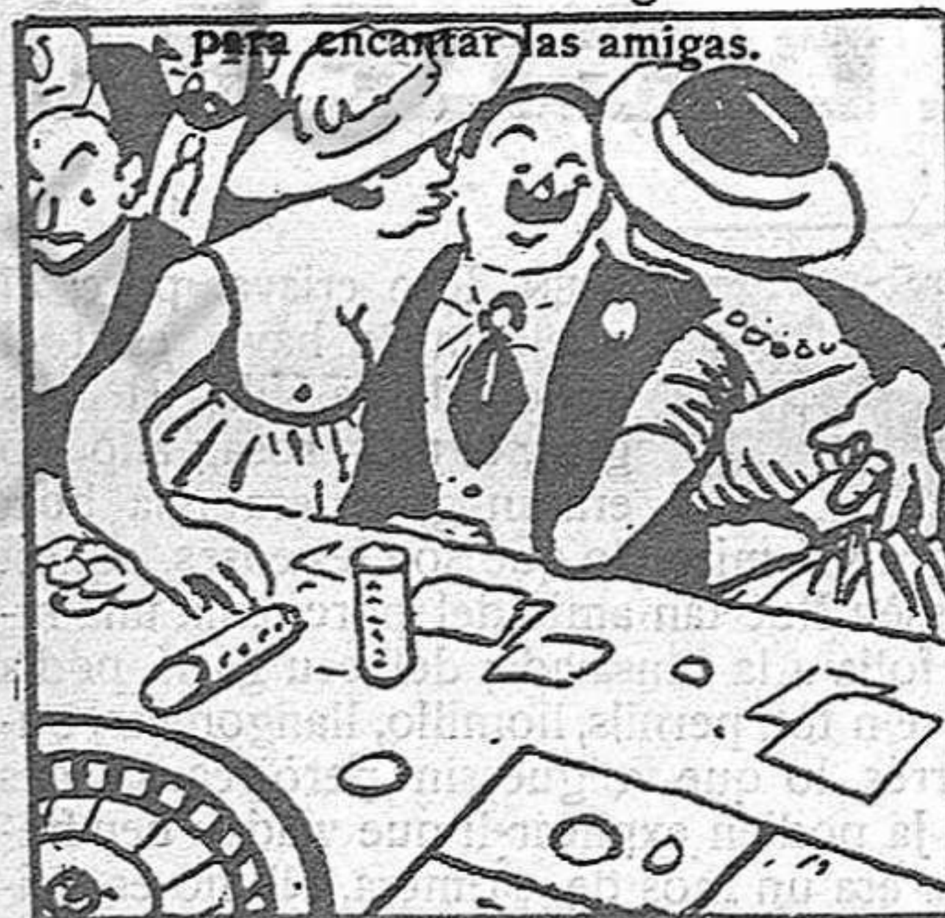
Entre el juego y maturrangas todo el día pesca gangas.