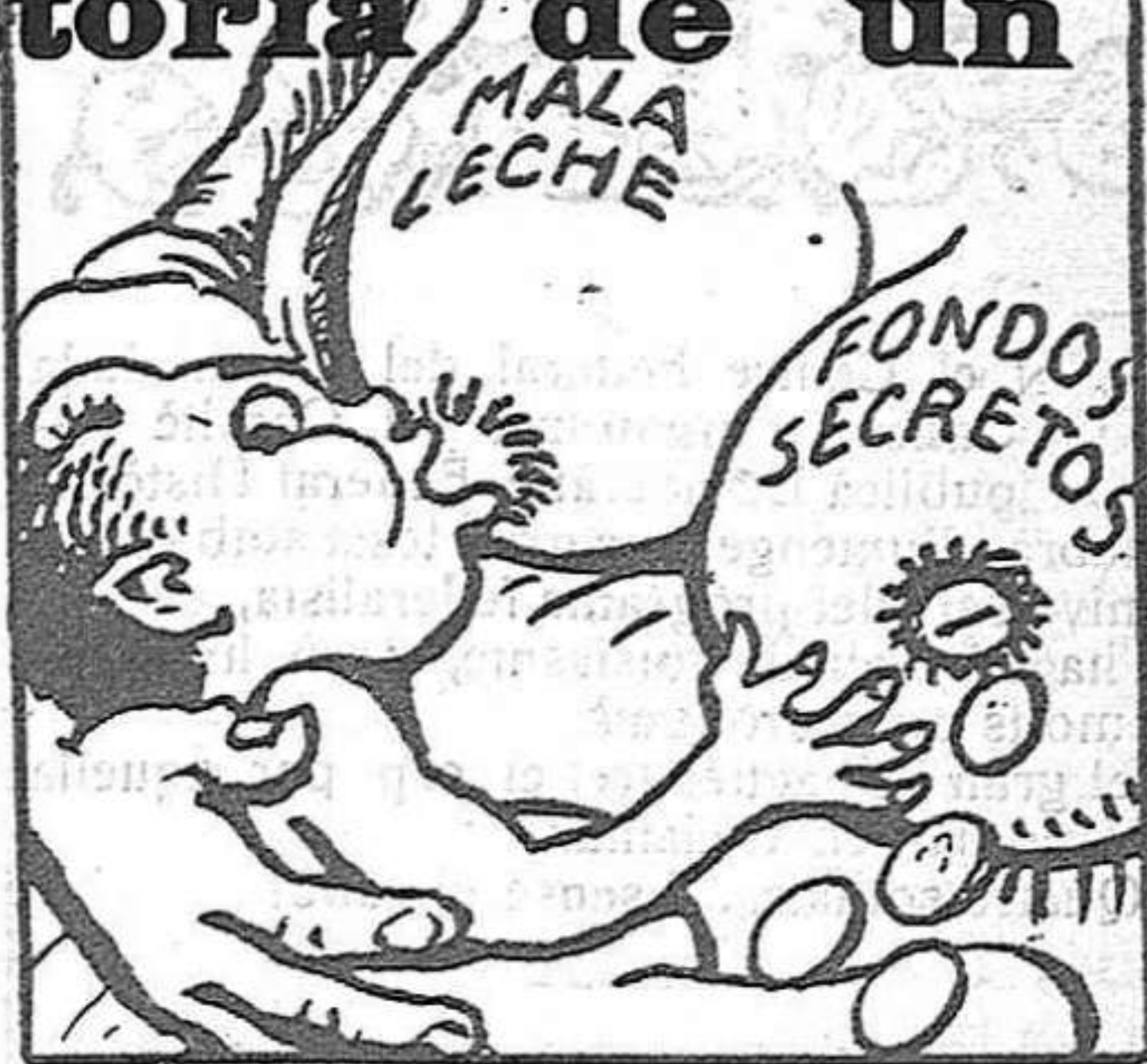
Ya cuando era monigote quería chupar del bote.