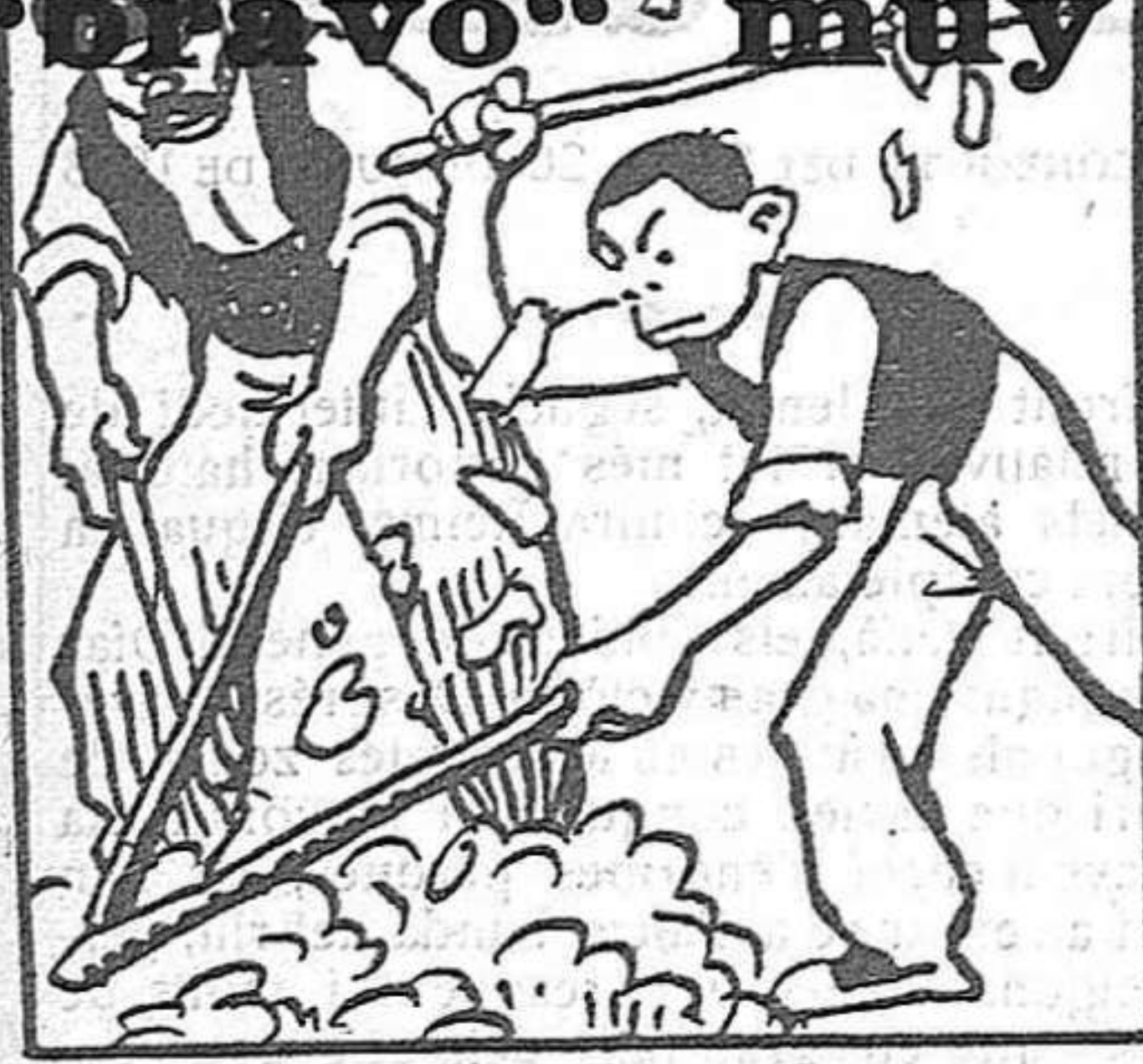
Su padre, al verle tan fiero, le pone de colchonero.