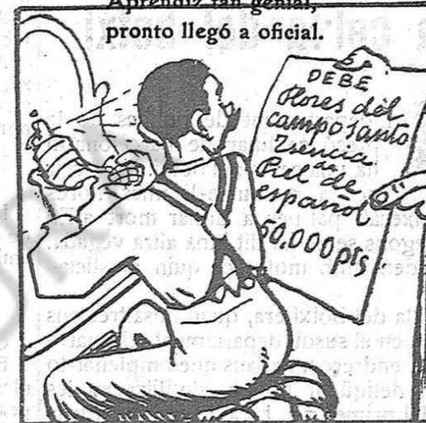
Gasta en perfumeria fina como un auto en gasolina.