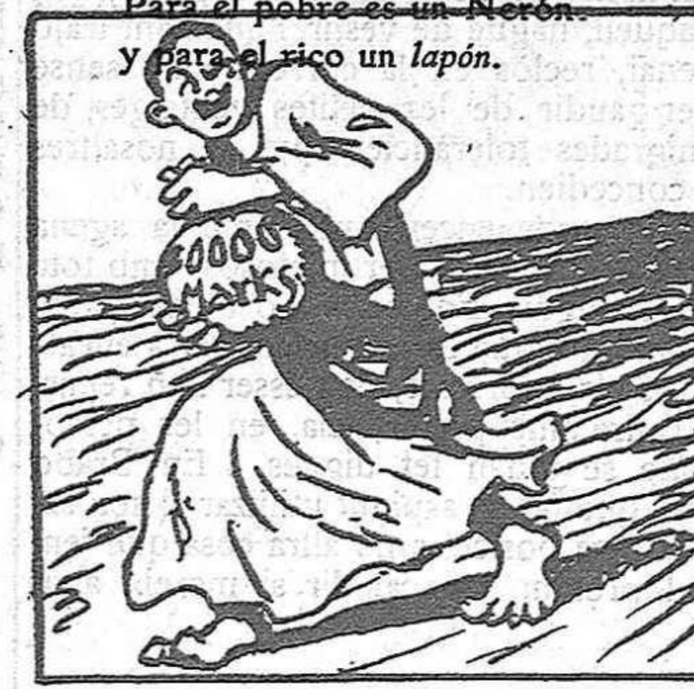
De los imperios centrales cobra miles de reales.