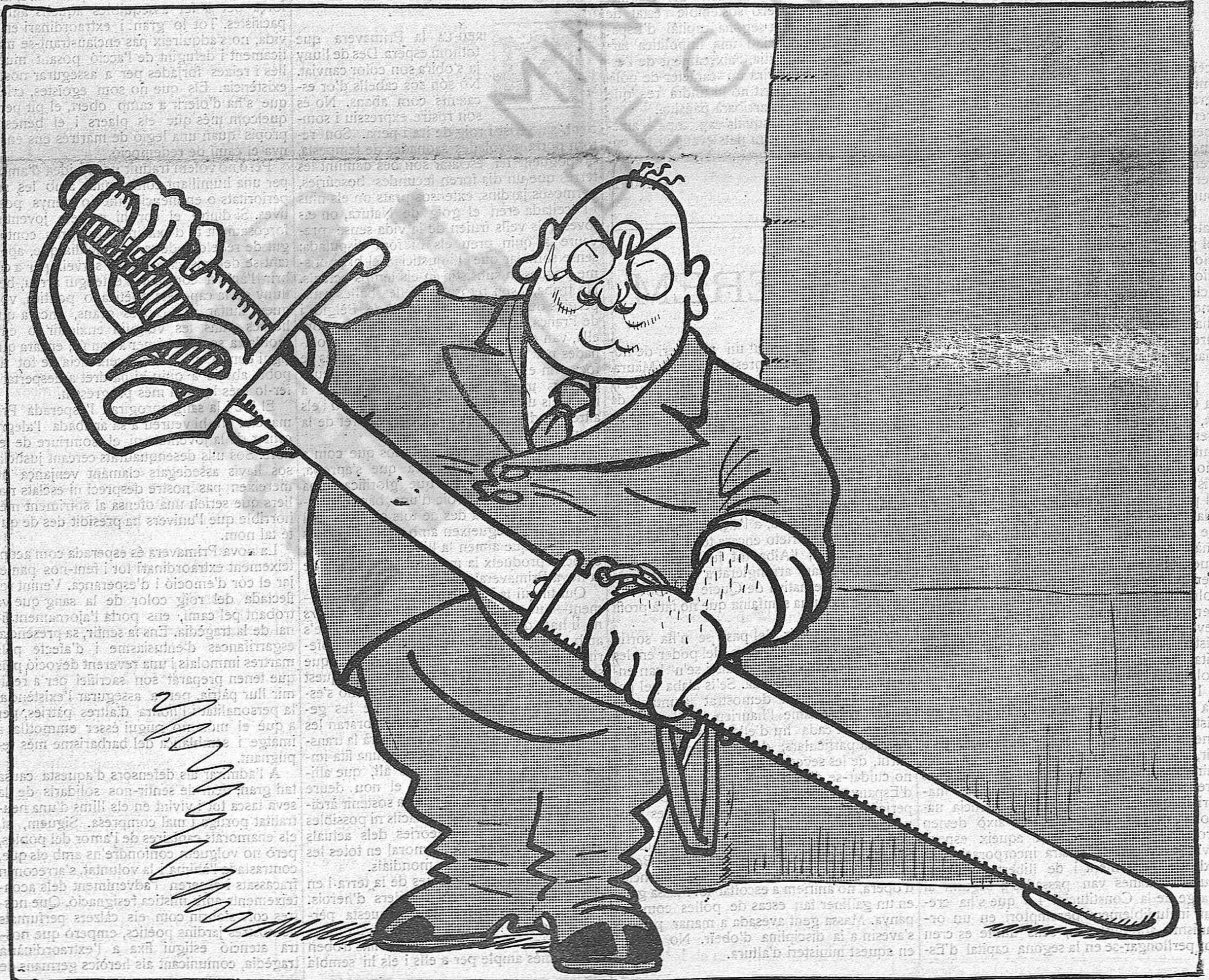
—Me l'envaino o no me l'envaino?... Sí, envainem-nos-la!