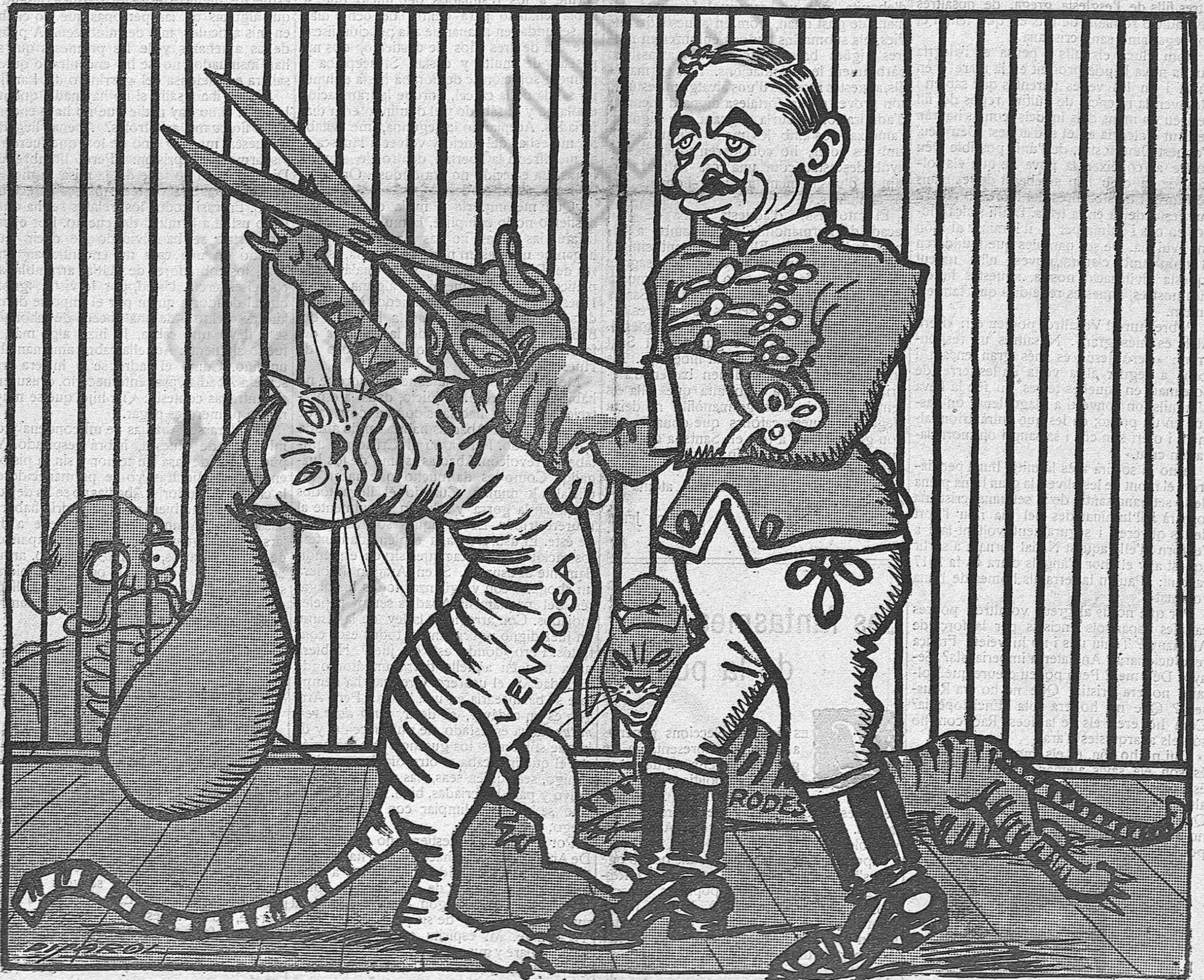
--Ha arribat el número sensacional, "señores"; guaitin amb quina facilitat se deixen tallar les urpes.