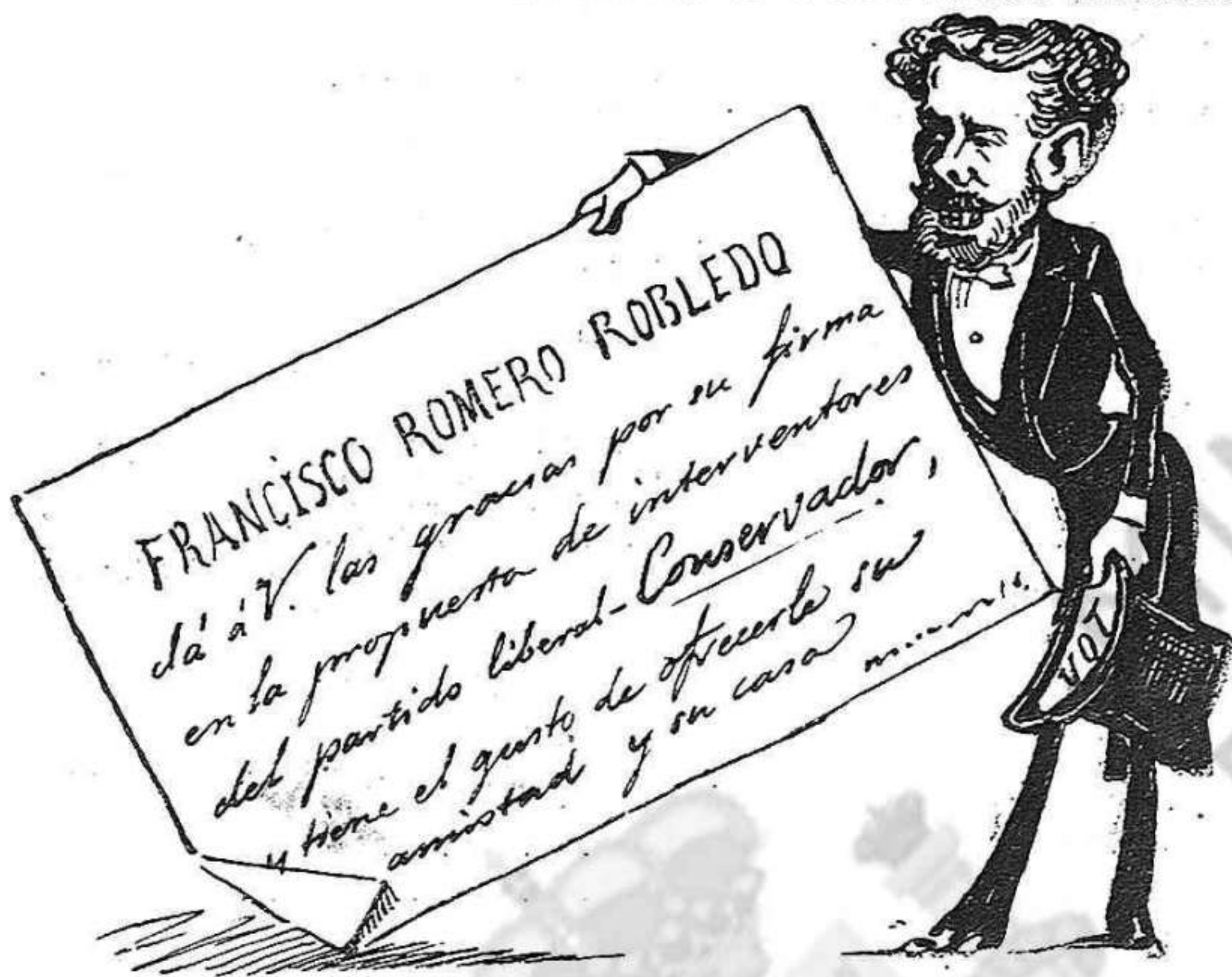
Finura y dissimulo.