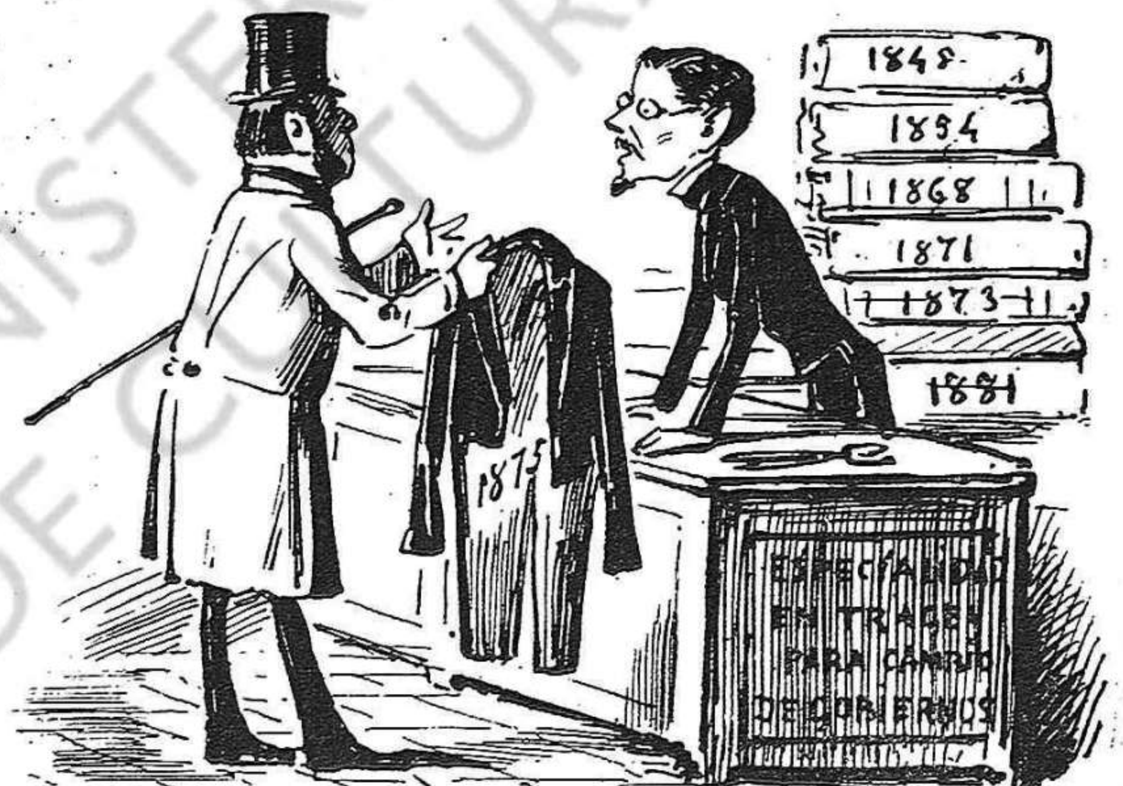
Voldria que 'm girés aquesta casaca. En temps d' eleccions, un hom' ha de anar arreglat.