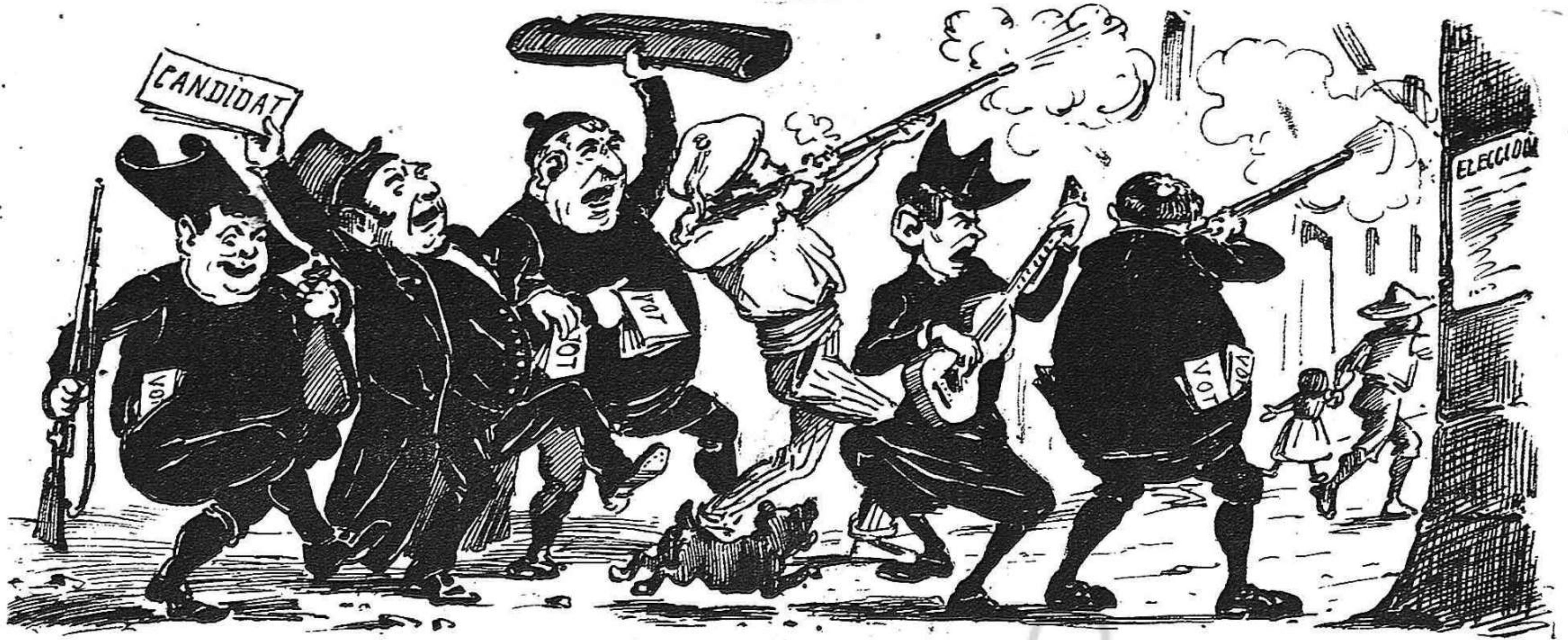
Cada hu tè 'l sèu modo de matar pussas. Los de Cañete ho fan aixís.