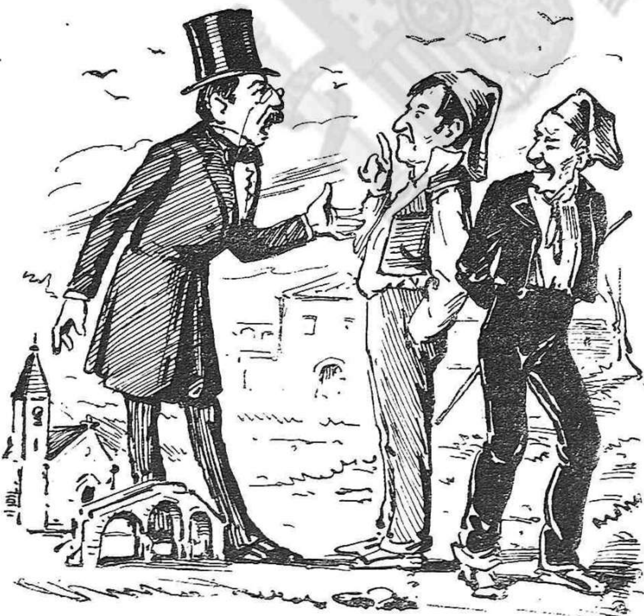
D. José cada vegada molts promesas y en 'sent á Madrid si t' hay vistu no 'm recuerdo.