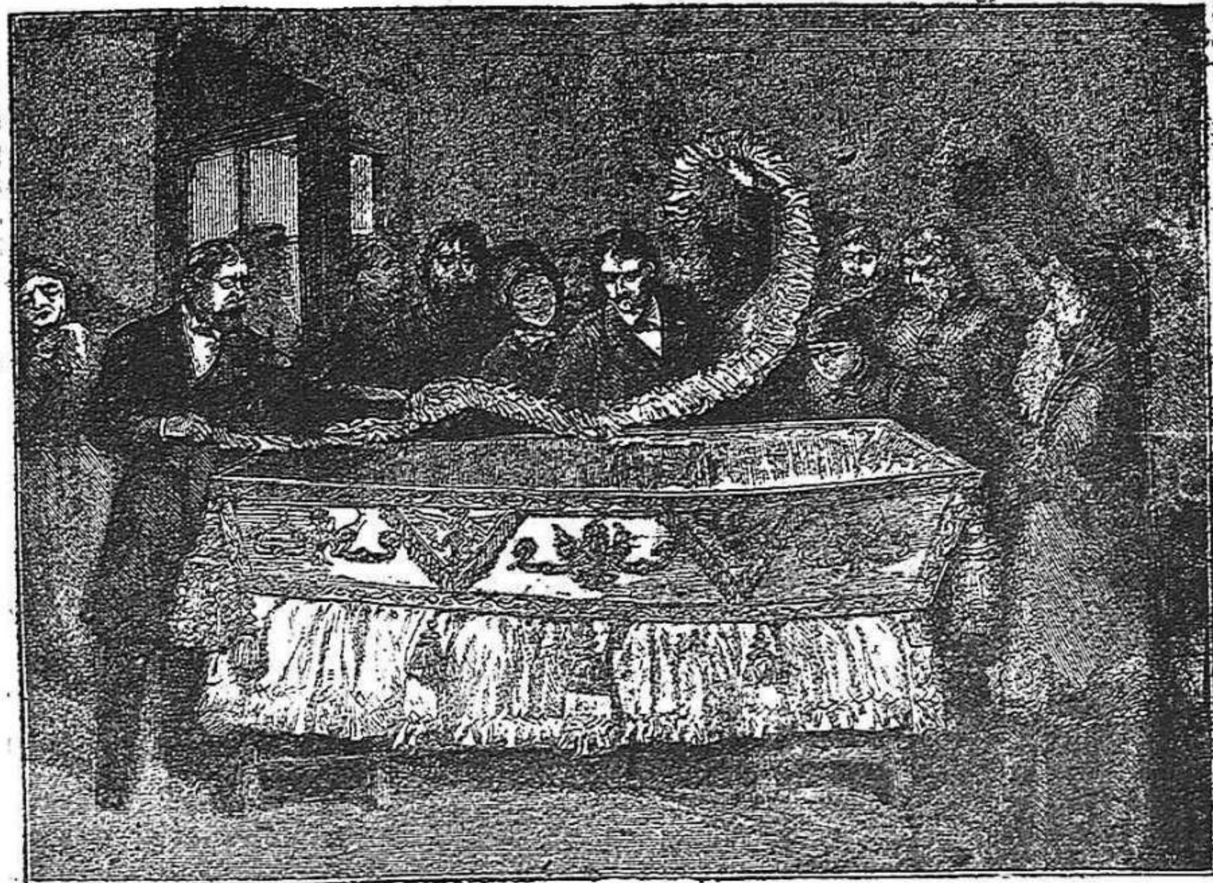
Adorno del fèretro del Emperador.

(Extret de la notable ilustració inglesa The Graphic.)