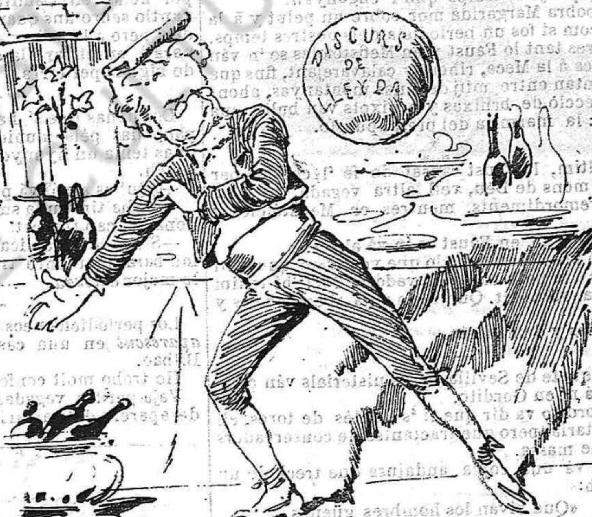
Y en Balaguer que no es manco tira la pilota al blanco.