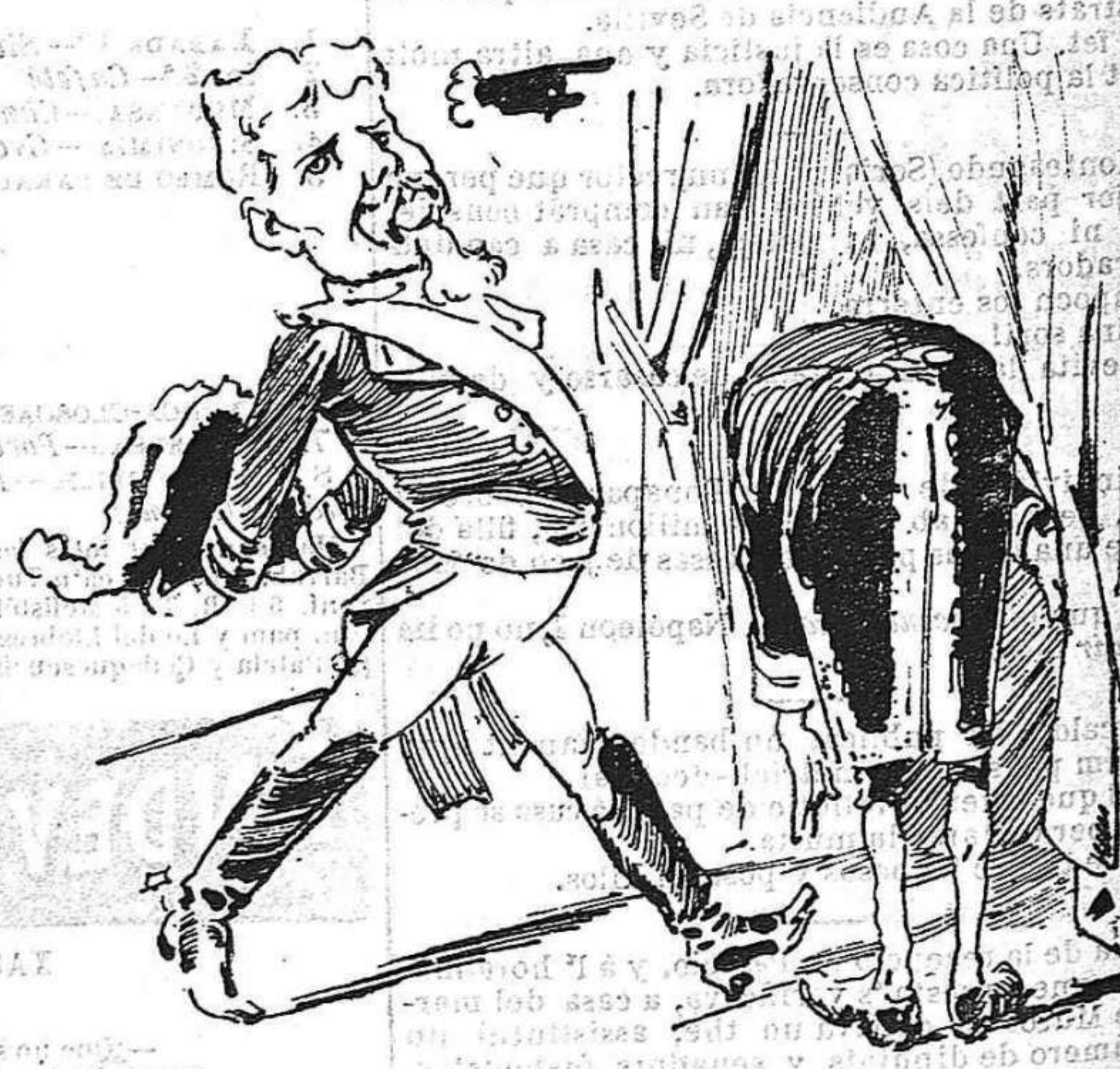
Los dinars de aquest senyó no 'ls pahirá la fusió.