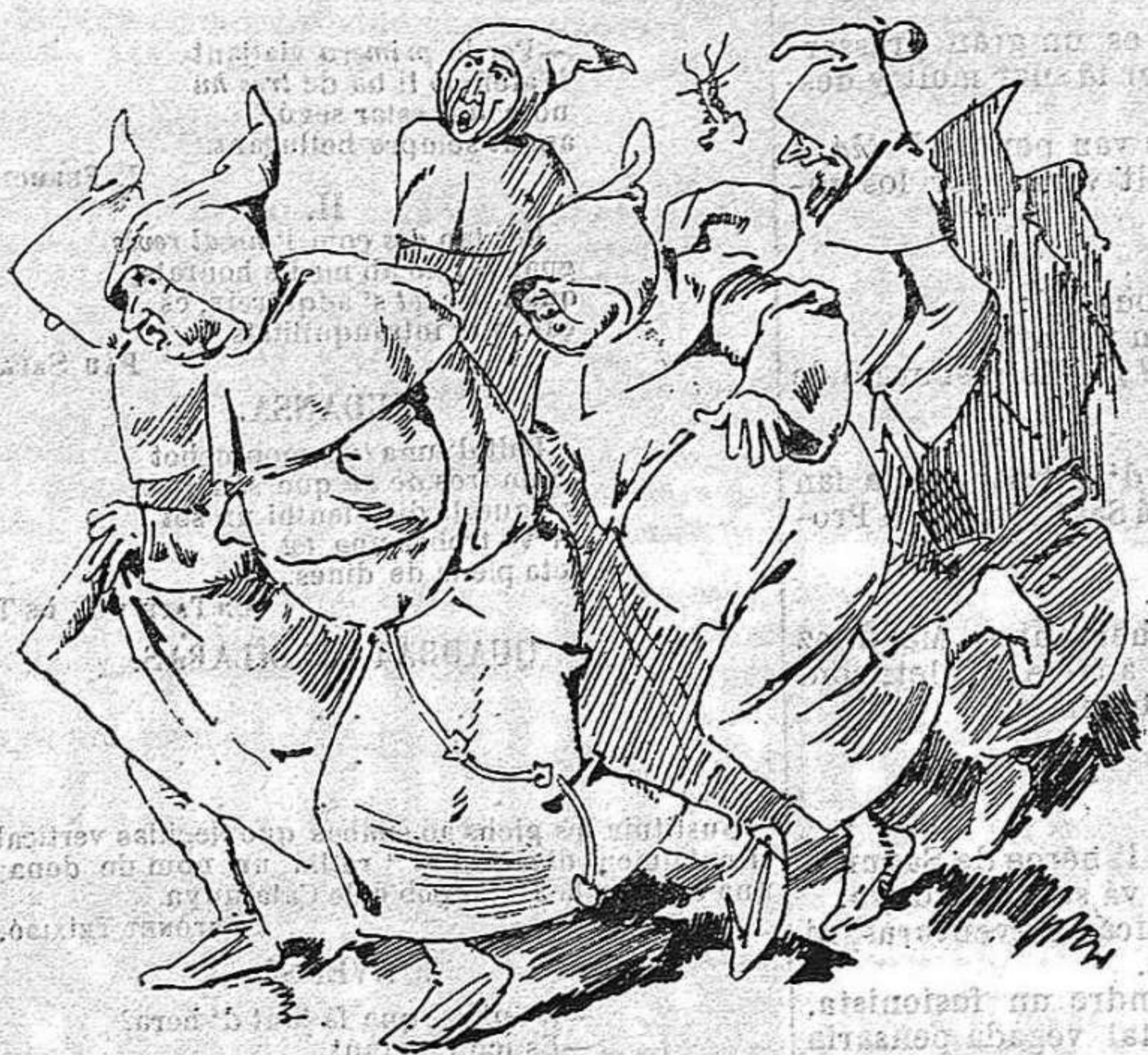
D' aixó 'n diuhen simpatia? Quina terra! Ave Maria!