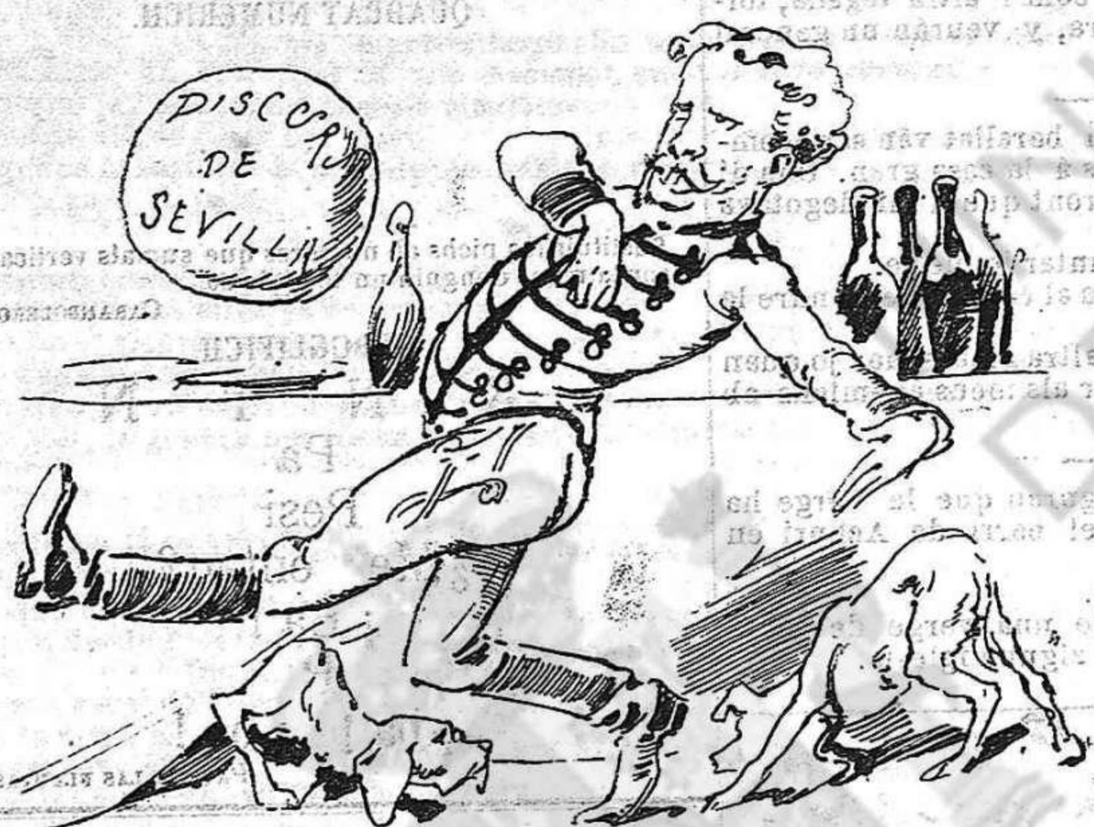
Un húsar que fent xacota vá tirarnos la pilota.