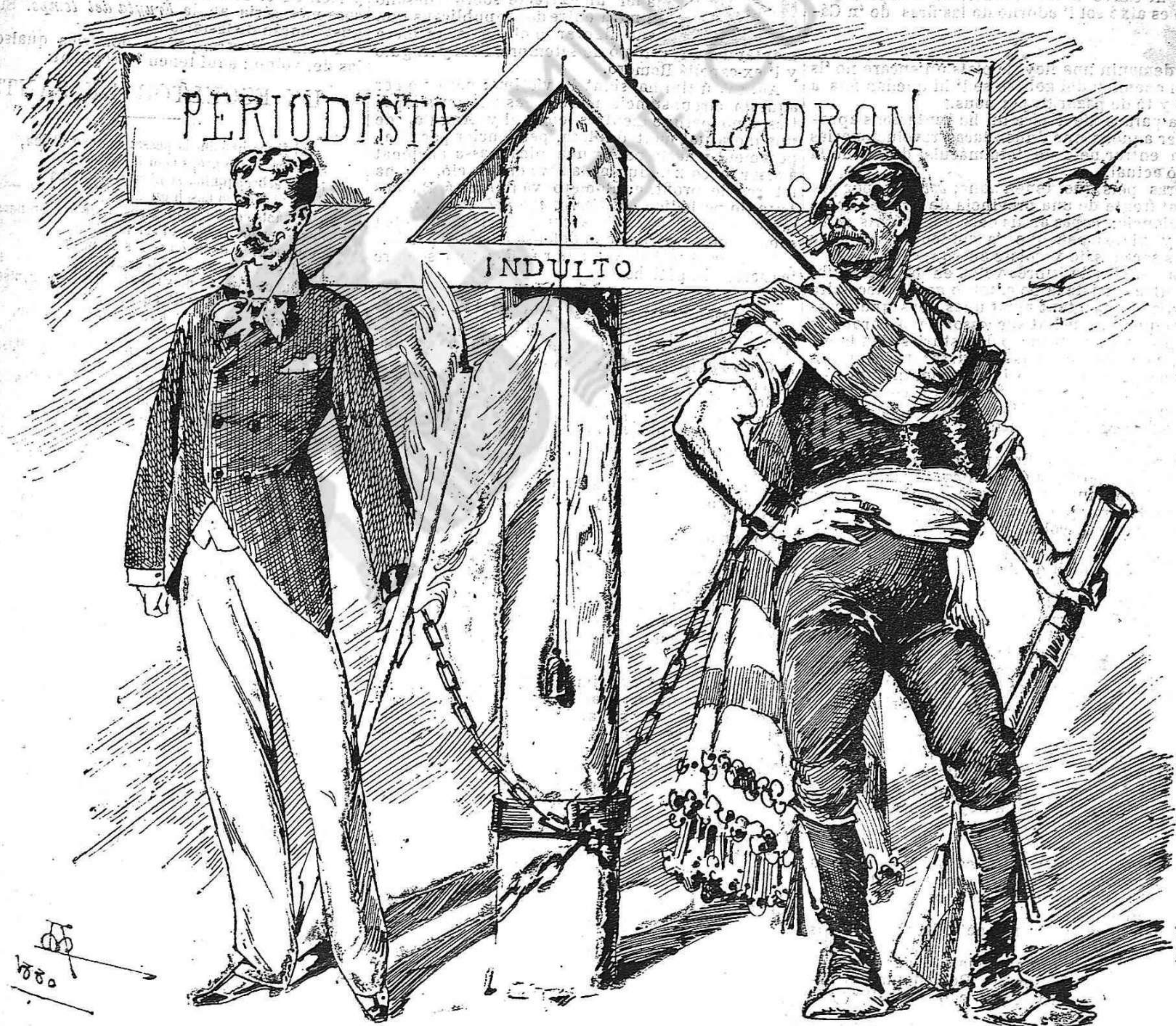
Gracias per l' obsequi. Si aixó no es igualtat, ni may.