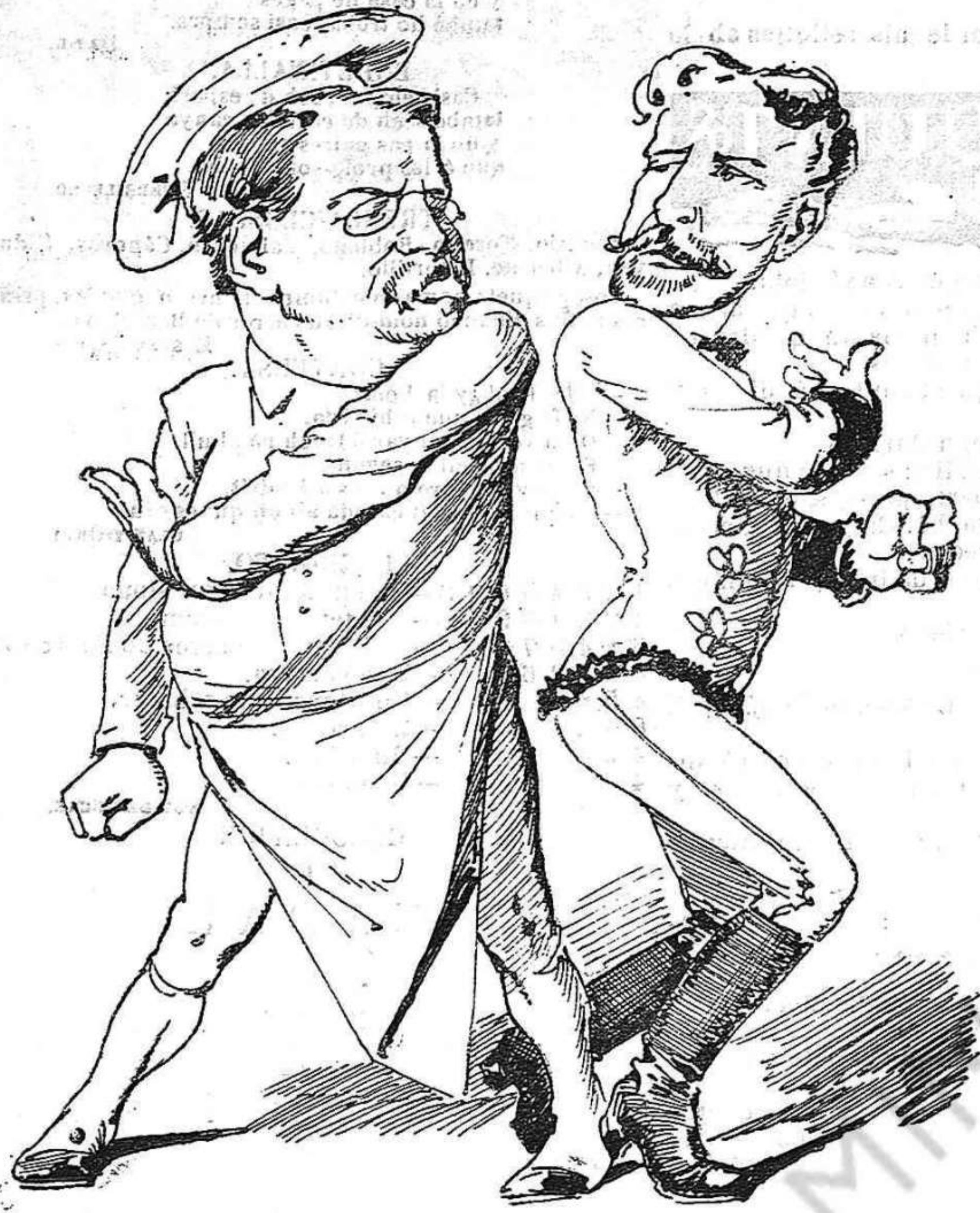
Lo primer partit.—(Del present.)