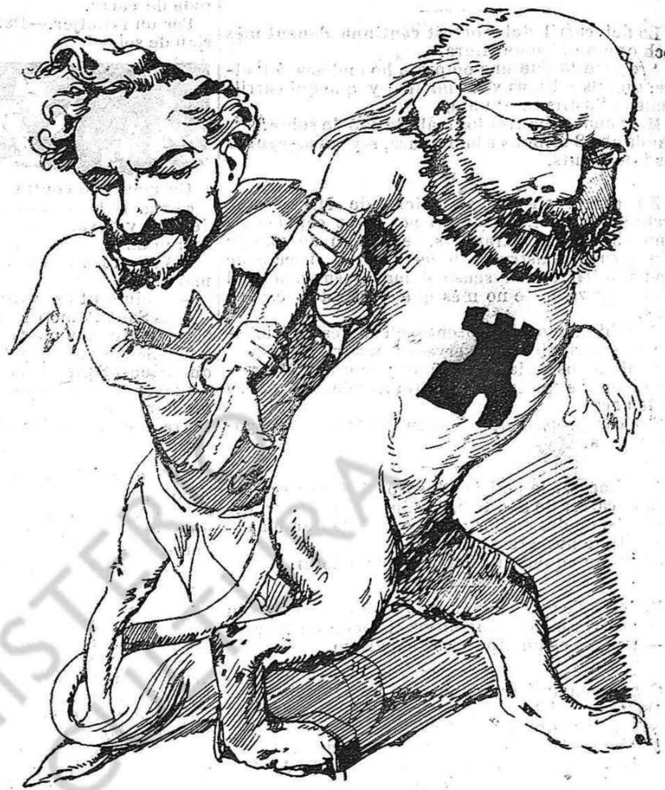
Lo segon partit.—(Del porvenir.)