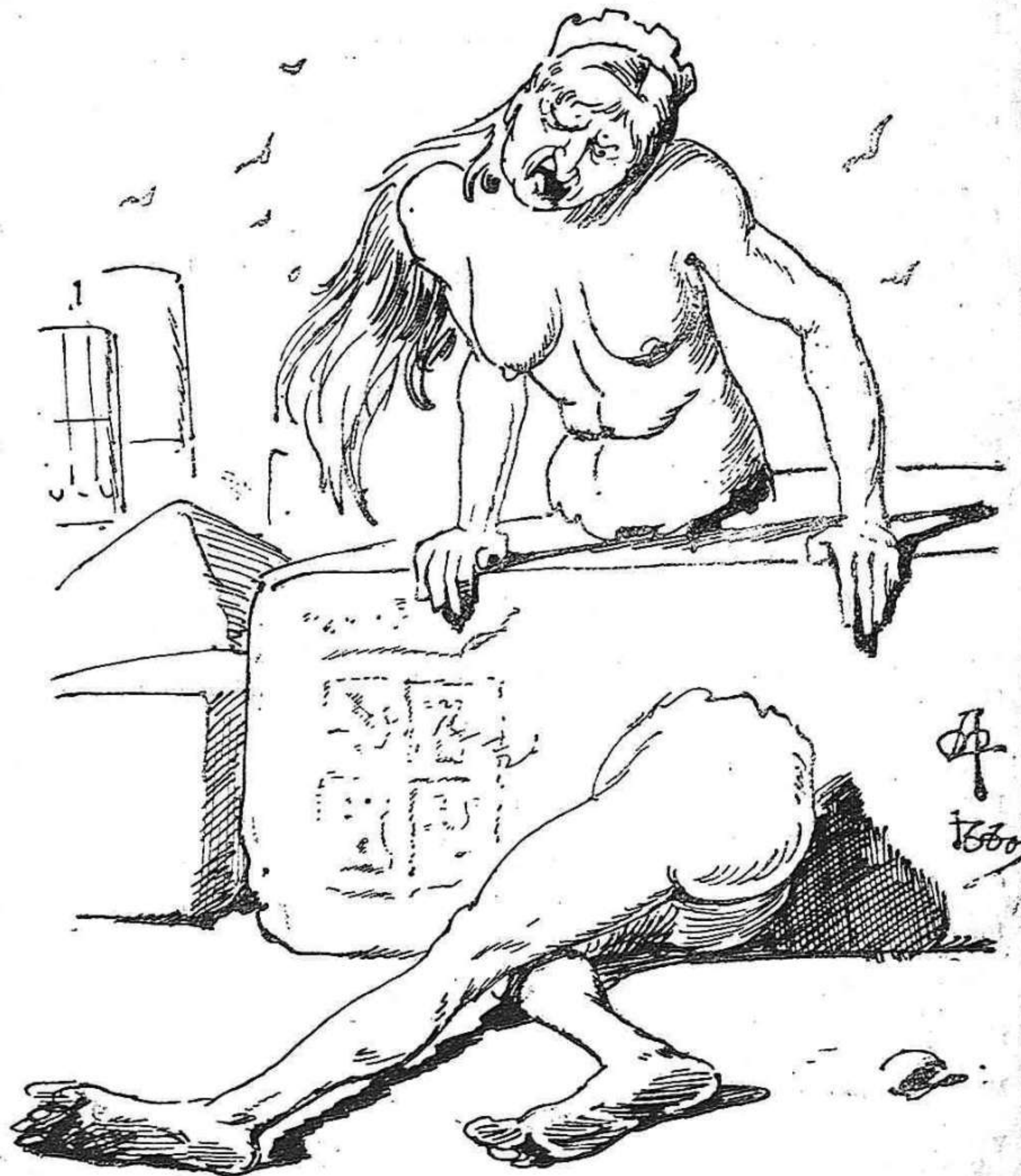
Pero 'l partit mes partit de tots es lo pais.