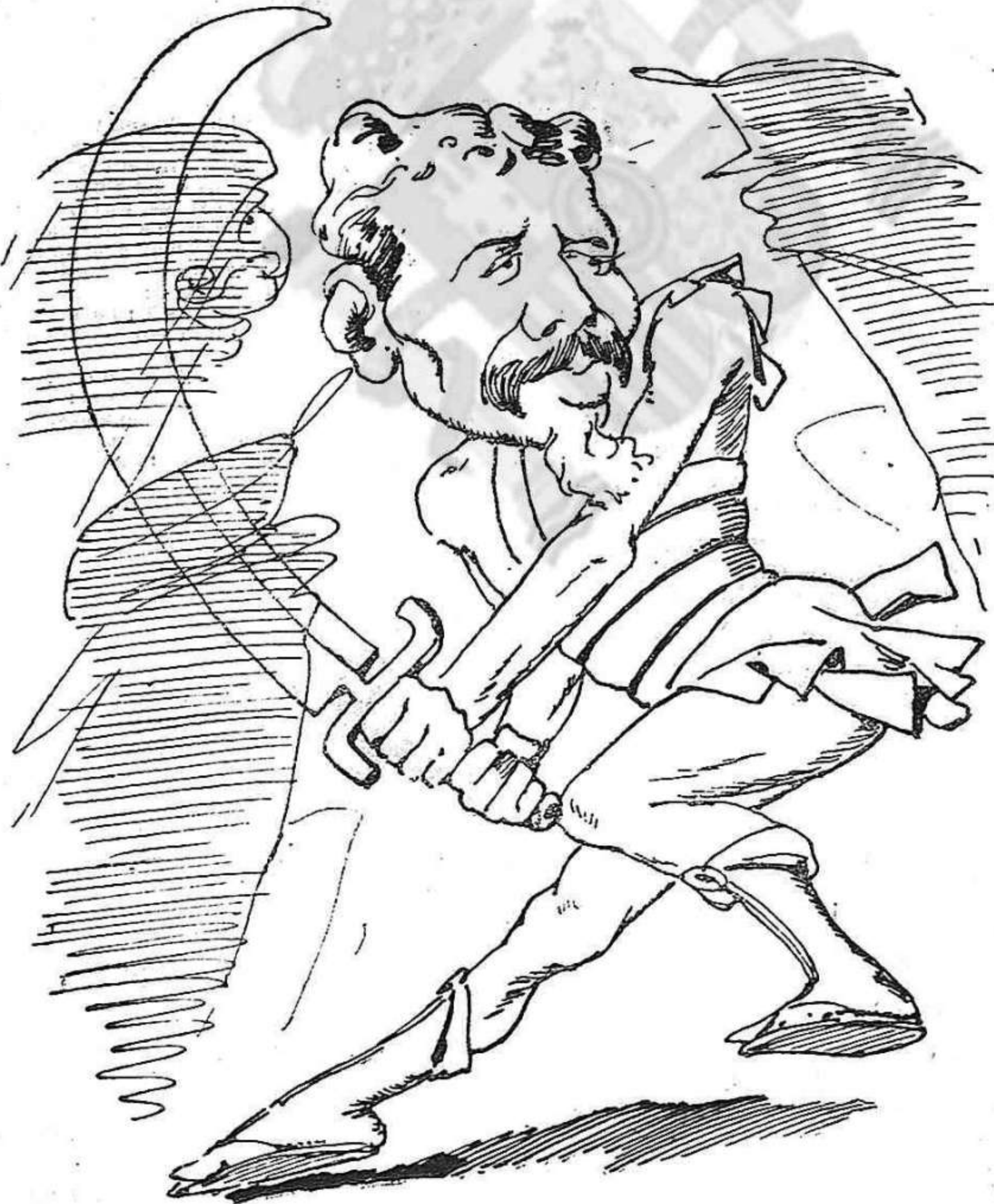
Lo tercer partit.—(De may.)