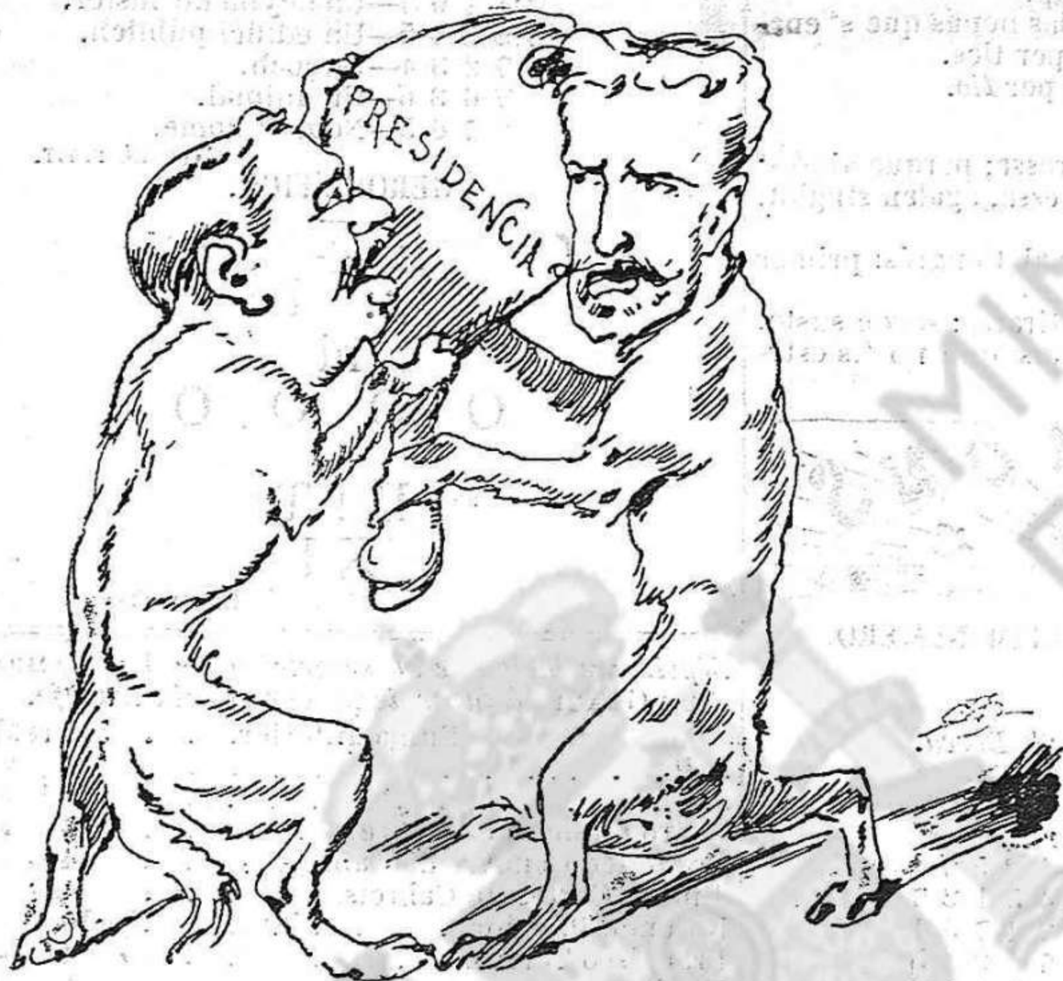
Llops ab llops també 's mossegan.