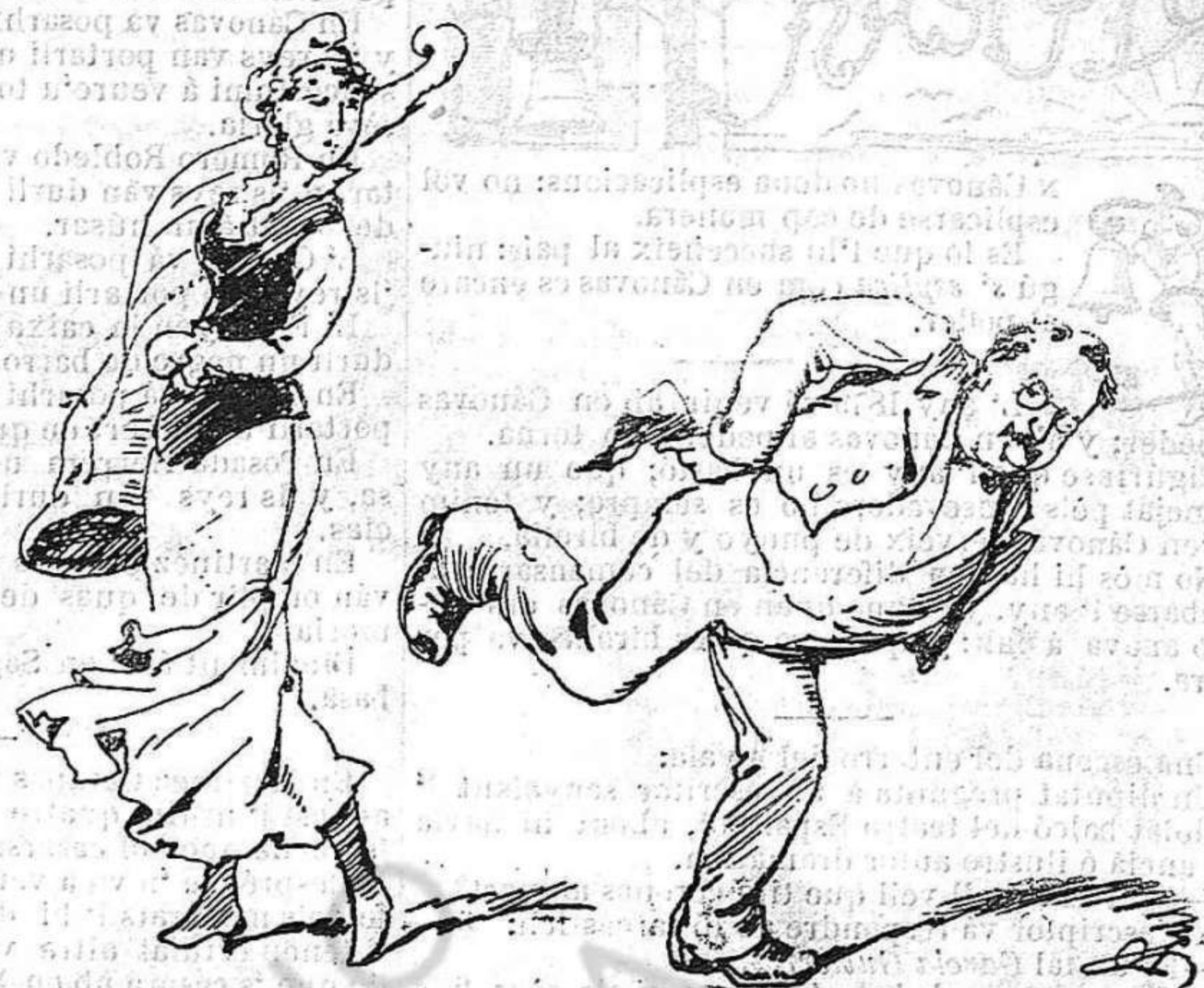
y 'us ho pagarán á còssas.