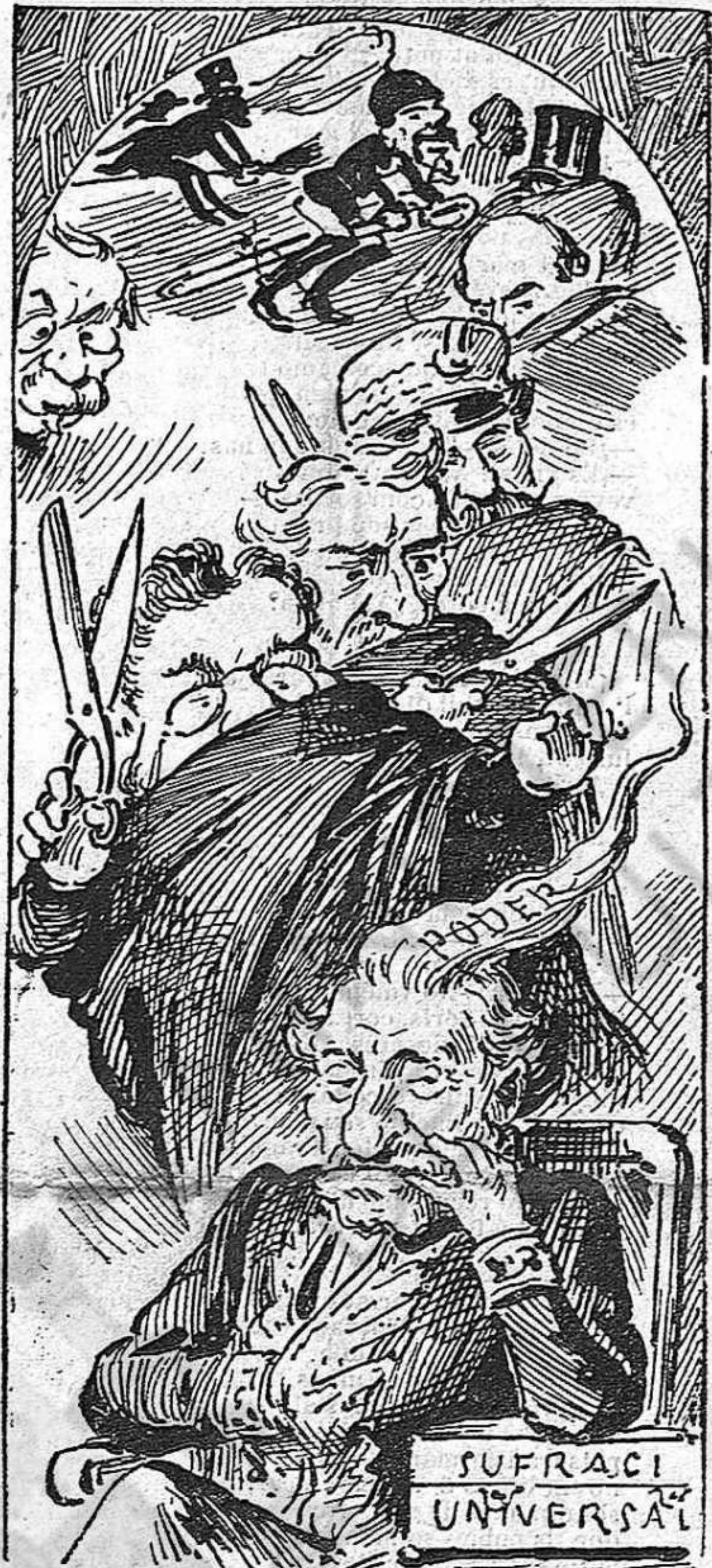
La cosa està embolicada: que succehirá no ho sé: ja fa temps que tots conspiran per tallarli lo tupé.