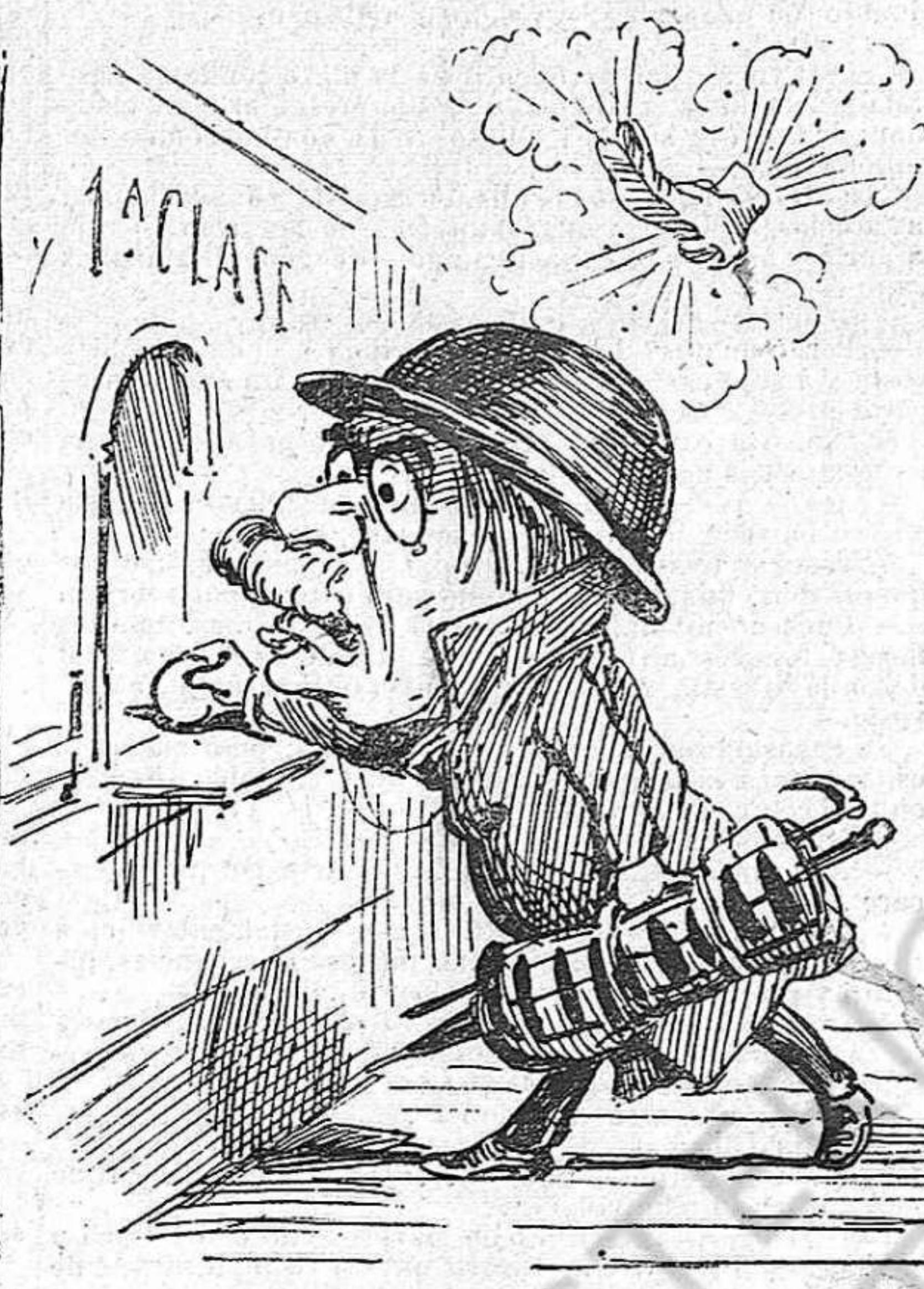
—Corri, una primera per Zaragoza, que al menys allí no tiran petardos.