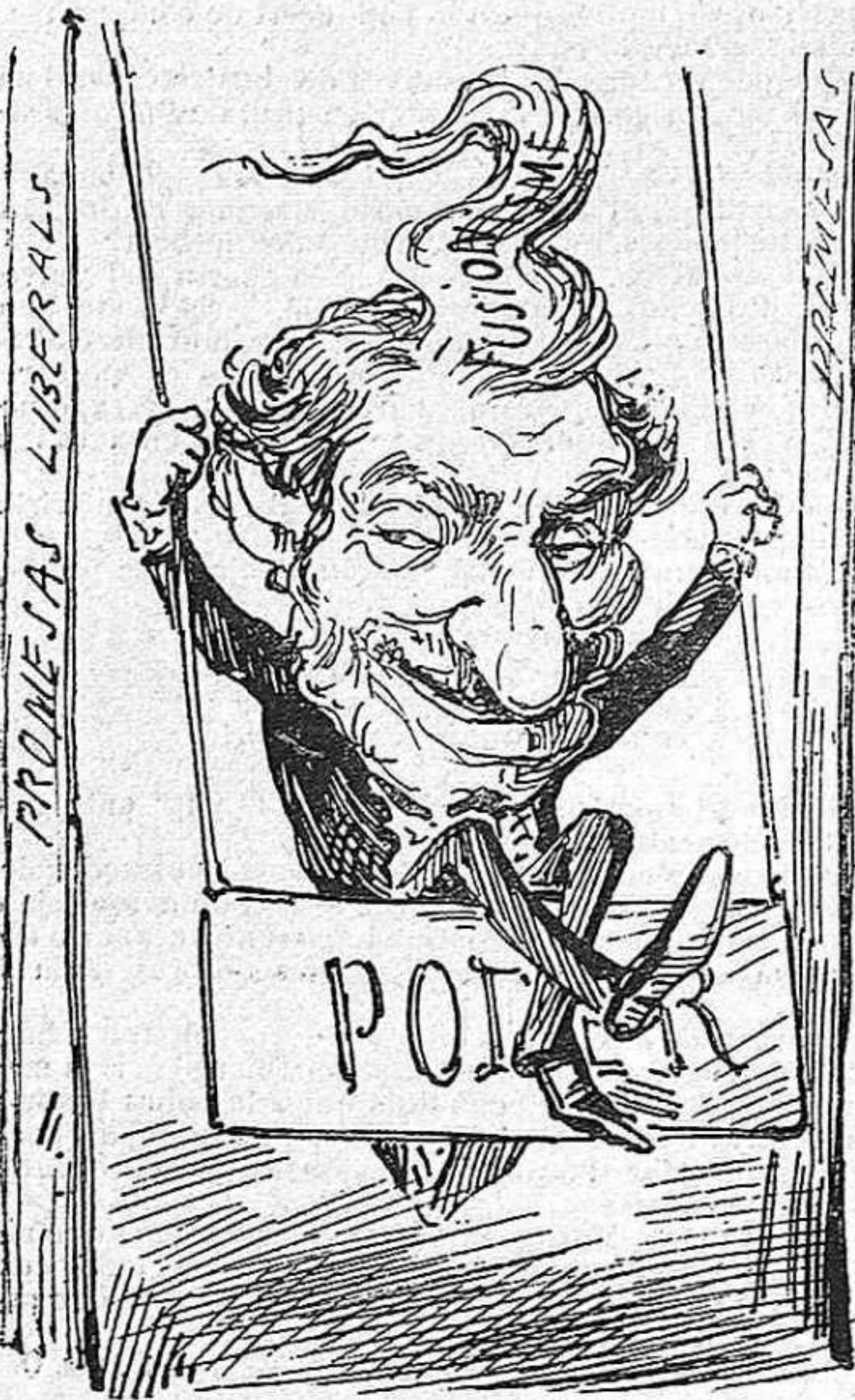
Any nou, vida vella.