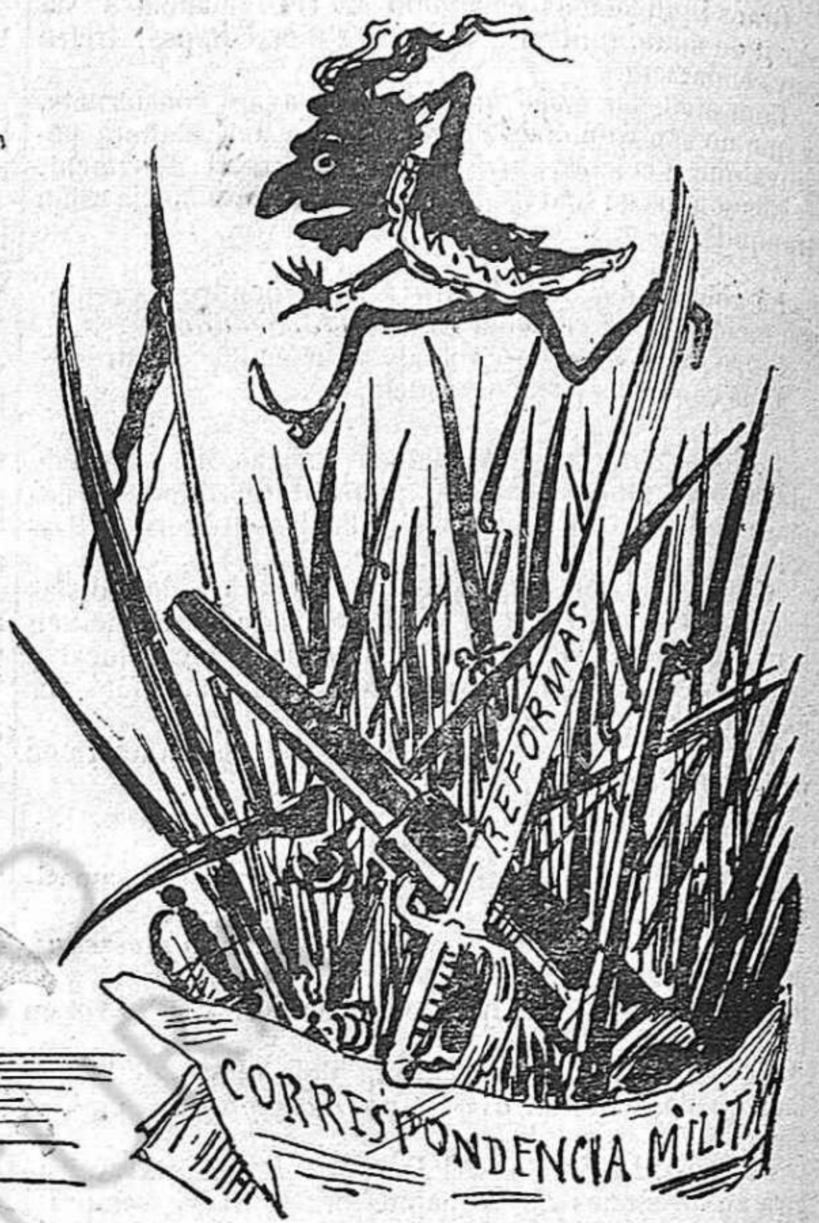
Una qüestió molt negra y punxada.