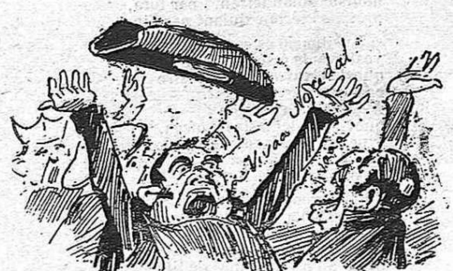
Lo delegat del governador no duya forsa, y 's vá veure

—¡Xit... ¡Silenci!... ¡Ordre!... ¡Ordre! ¡Silenci!... ¡Un rave fregit!... Aquí surt un valent, que ab tota la forsa dels seus pulmons y aixecantse de puntetas, llansa un crit estentóreo de «¡Viva Nocedal!»