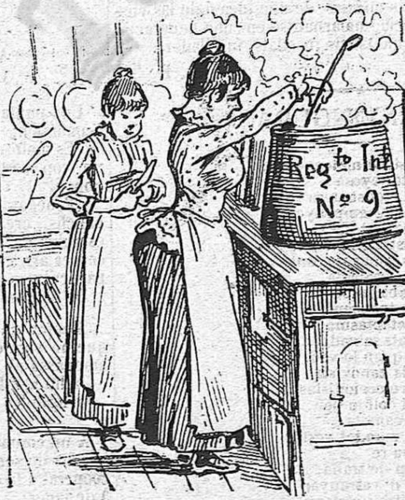
Y molts ranxos á la cuyna.