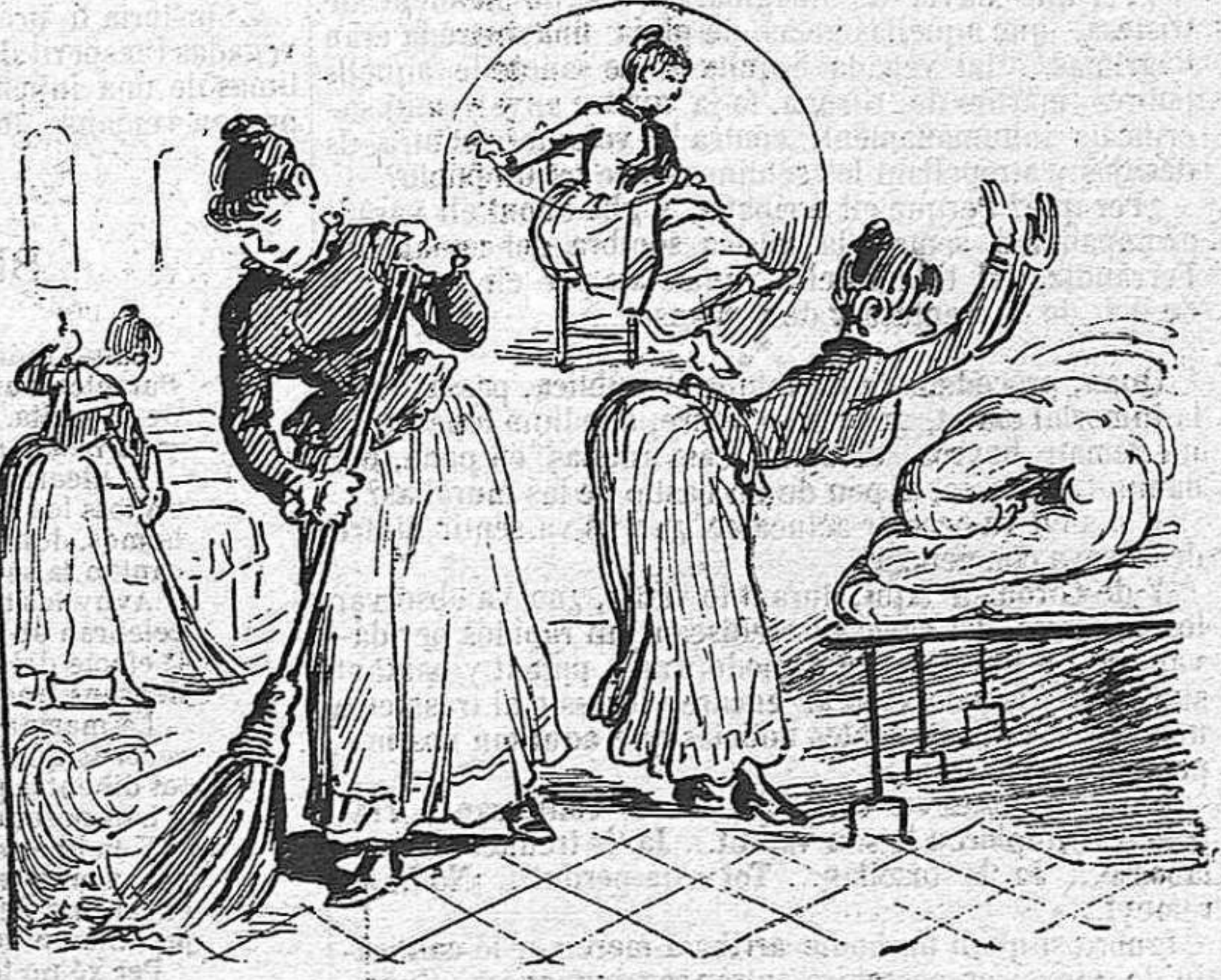
Y fora totes las mecánicas propias de donas, que 'l ferlas lo soldat n' fá guerrero.