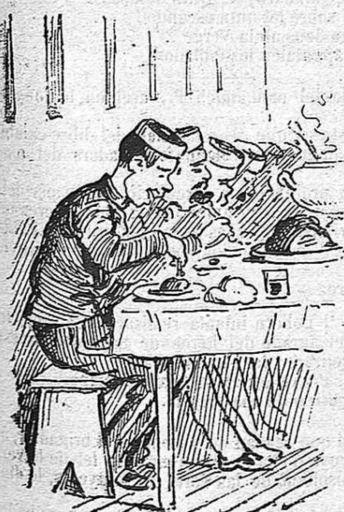
Res de ranxo á la taula.