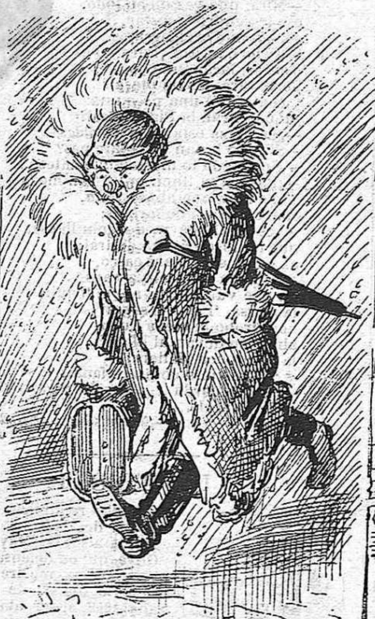
Ha arribat de llunyas terras per veure la Exposició, distribuir pulmonias y repartir panallons.