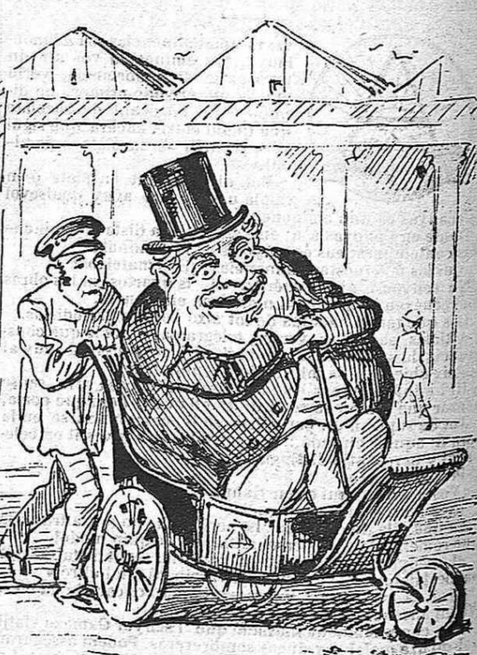
No son més los regidors que 'ls demés particulars: ja que 'ls cotxes no 's permeten que 's lloquin carrets de mà.