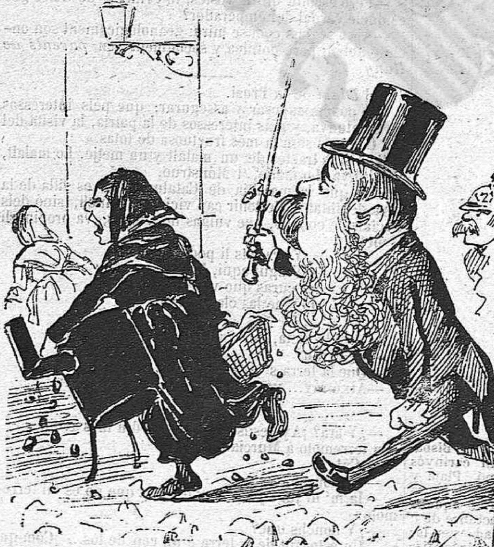
Fa bè de perseguirlas ab tanta sanya, no fòs cas que li dongan la gran castanya.