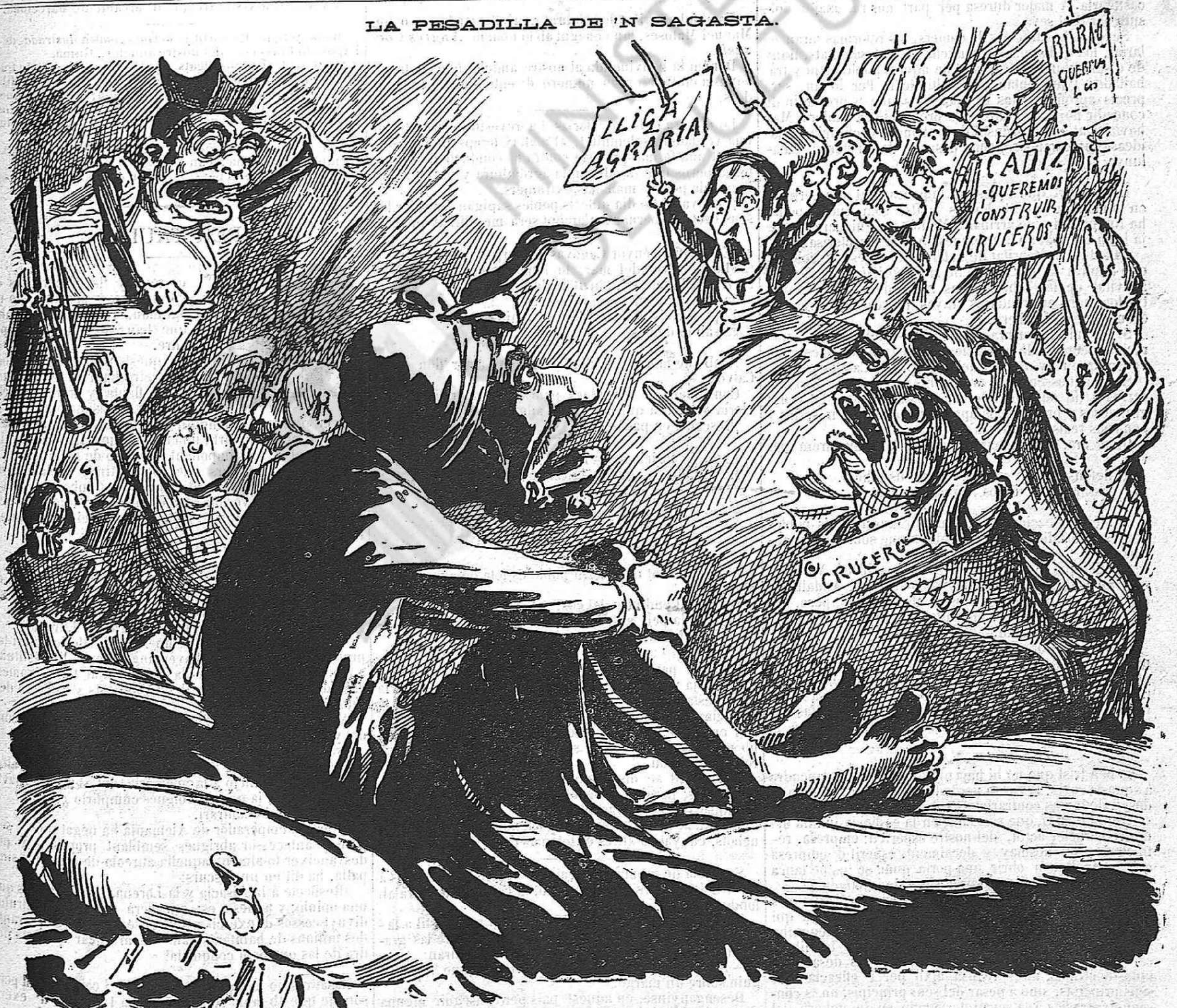
Lo clero vasco fa prédicas en defensa dels carlins; la gent de la Lliga agraria ompla la Espanya de crits;