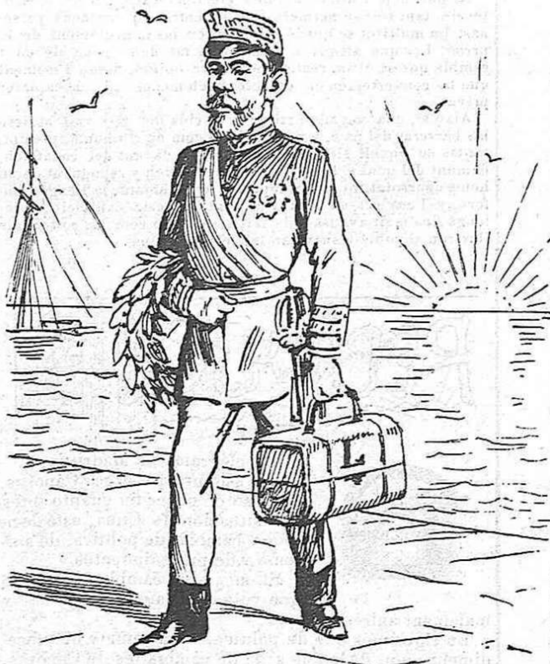
L' arribada d' un héroe: soletat.