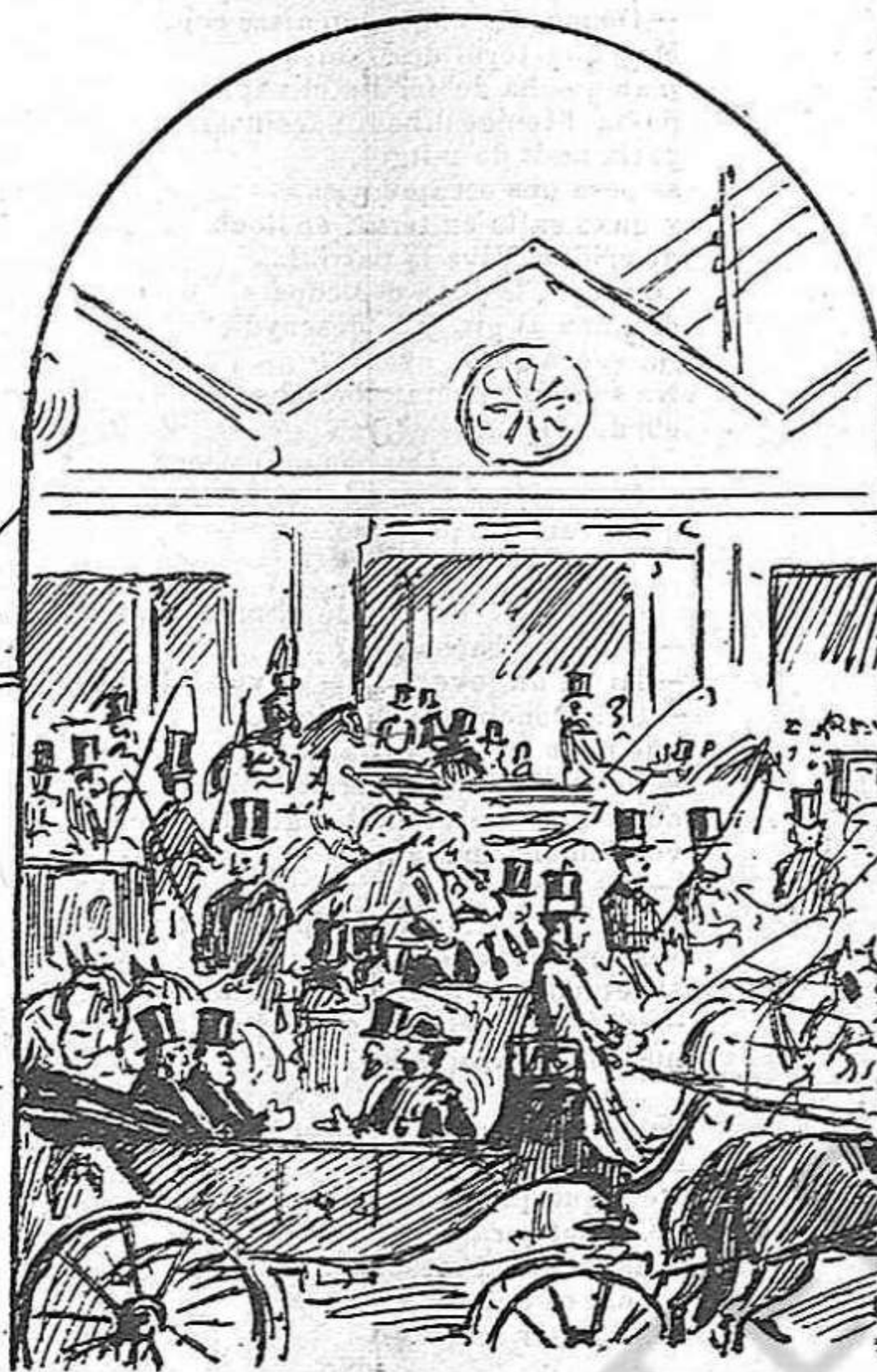
L' arribada de un ministre: gran corteig.