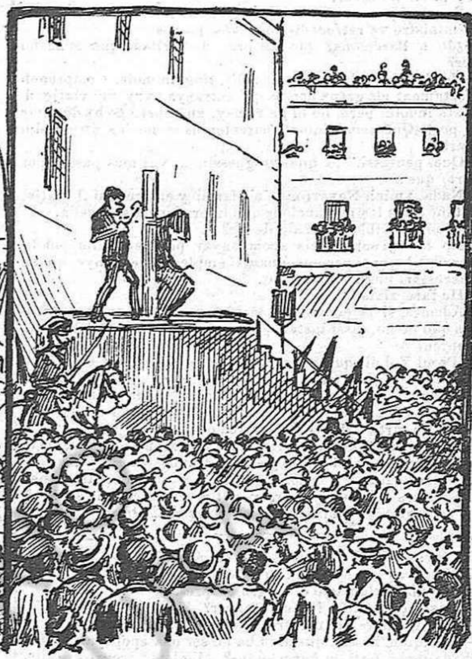
La pena de mort: entrada plena.

Si bé ells dirán: —Del Papa no n' hem de fer cas: ja fá molt temps que 'l Papa s' ha fet cipayo .