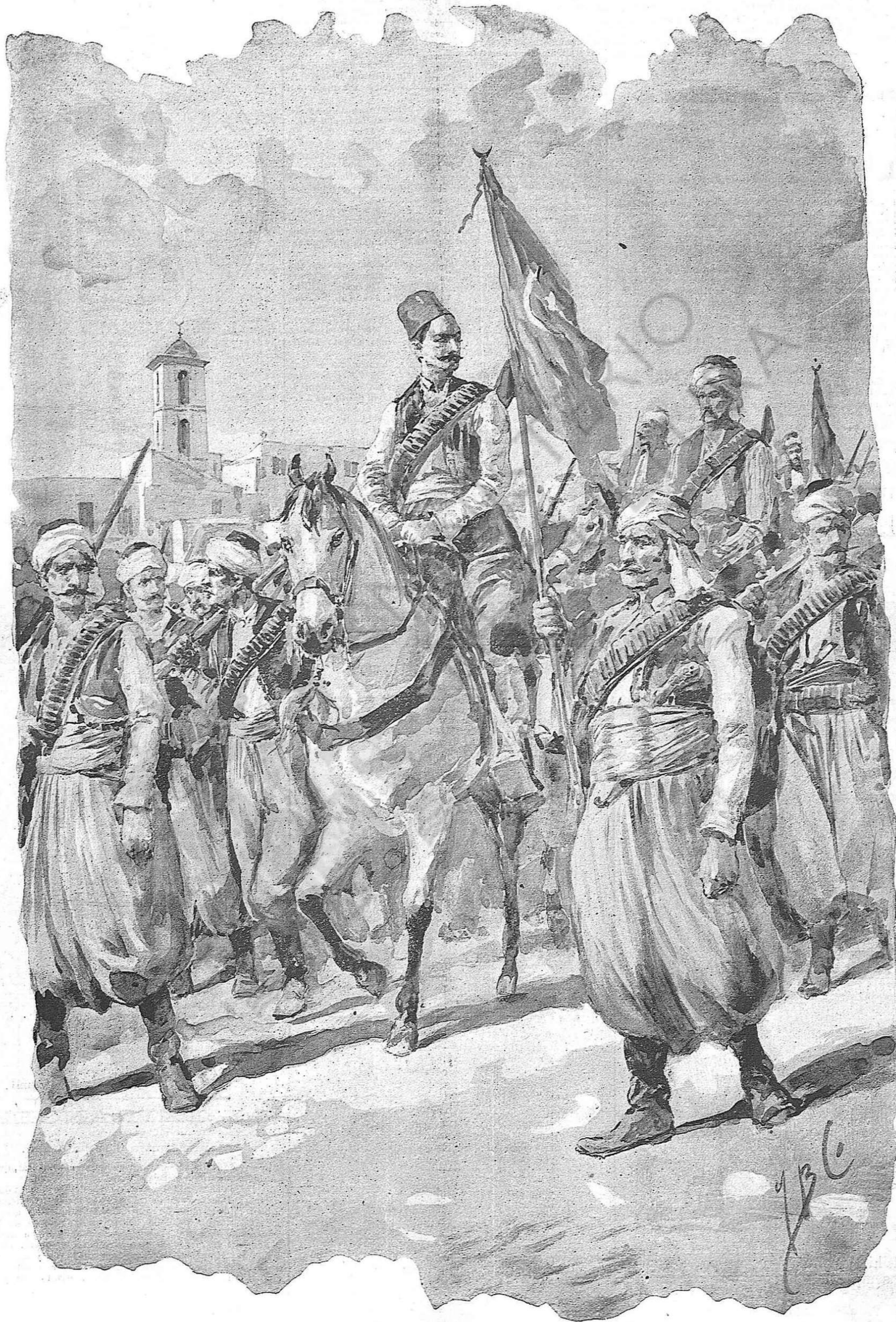
Grupo de tropas irregulares turcas anant camí de la frontera á reunirse ab l' exércit otomá.