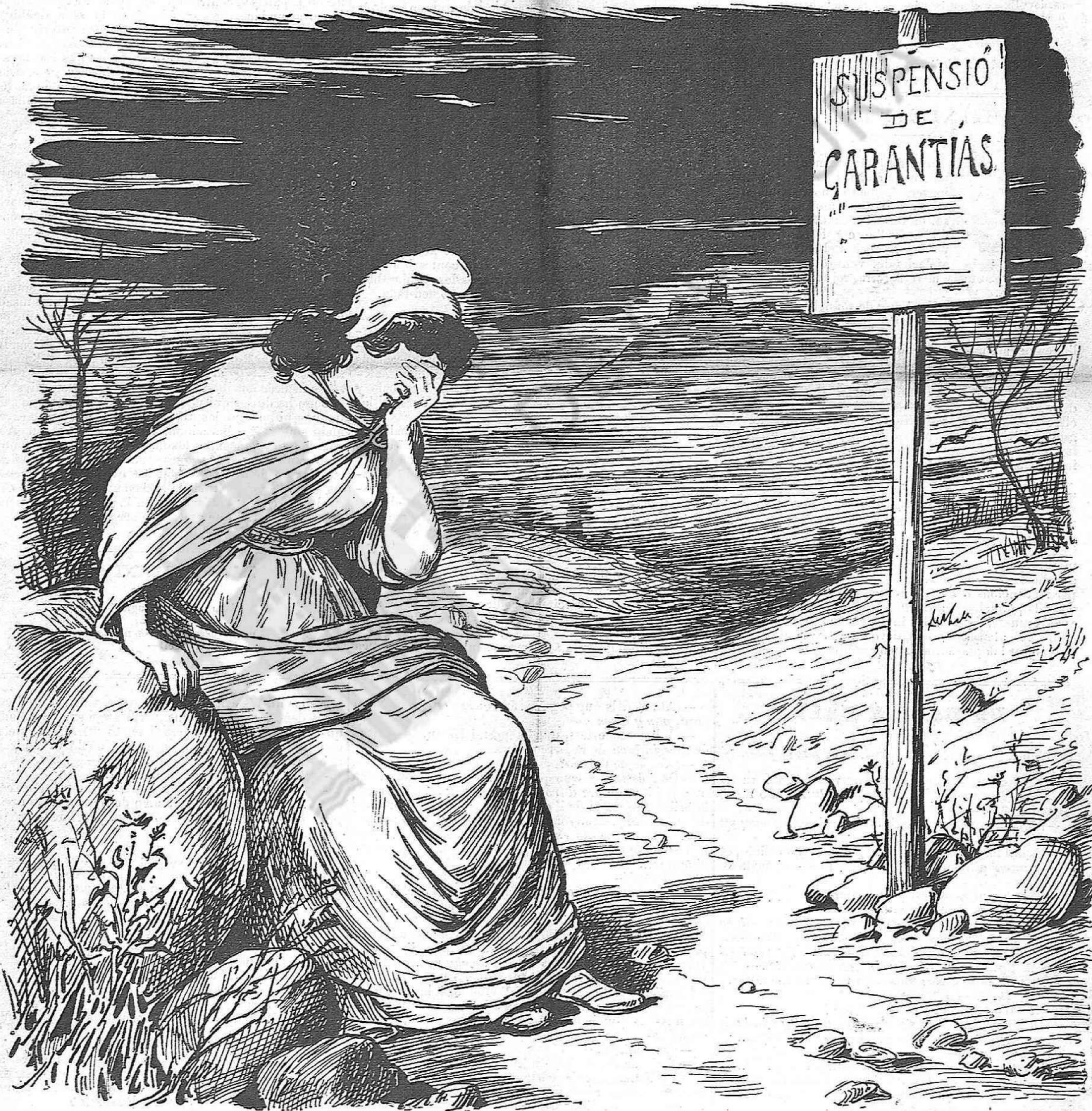
Lo primer de Maig á Barcelona.

PREU DE SUSCRIPCIÓ: Fora de BARCELONA cada trimestre ESPANYA pessetas 1'50 Cuba y Puerto-Rico, 2.—Estranger, 2'50.