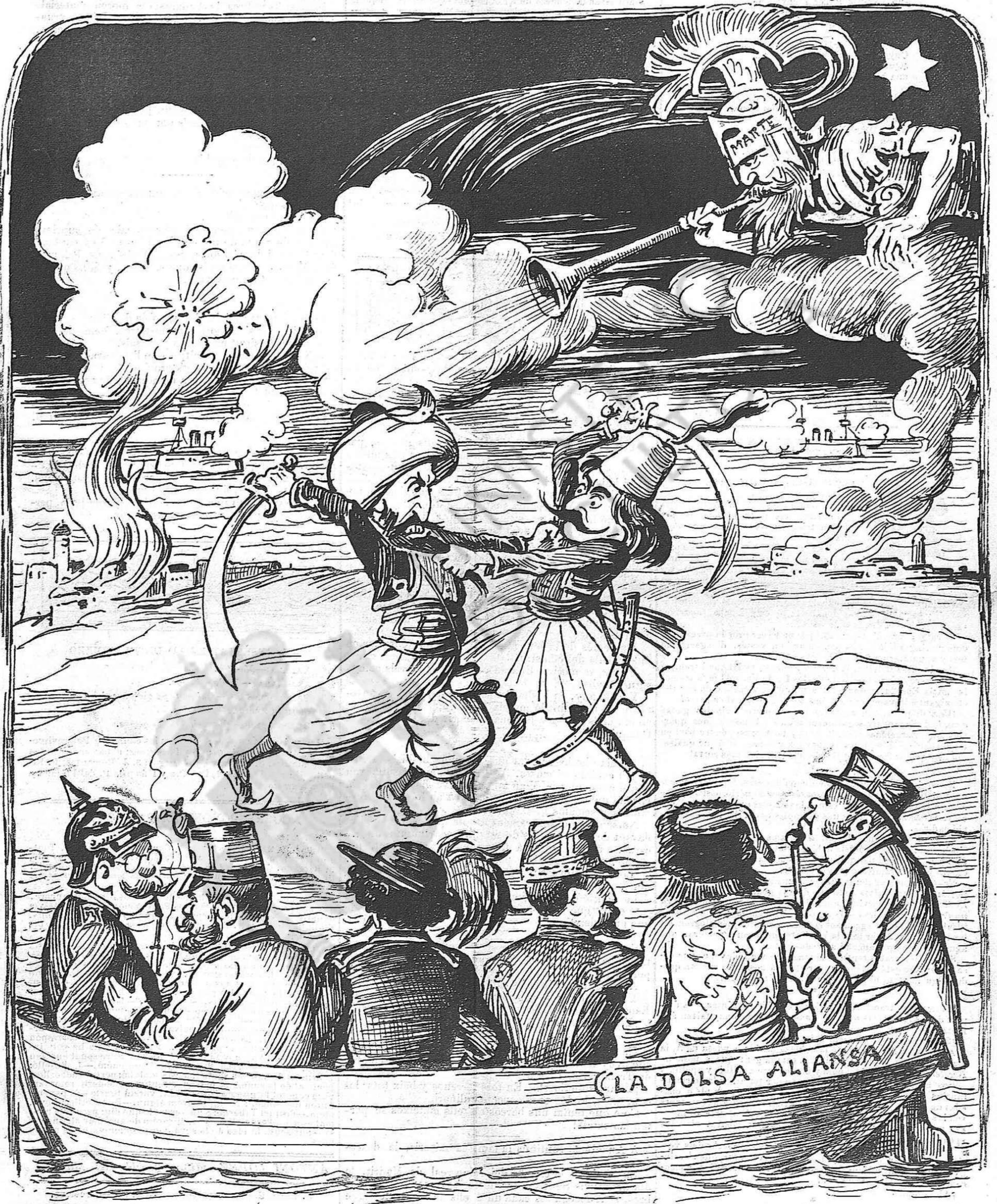
Al Orient ja la ballan. ¡Y qui sab com s' acabarà aquest sarau!