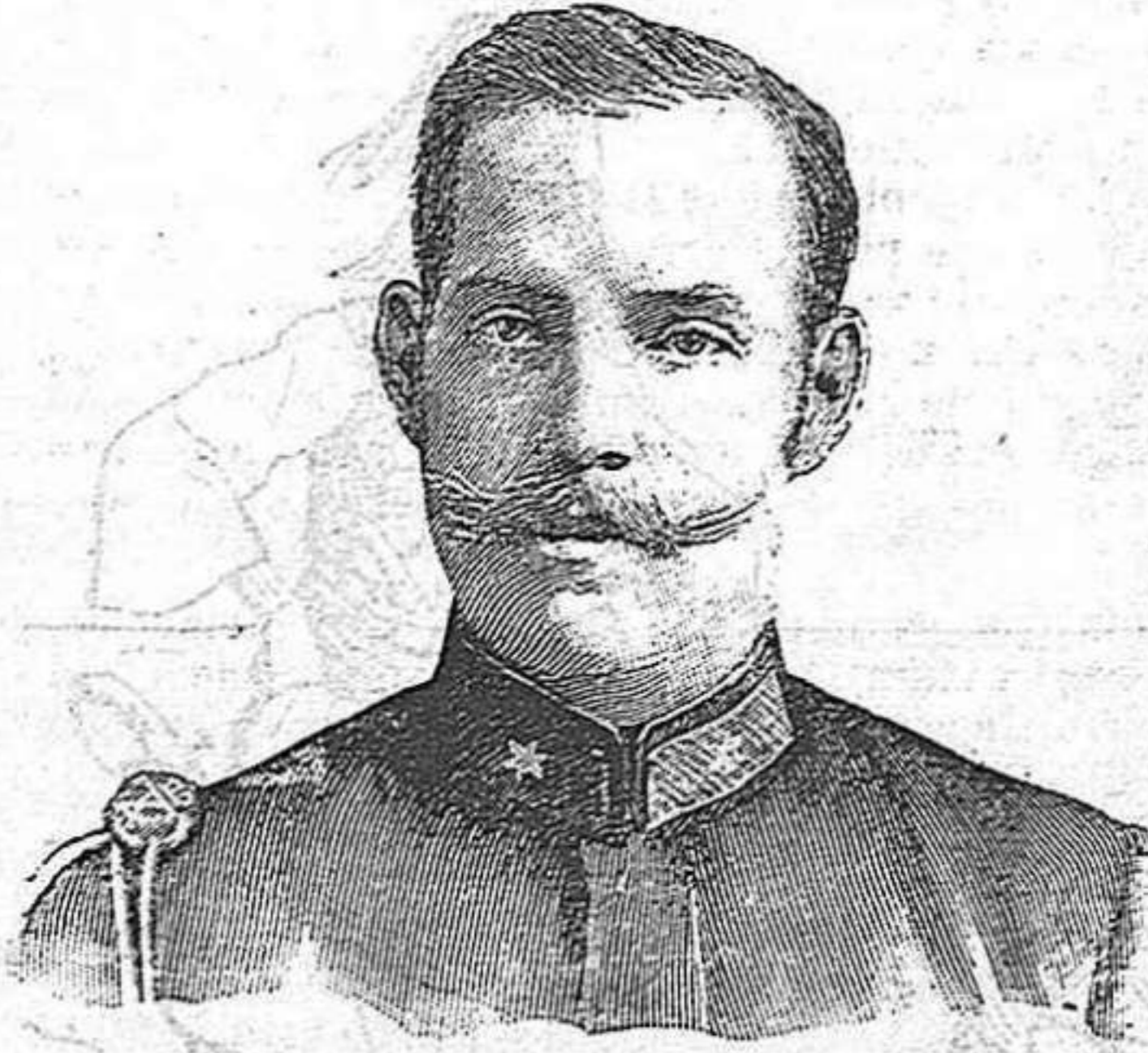
LO DUCH DE ESPARTA