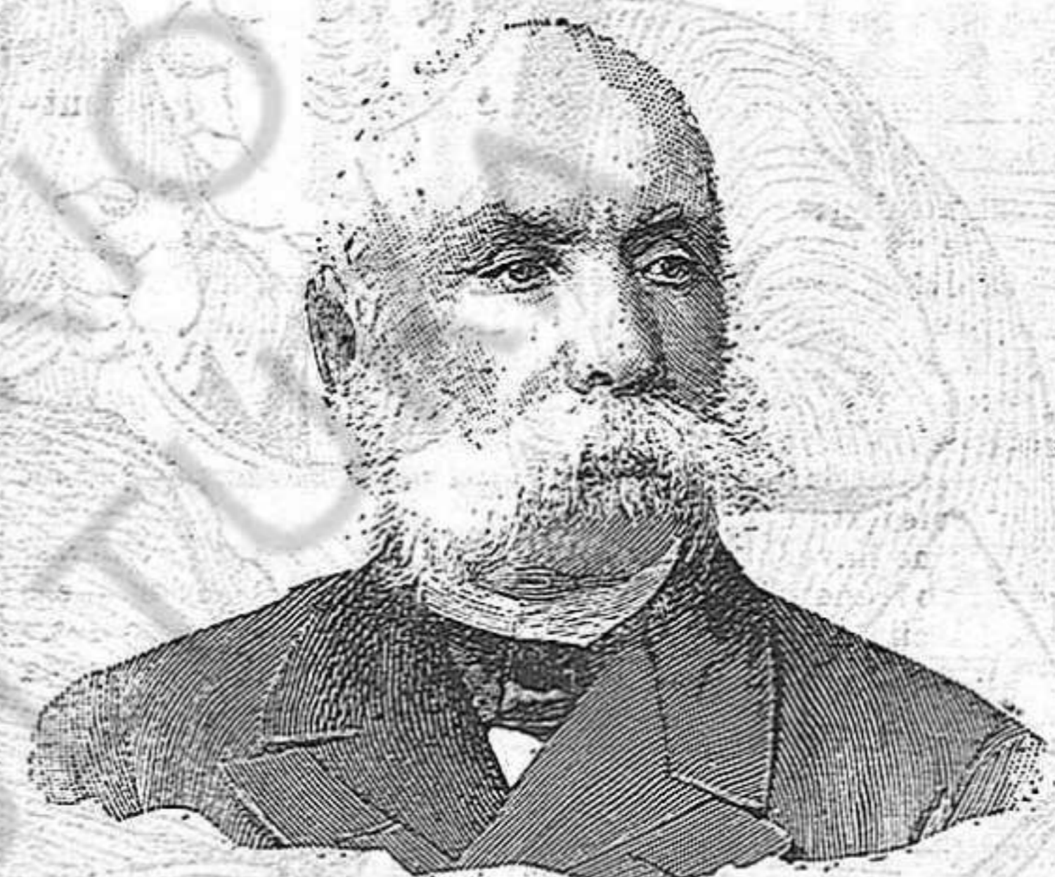
SR. DELYANNIS President del Consell de ministres de Grecia.

doná lloch dissapte á no, poch disgustos. Resultá que en l'iglesia del Carme ahont aquella s'afectuava, no deixavan deteners-hi á ningú que no portés targeta ó quan menos barret. Sembla qu' en lo successiu al Cel no deixarán entrarhi si no s'porta barret de copa y targeta.—Aixó féu que á la porta de la iglesia s'hi establissen uns quants joves cridant:—¿Qui me la ven?—¿Qui me la compra?—Tots los municipals de la ciutat, á las ordres del seu celoso comandante feyan recular á la gent de baixa estofa que pretenían entrar al temple.—Fanatismo y privilegis: vels'hi aquí lo que avuy prepondera, com á conseqüencia de la reacció imperant.