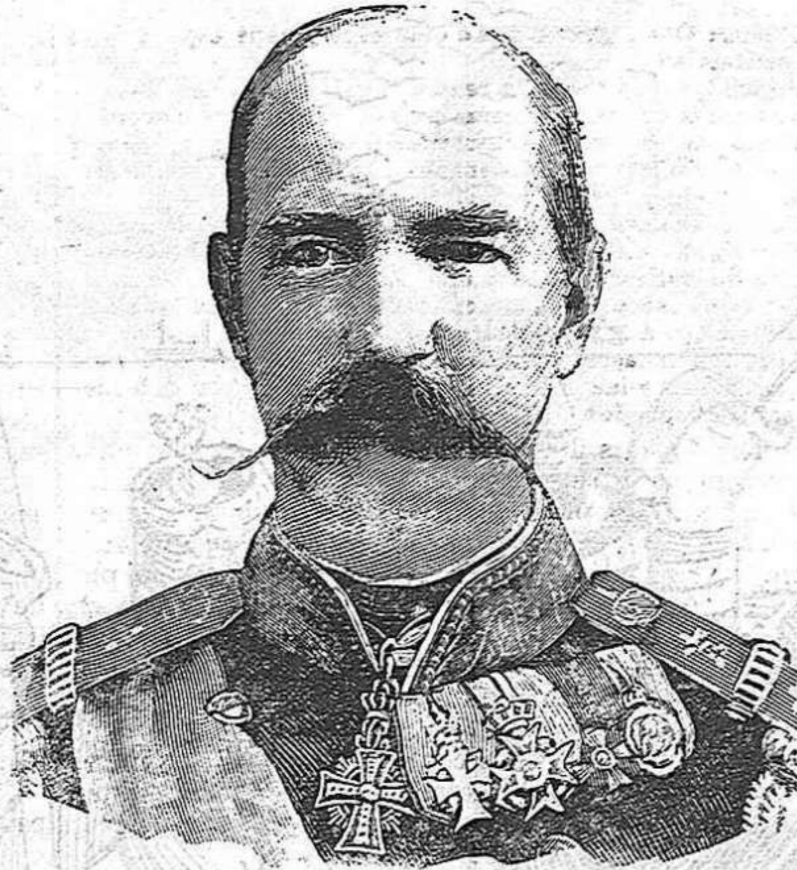
JORDI I. er , REY DE GRECIA