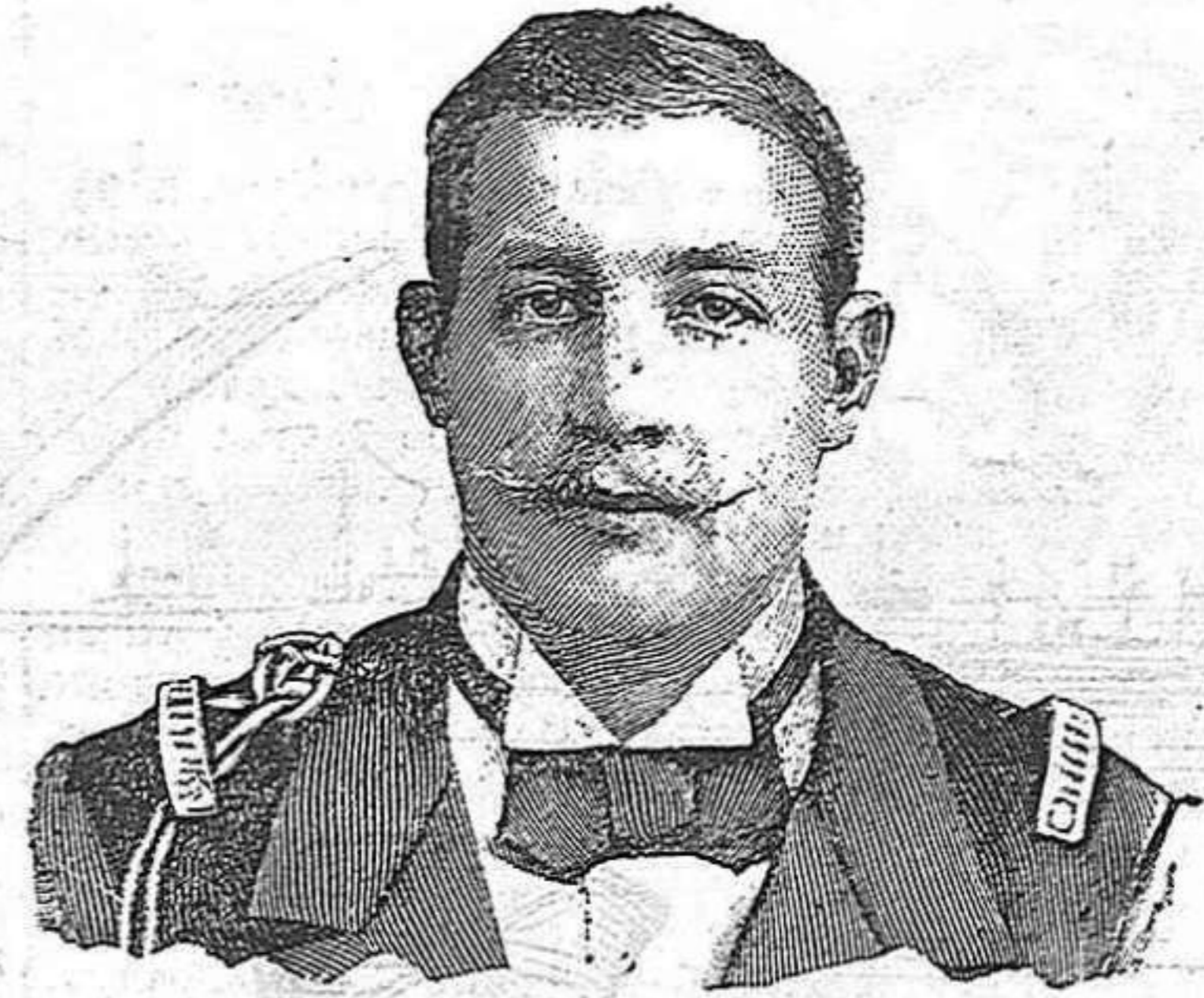
LO PRÍNCEP JORDI Comandant de la Esquadra grega de operacions á Creta.