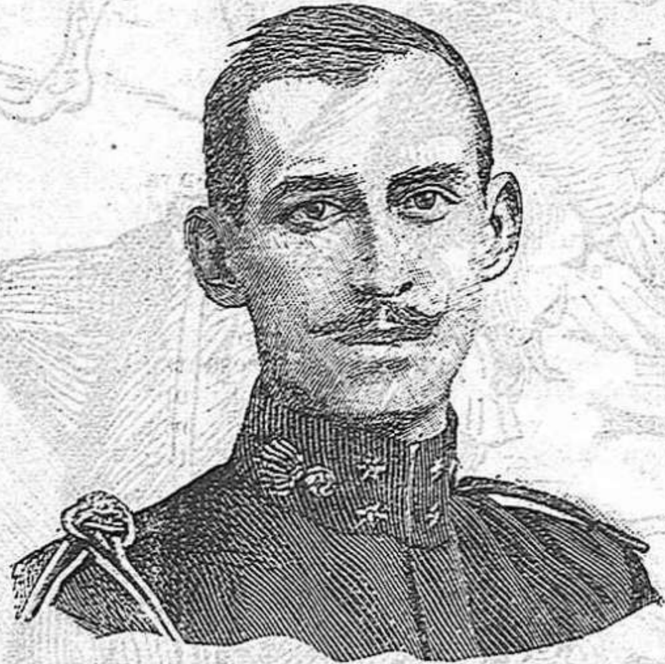
LO PRÍNCEP NICOLAU