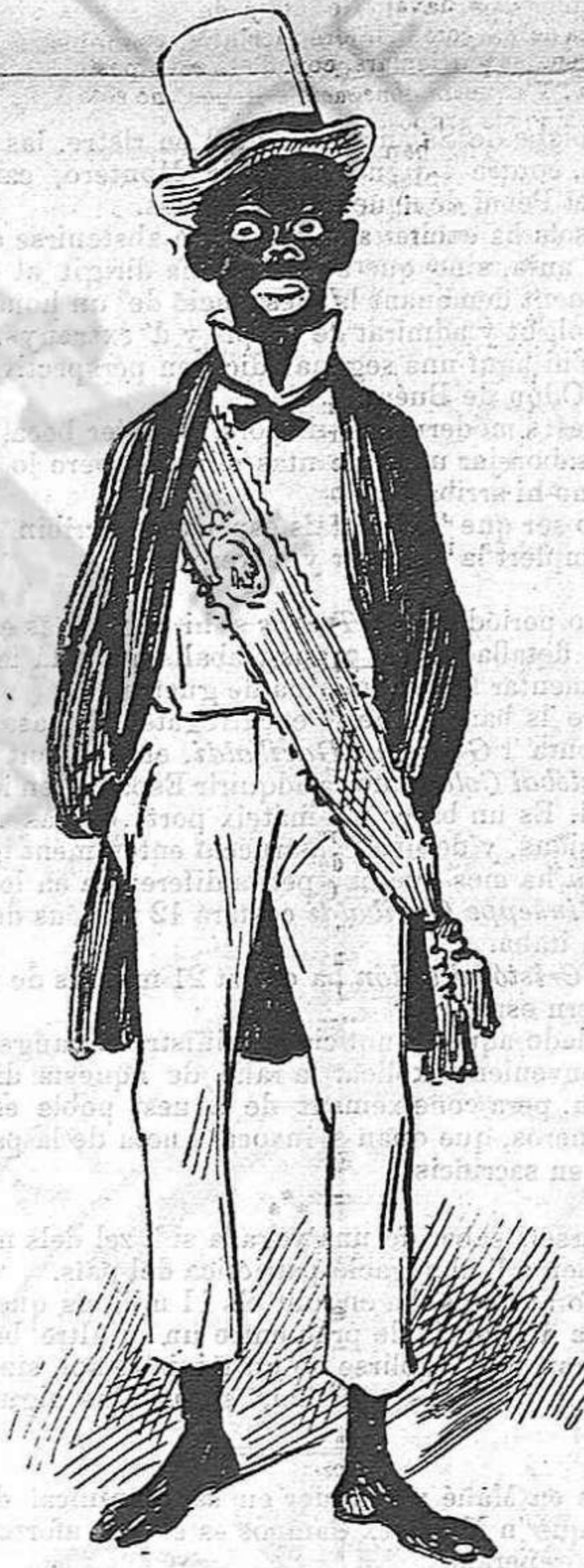
Quando vengan las refolmas ya me tienen regidó!...