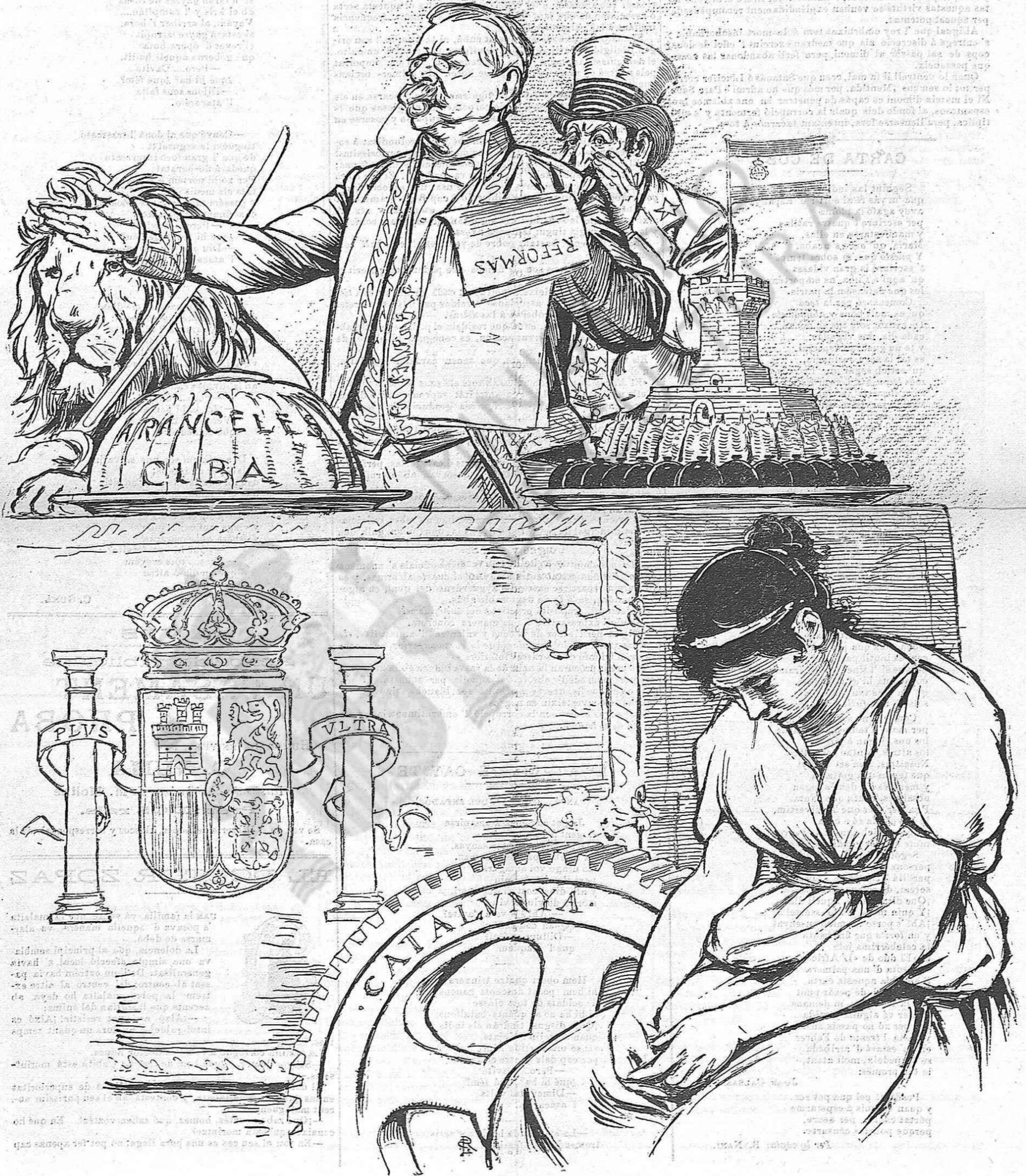
A n' el mercat de Cuba feuli un nus á la qua