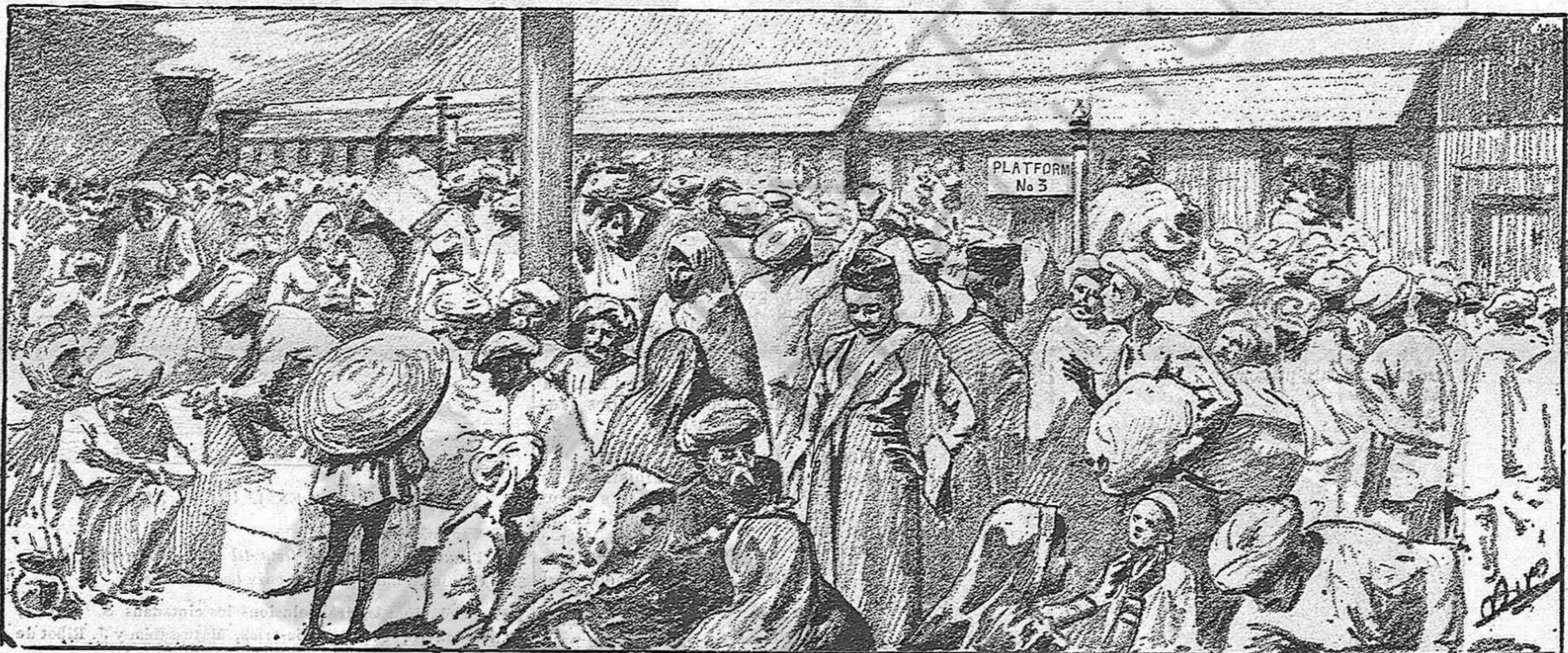
EN LA ESTACIÓ VICTORIA.—La multitud, presa del pánich, fugint de la ciutat apestada.