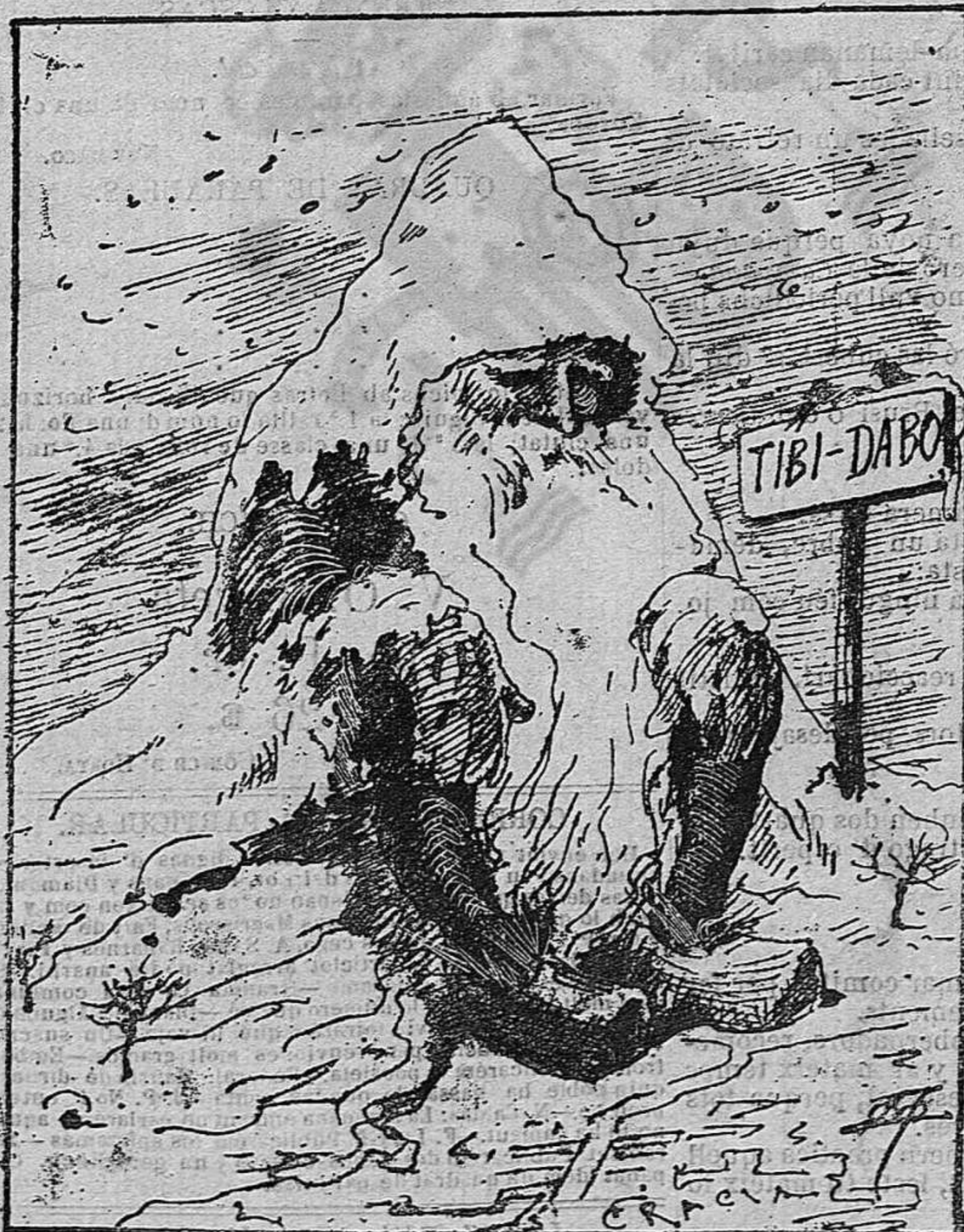
La máscara que ha cridat més la atenció.

—¡Qui 'u havia de dir que no havia de durar aquella pluja.