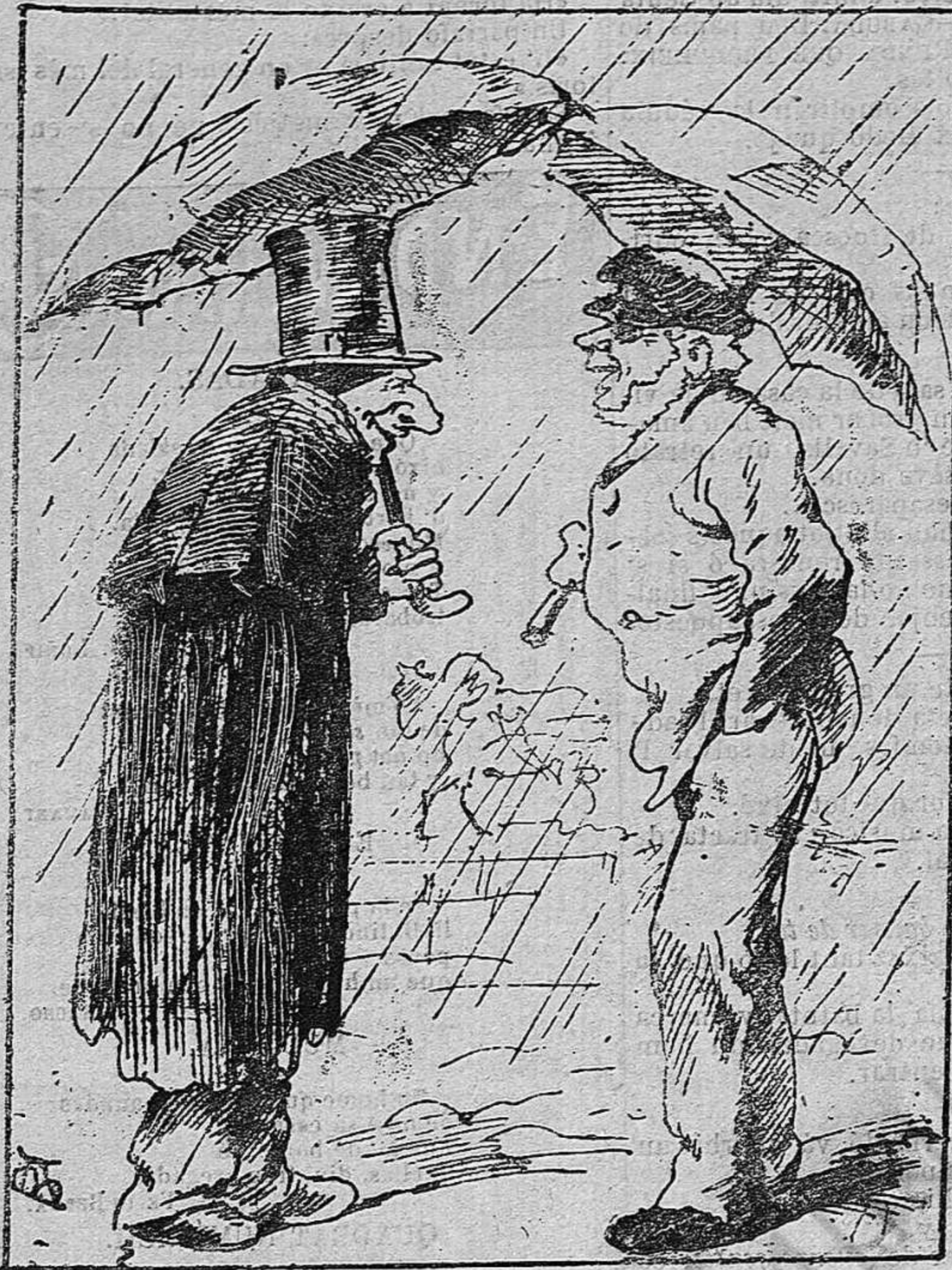
LOS NEOS ALS DEMATINS.

—¡Ay alabat siga Dèu! A veure que surtin!