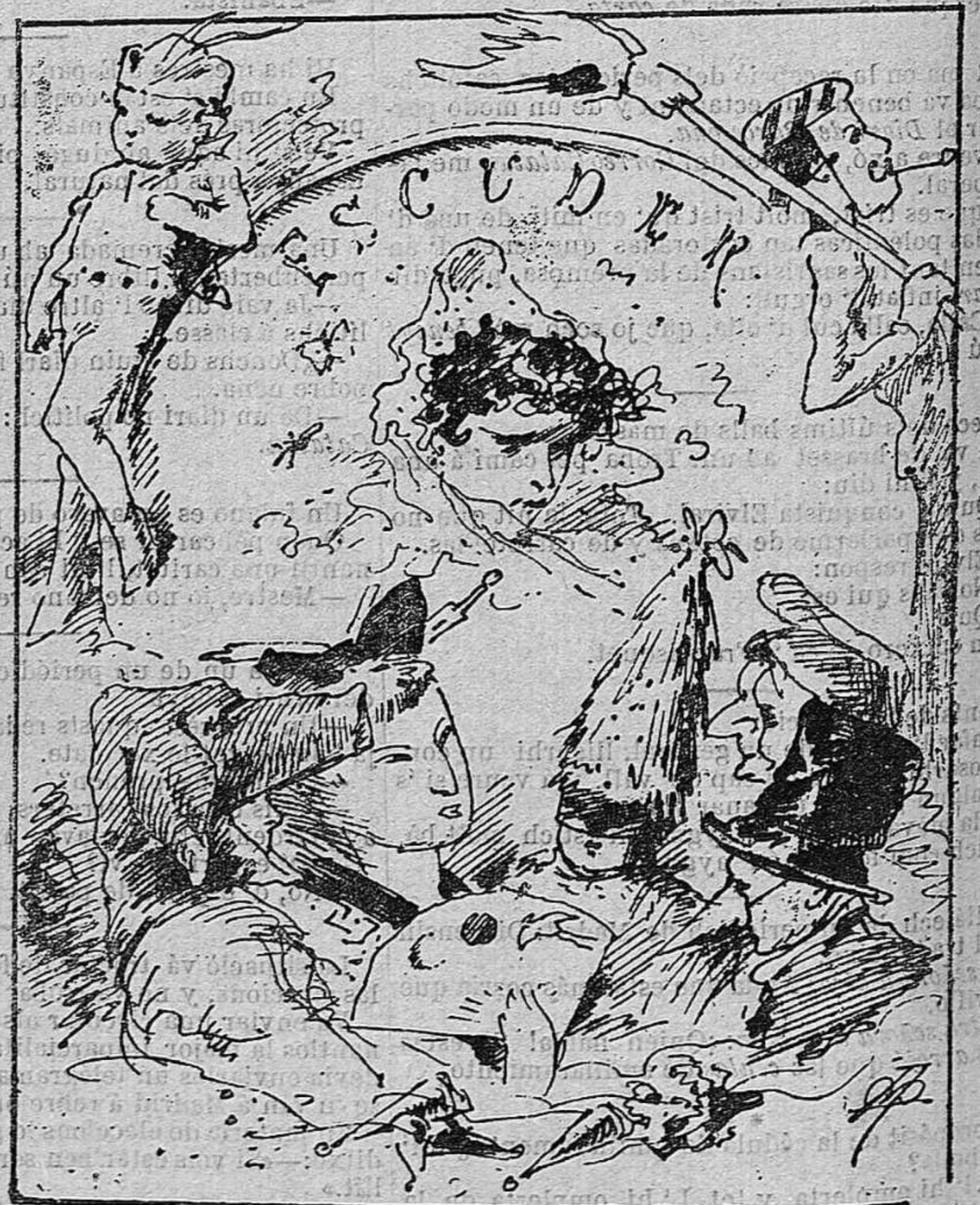
Recorts de la Rua.