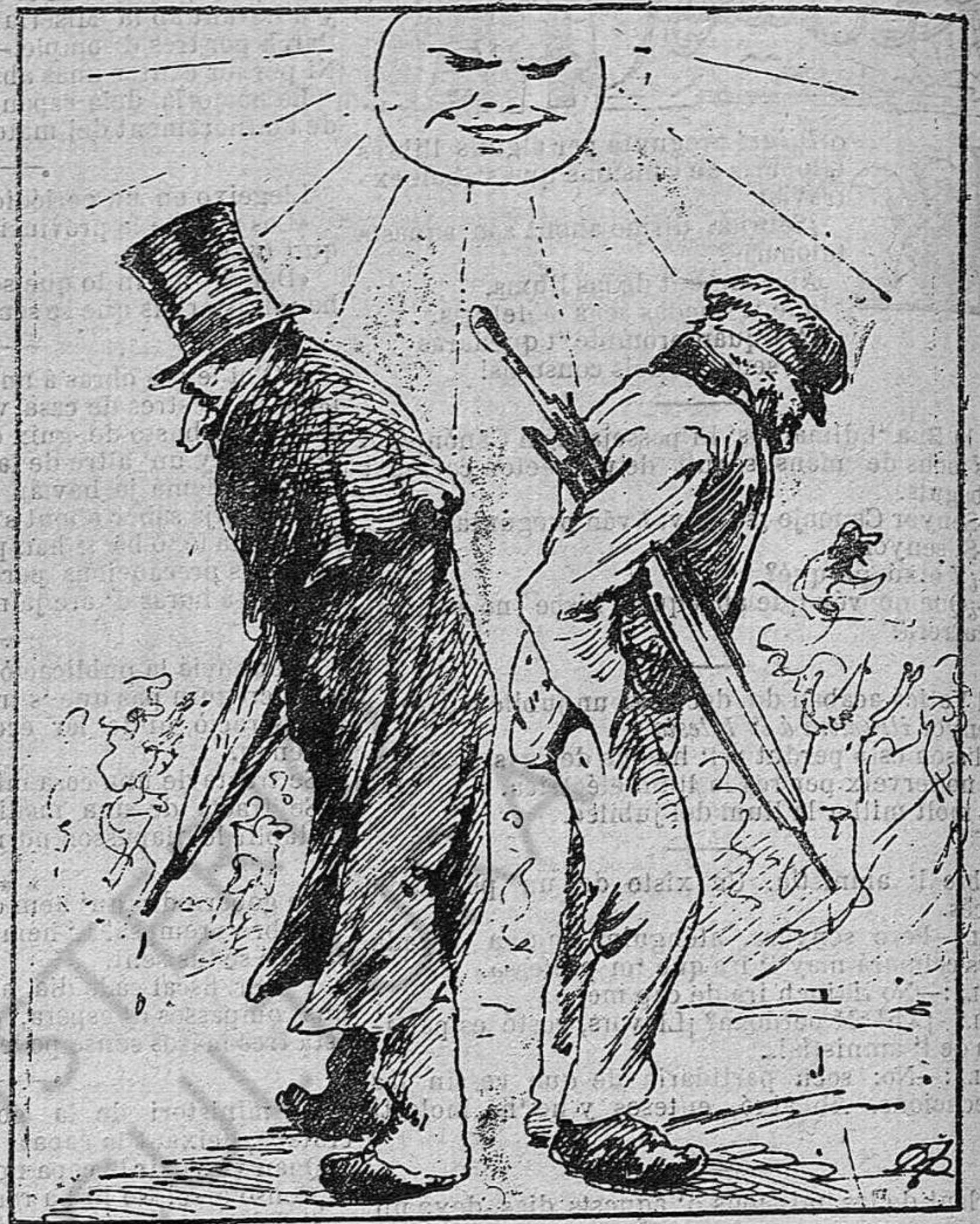
LOS NEOS A LAS TARDES.

—¡Ay alabat siga Dèu! A veure que surtin!