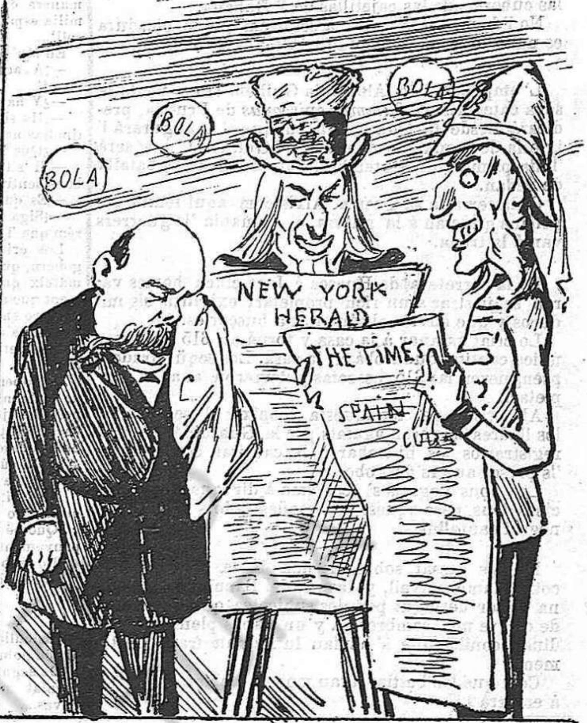
Ell apoyarà lo govern ab la qüestió de Cuba y demés.