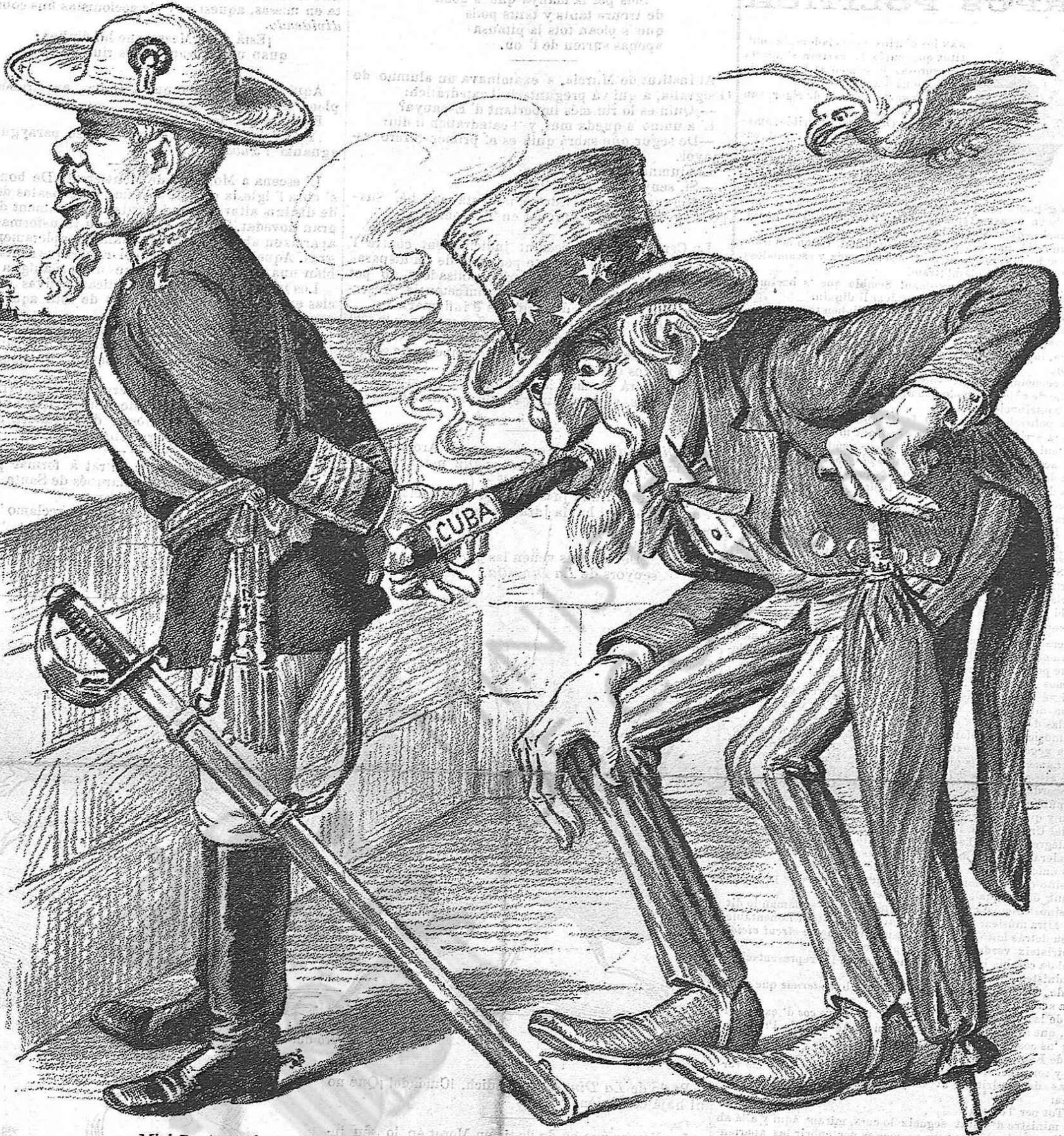
—Miri D. Arseni que si 's vá entretenint y 's distreu, aquest mano se li fumará tot el puro.

societat que havia anat als toros per primera vegada, digné al despertar-se al seu marit: —¿Creurías que tota la santa nit hi estat somiant lo mateix? —¿Y qué has somiat? —Banyas.