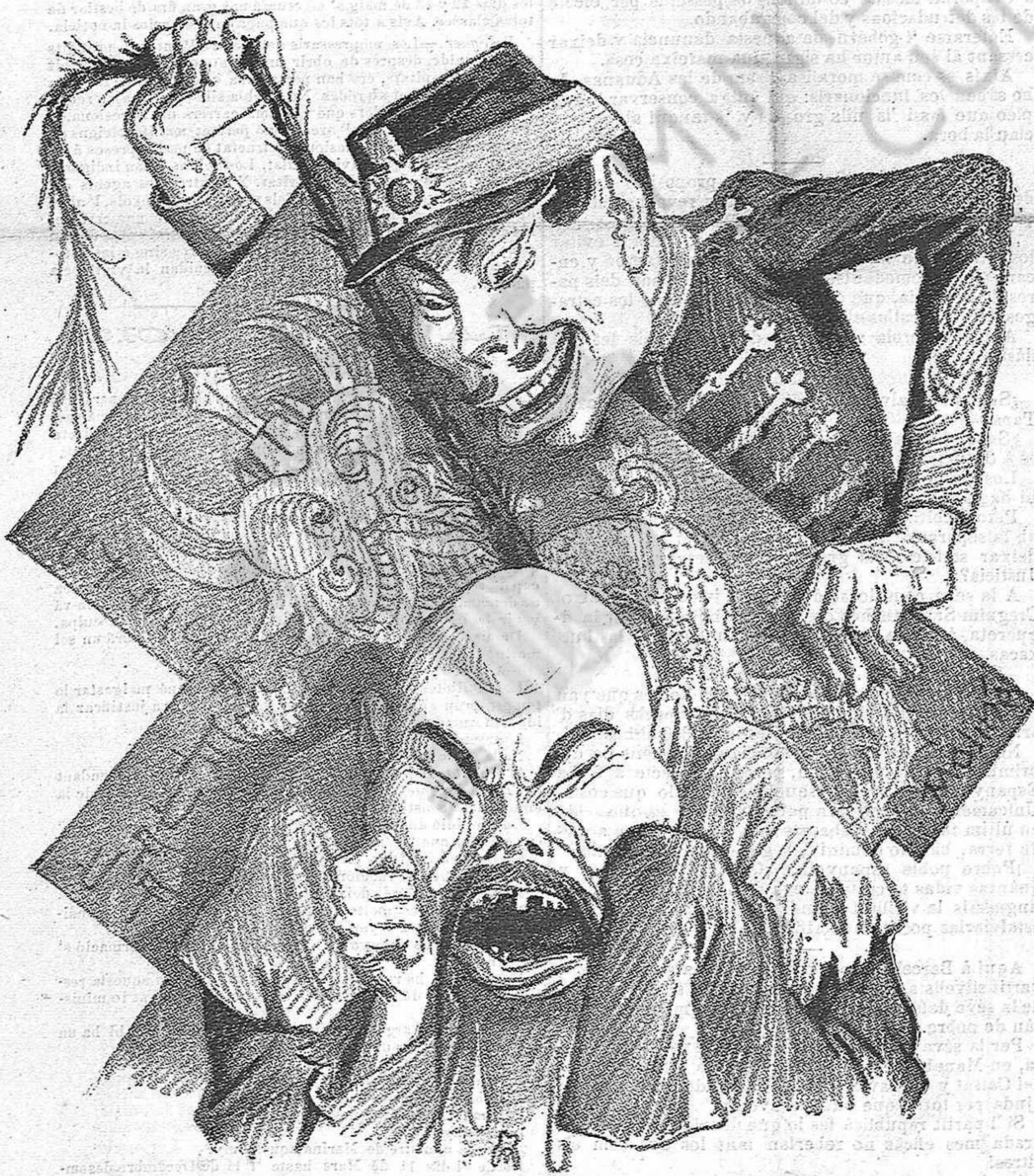
En Jap que riu y en Chin que plora.