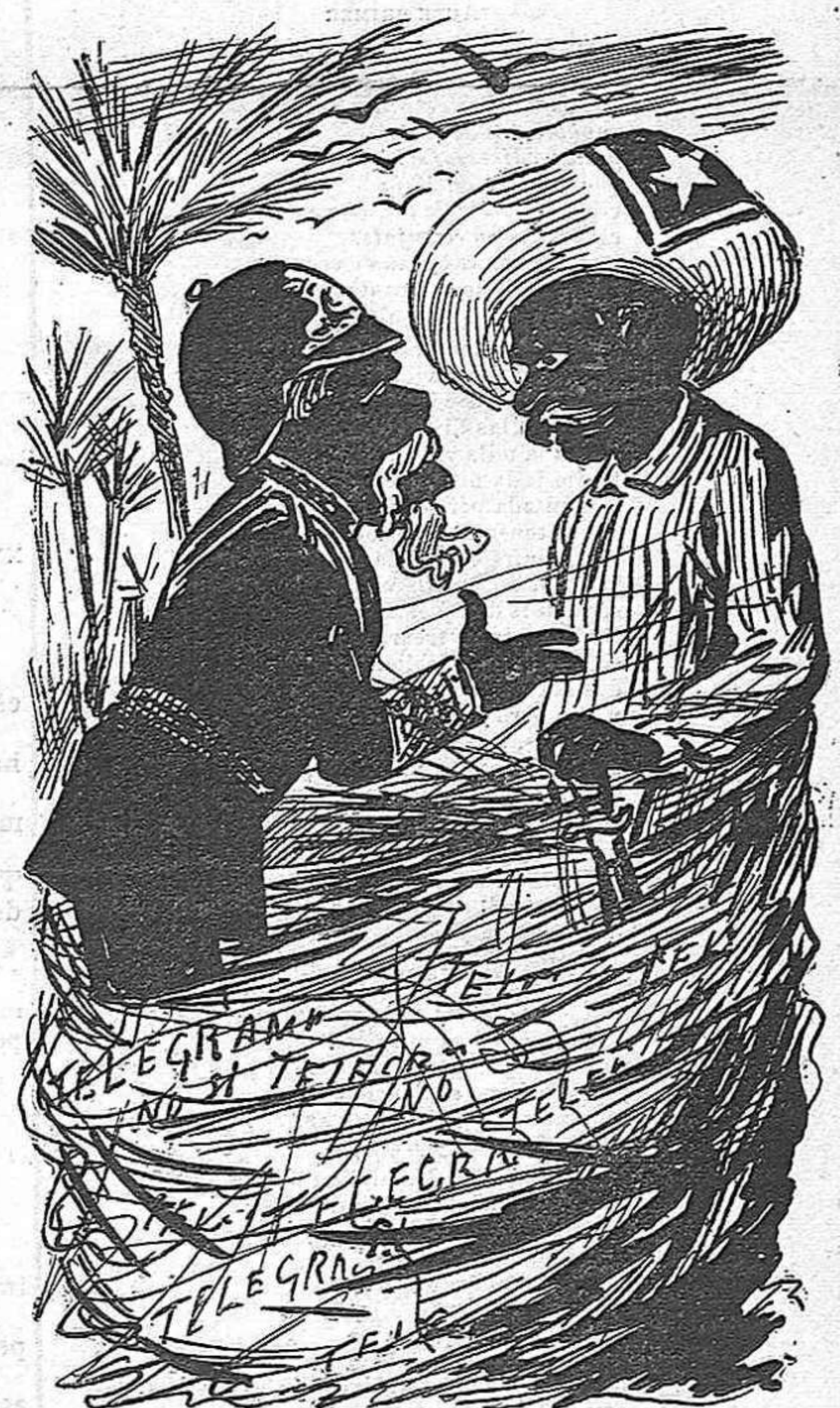
Vels' hi aquí un lio que ni Deu l' enten.