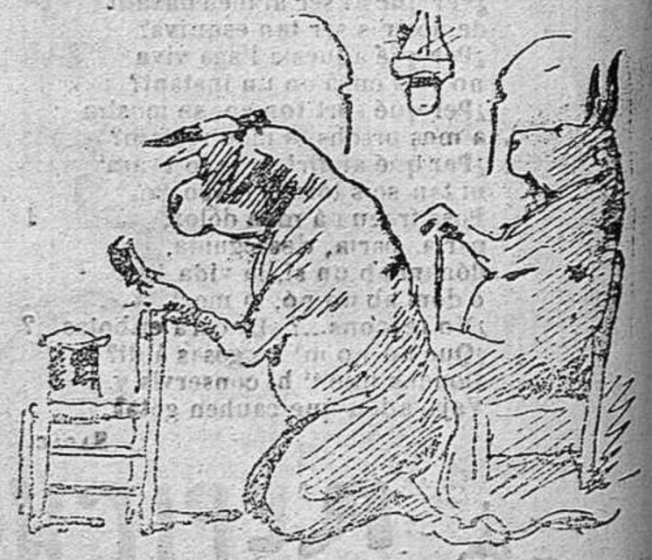
Los toros están rebent una educació esmeradíssima.