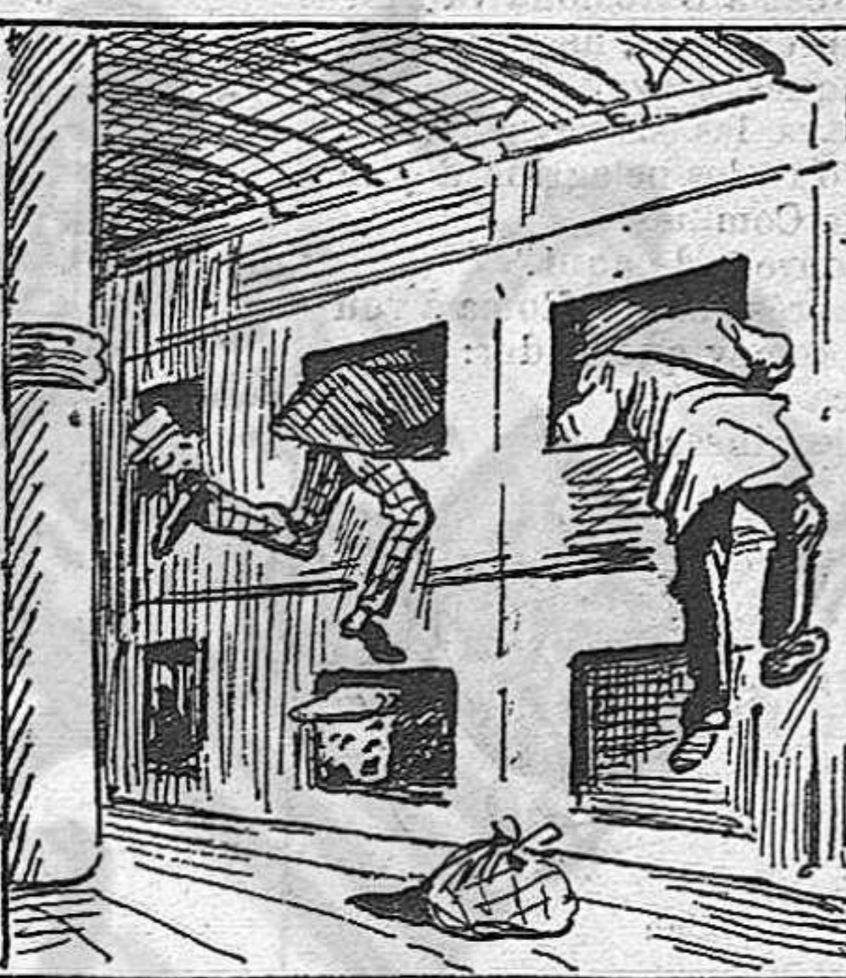
Per ficarse a la llitera han d' entrar per uns forats grans com una gattonera.