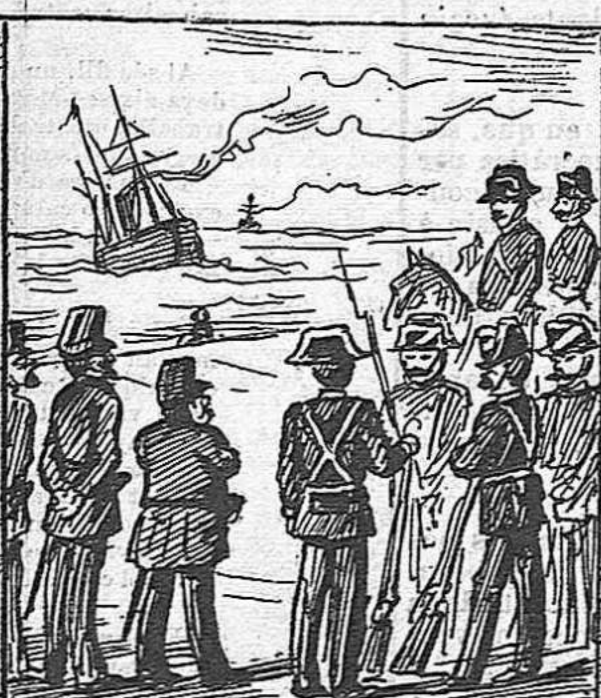
Los únichs que ben tranquils van a veure com arriban, son polissons y civils.