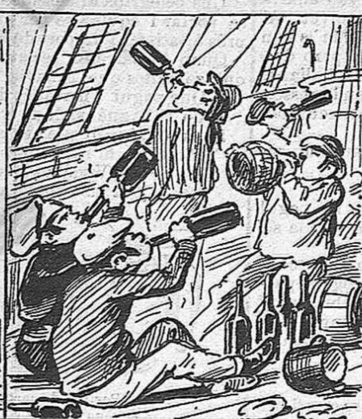
Lo menjá es bastant mesquí pero, en compensació, tenen molta abundancia de vi.