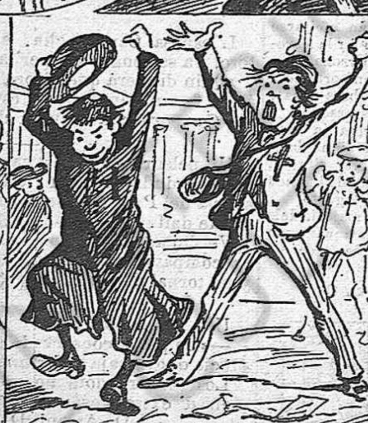
Al cap de poca estoneta, dos pelegrins ¡més miracles! perden de cop la xaveta.