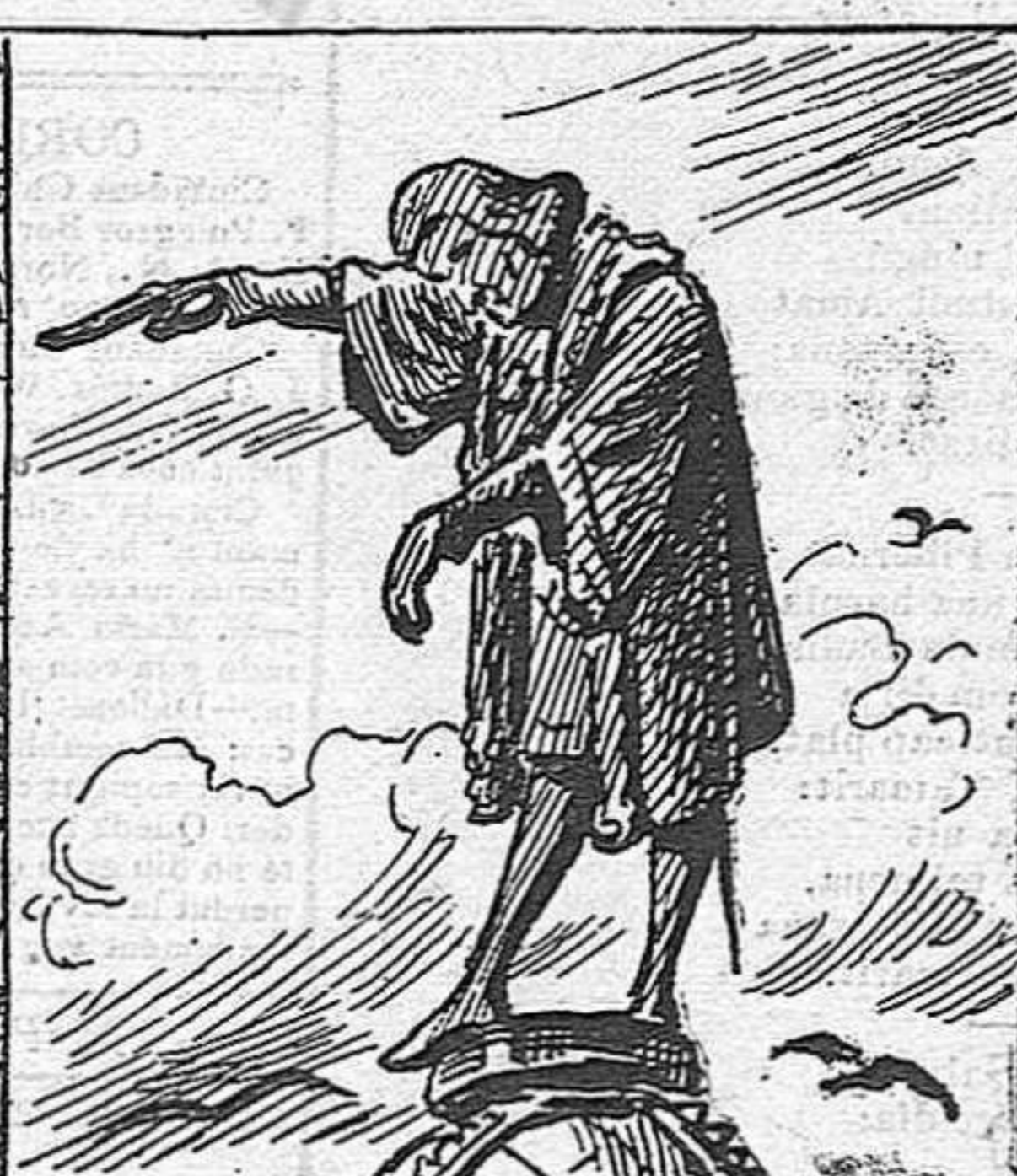
Colón desde 'l seu sitial, ven y avisa la tornada del remat espiritual.