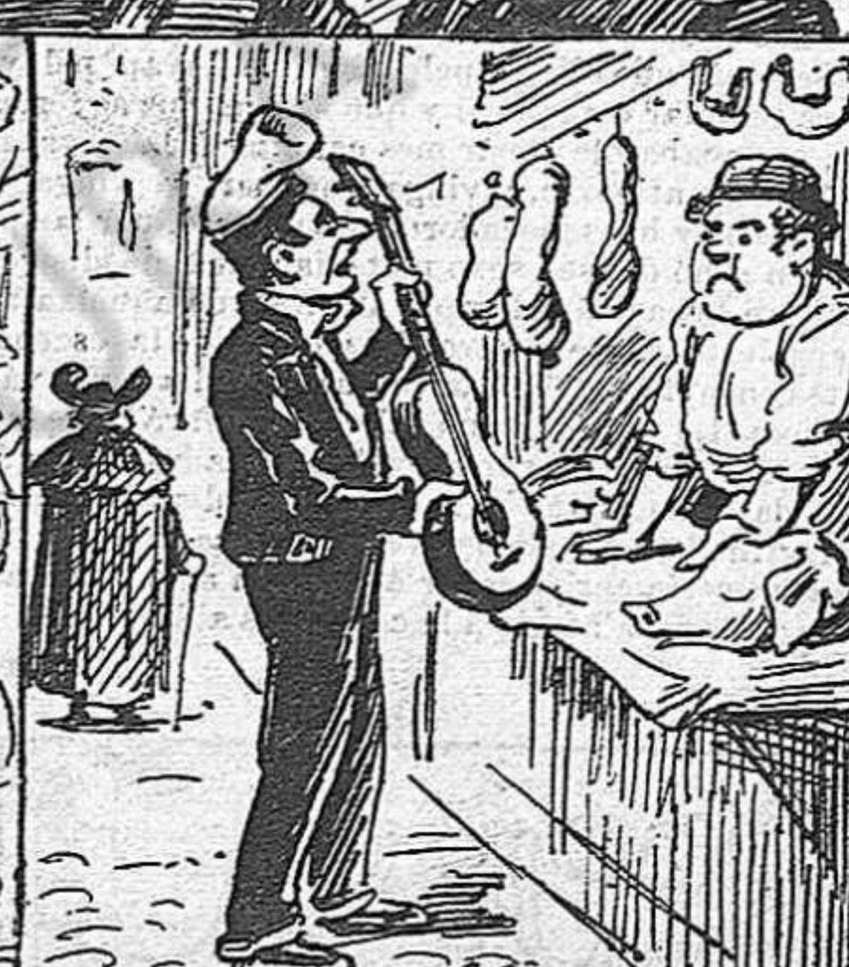
—¿Quánt aquesta butifarra? — Una lira. — ¡No 'n tinch cap ¿Ne voléu una guitarra?