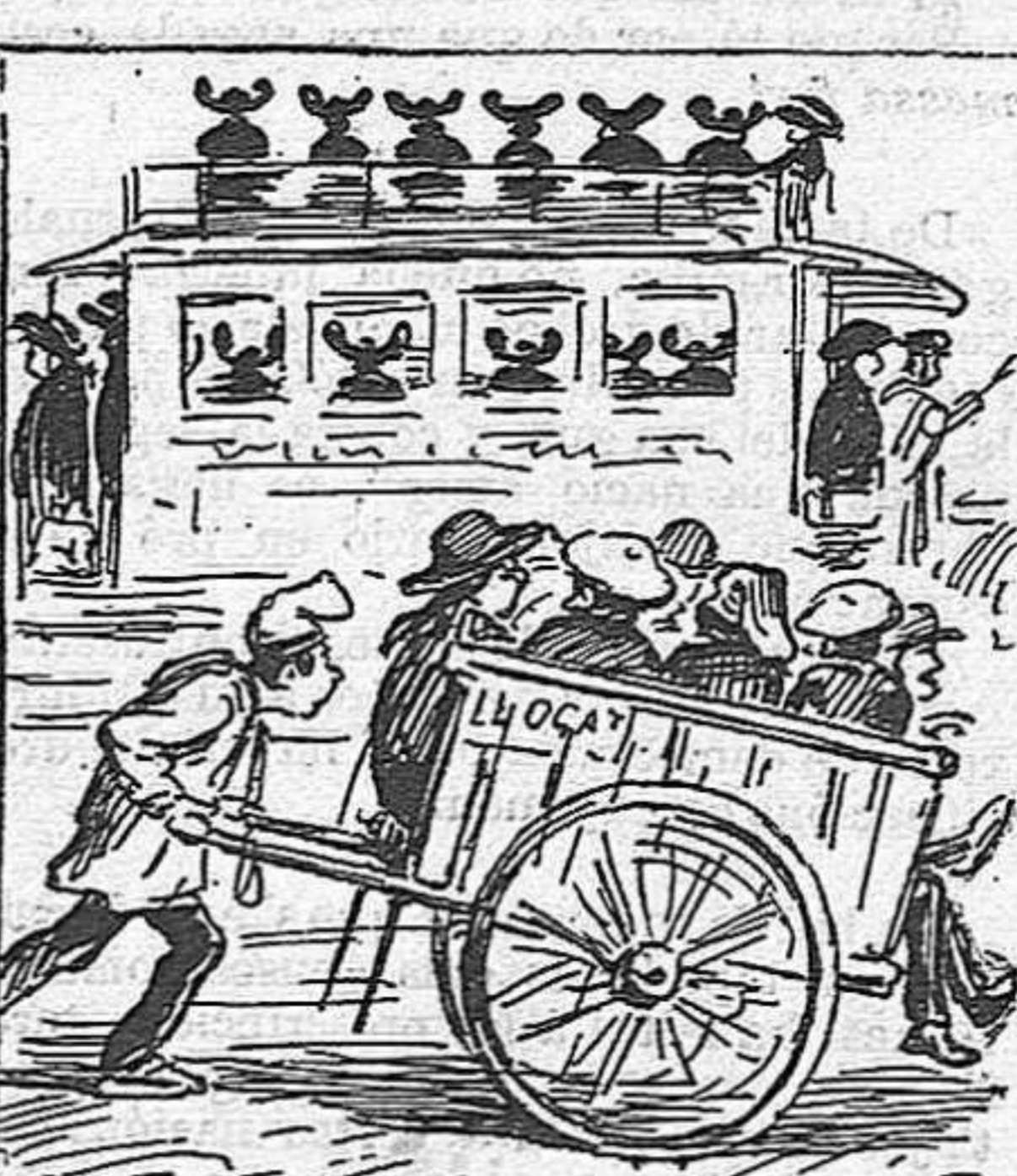
Qui a pata, qui en carretó, se dispersan tots, y acaba la gran pelegrinació.