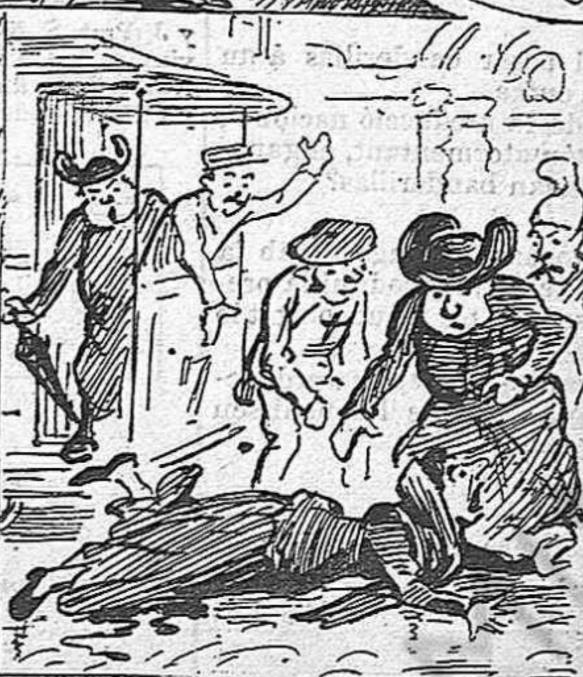
Una pelegrina un dia joh miracle! 's romp la cama al 'ná a baixar d' un tranvia.