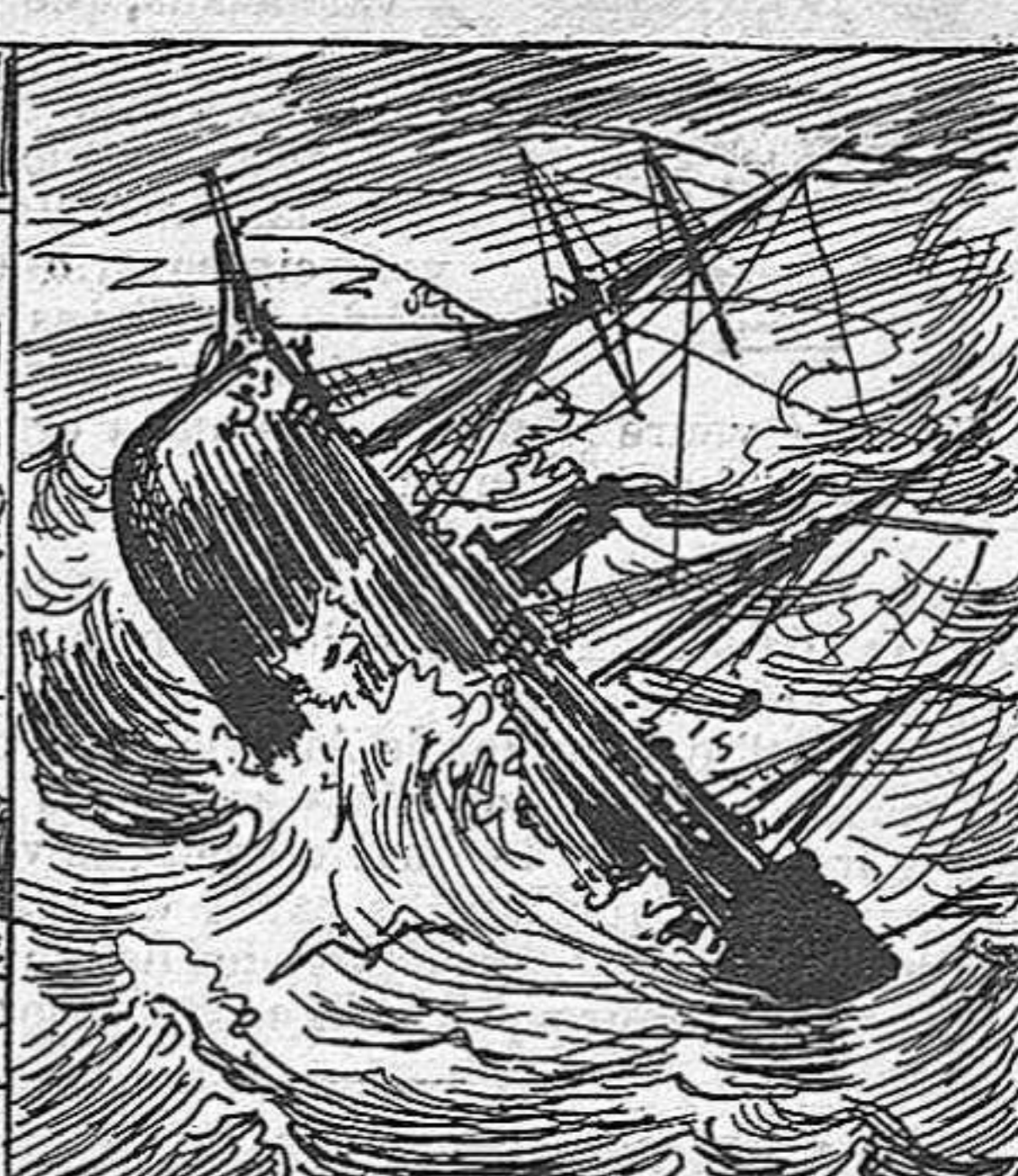
Lo cel, sempre generós, té la bondat d' obsequiarlos ab un viatge deliciós.