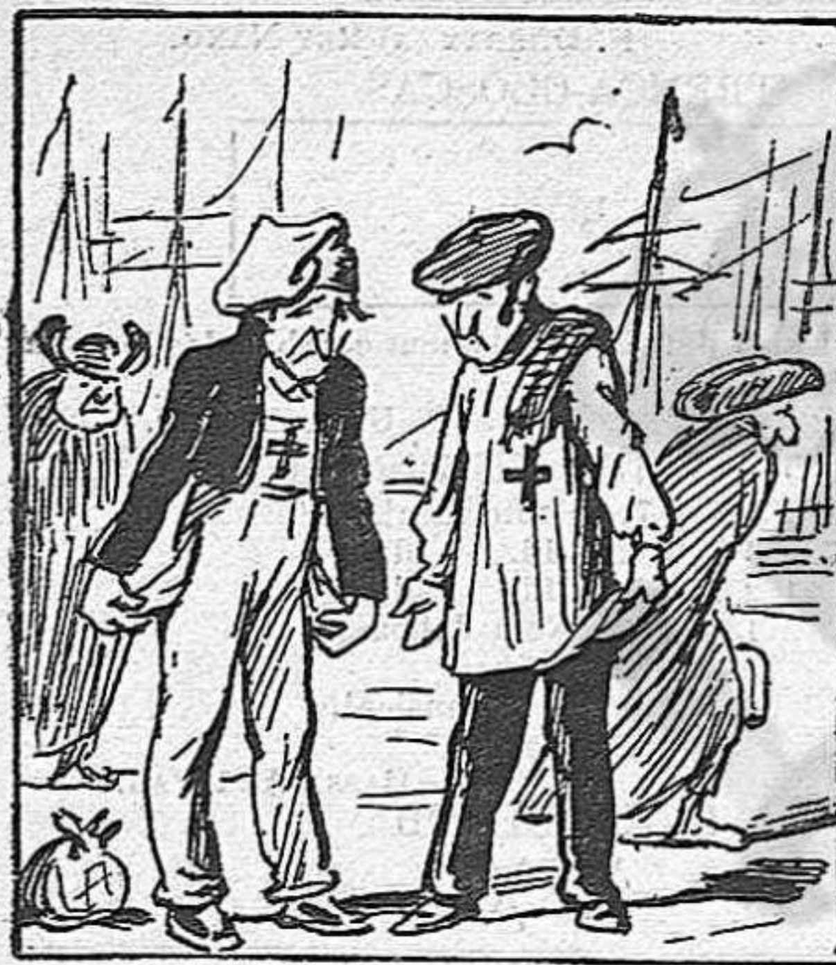
Mullats y sense dinés, tornan a Civitavecchia y s' embarcan de regrés.