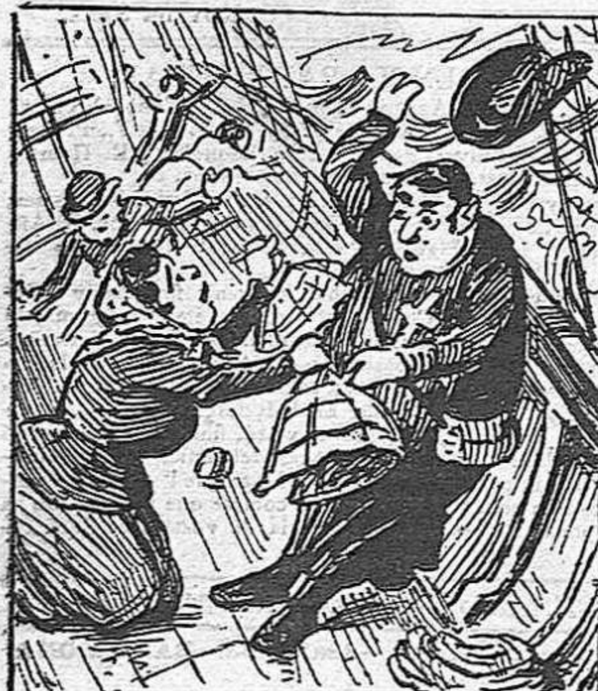
—¡No s'espanti mossen Comba! Pósis aquests salvavidas per si acás lo barco 's tomba.