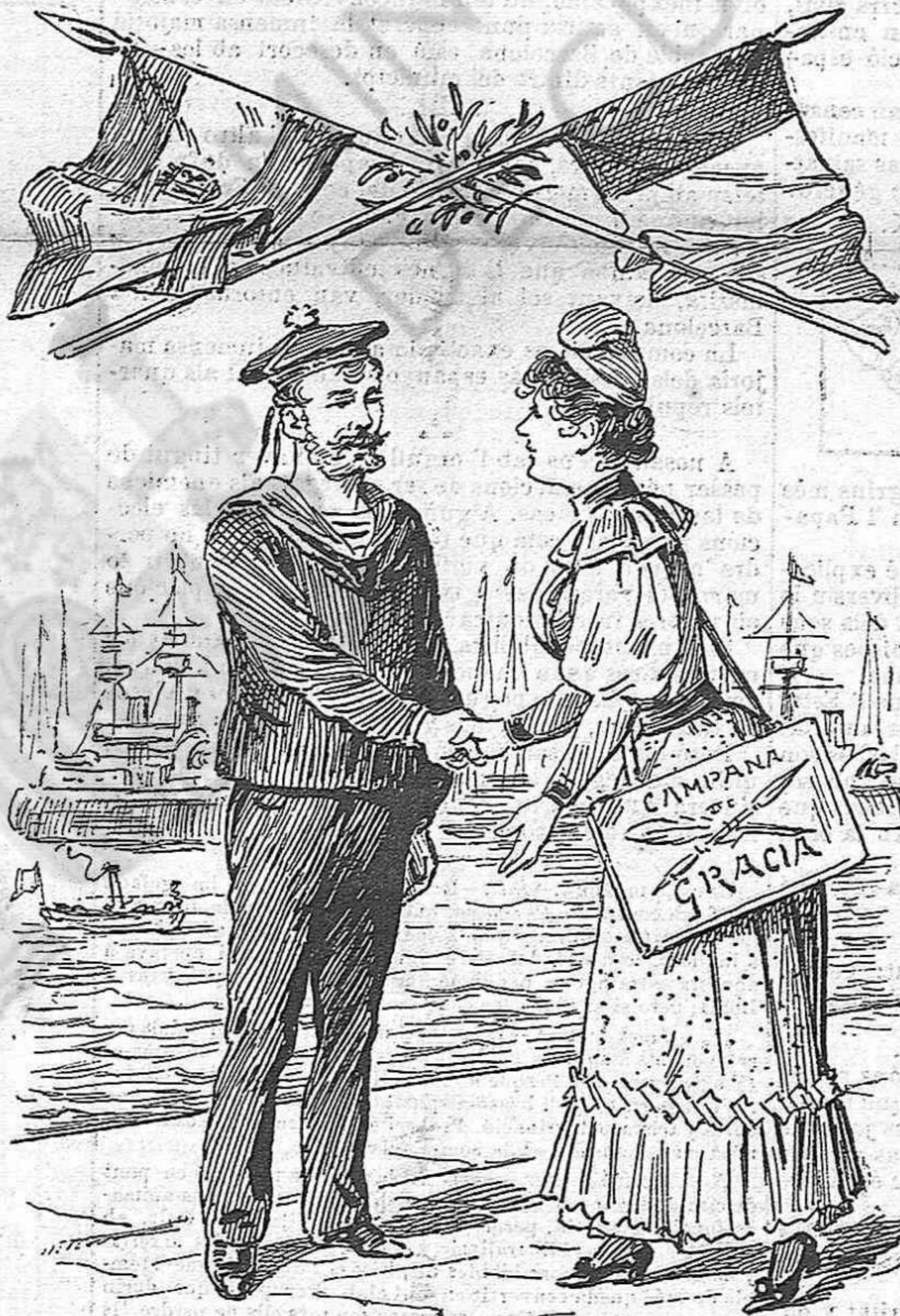
LA CAMPANA DE GRACIA saluda als intrépits marinos de la República Francesa.

Y á pesar de que 'n Cánovas y en Sagasta també han sigut xiulats en distintes ocasions, los diputats y senadors de la conservaduria y de la fusió, han demostrat pels pelegrins més interés que per en Sagasta y per en Cánovas.