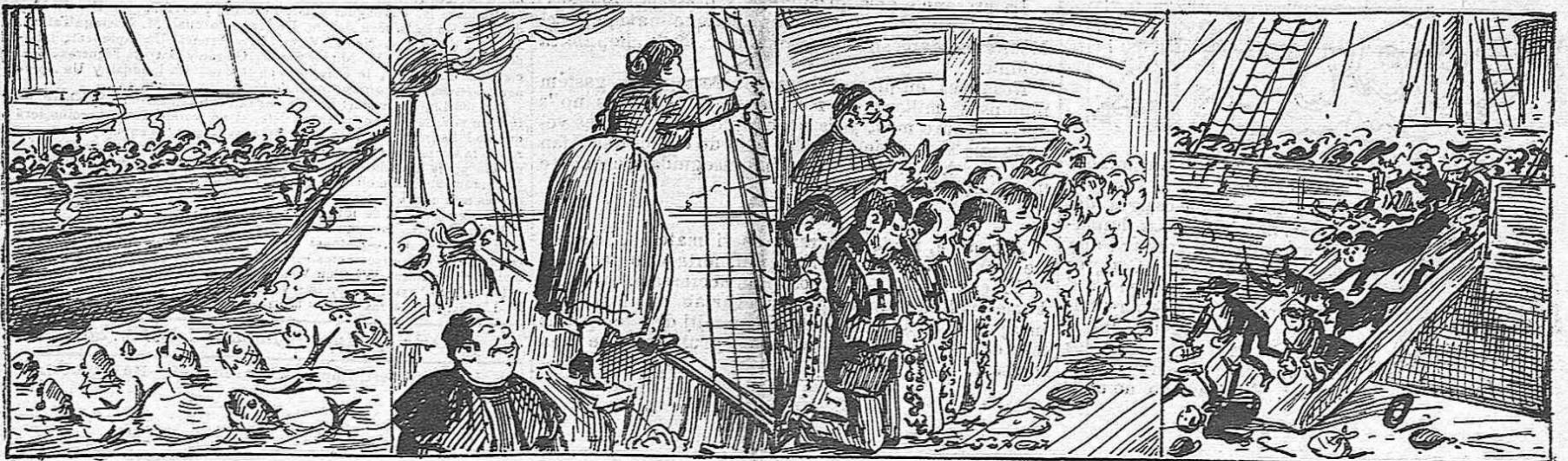
Los burrets del mar, molt fins, per 'lló de las simpatias saludan als pelegrins.