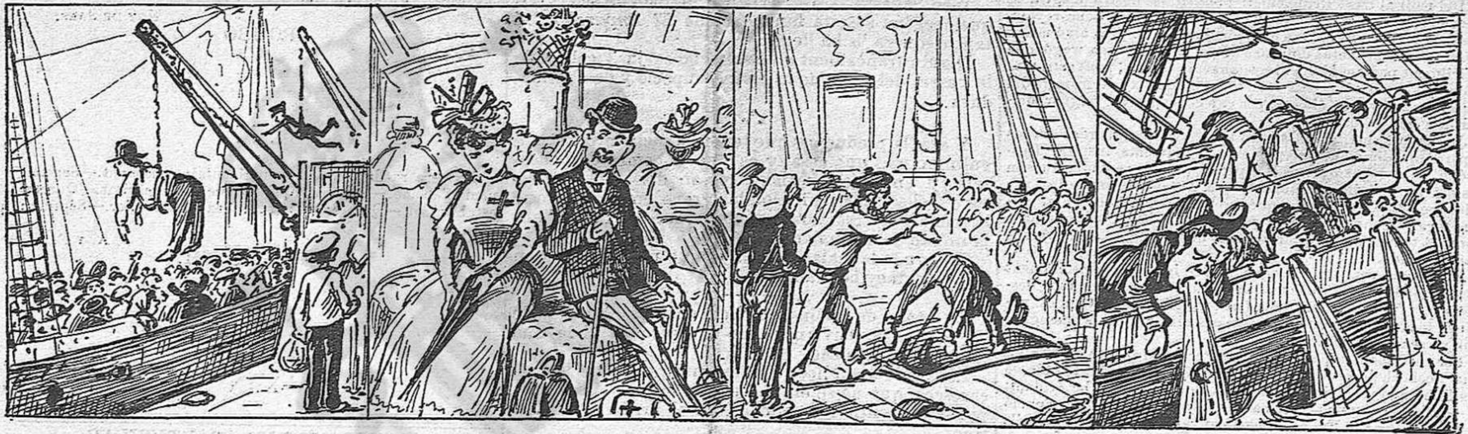
Vé de la marxa 'l moment, y ab l' ajuda de las gruas s' embarca tota la gent.