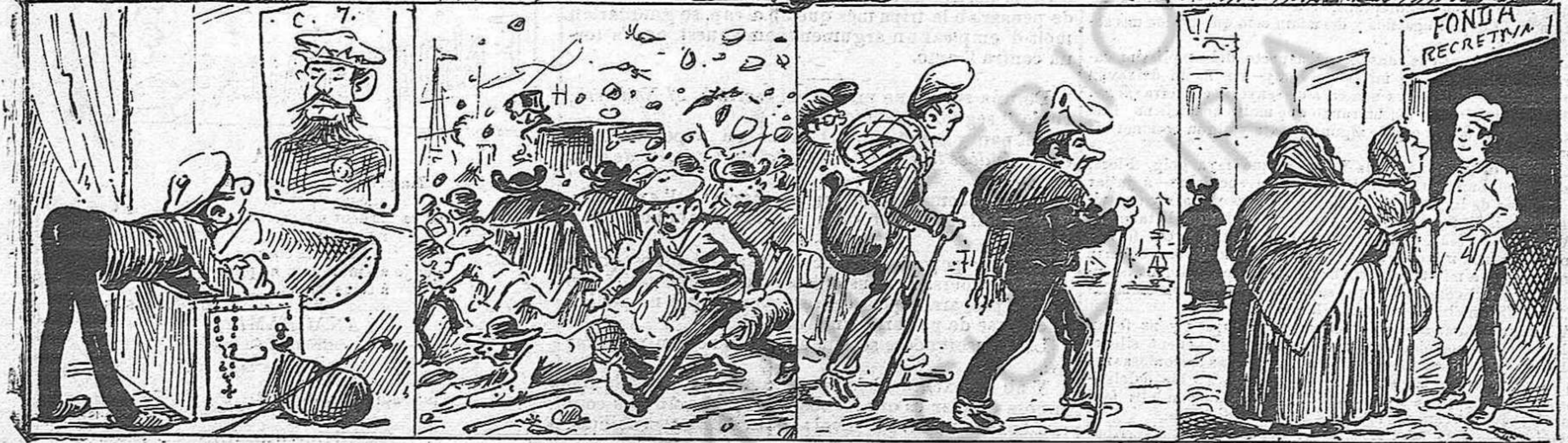
Pensant ab en Carlos Chapa, los pelegrins se disposan a aná a Roma á veure 'l papa.