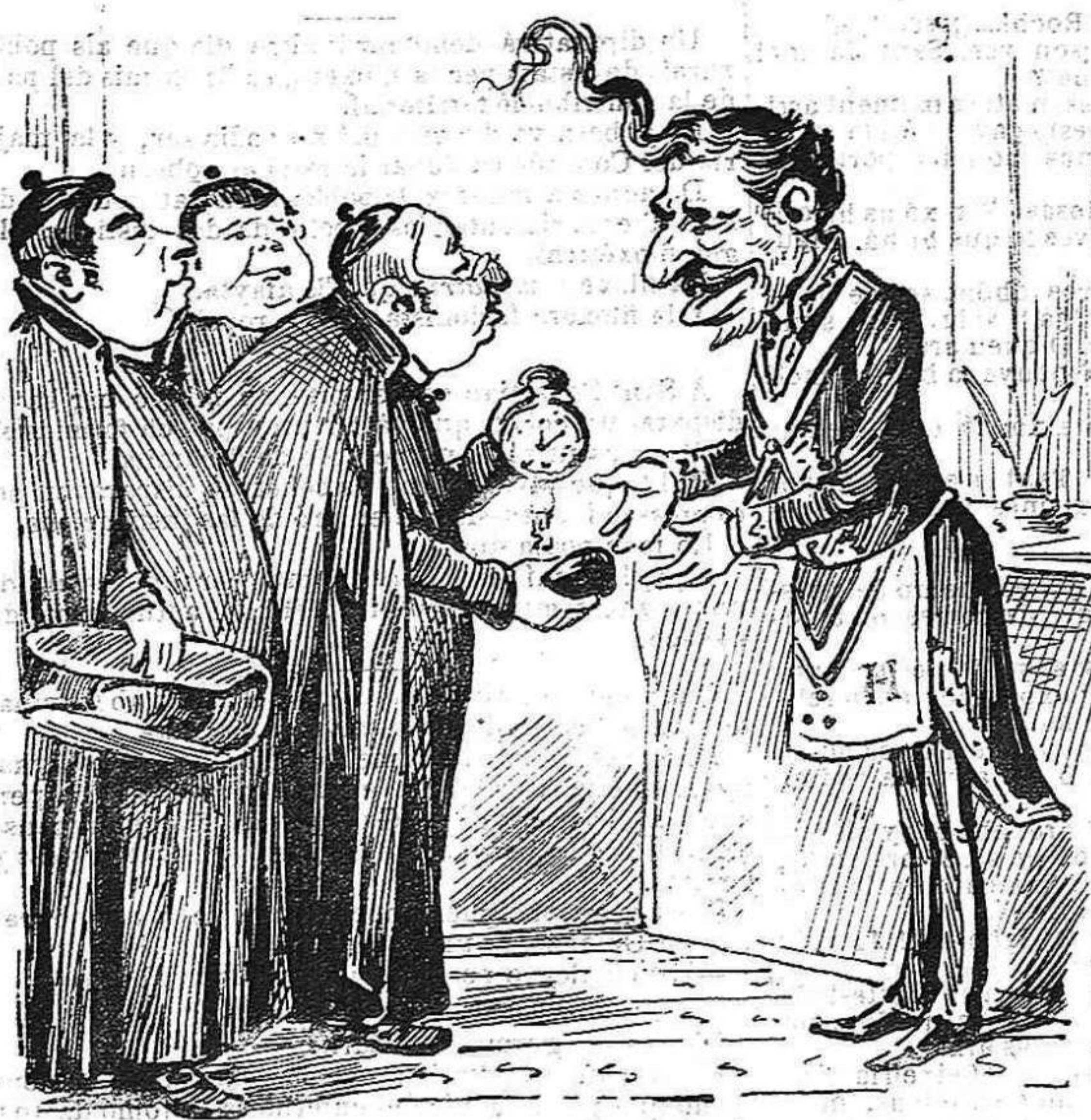
Lo dia de San Práxedes lo clero, á un gran masó vá anar á obsequiarlo ab un rellotje d' or.