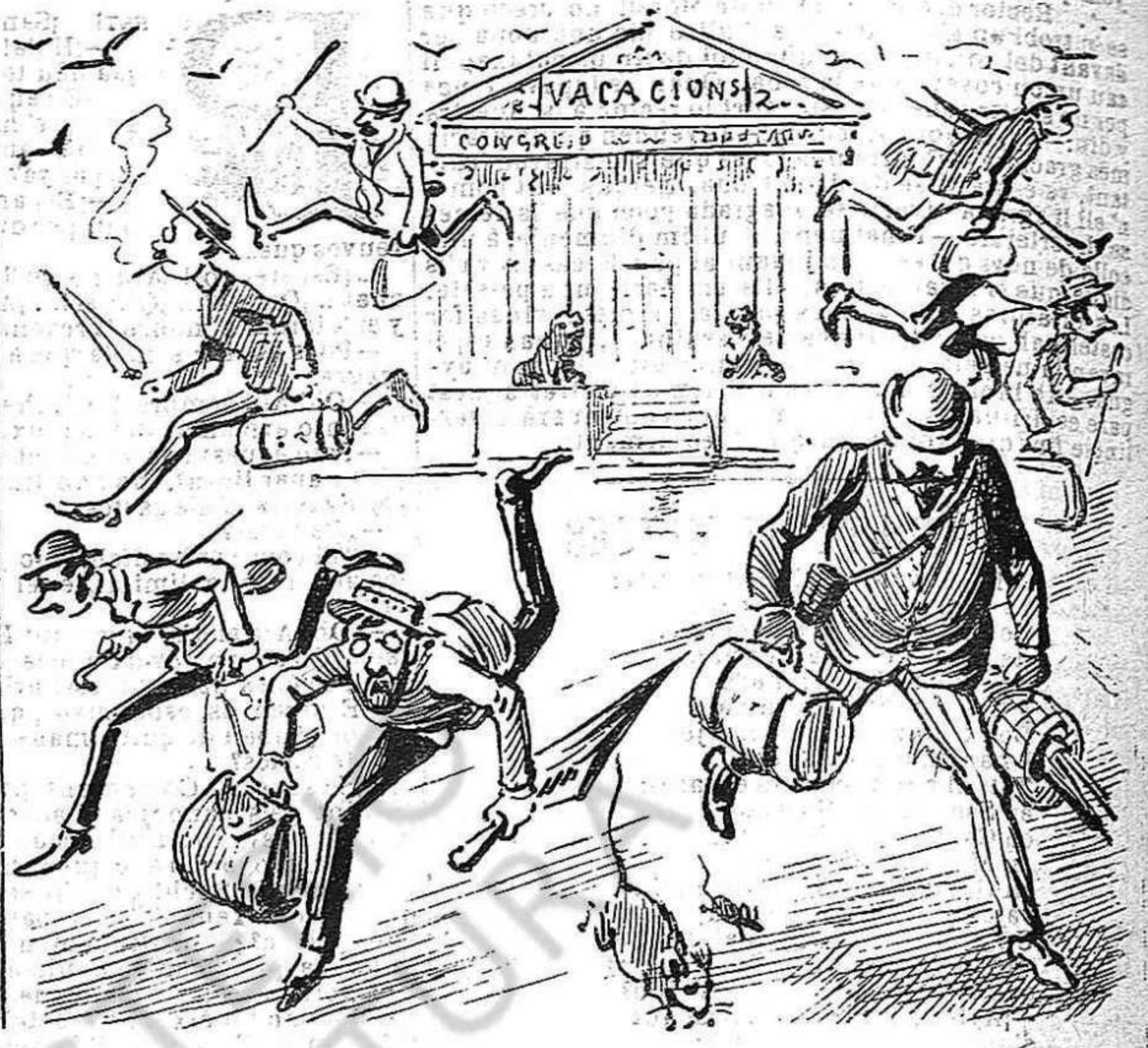
Dintre de molts pochos dias hi haurá la sessió qu' esperan ab més ansia los diputats á Corts.

Lo dia del Sant de 'n Sagasta van donarli una serenata, executantse 'l famós duo dels Puritanos.