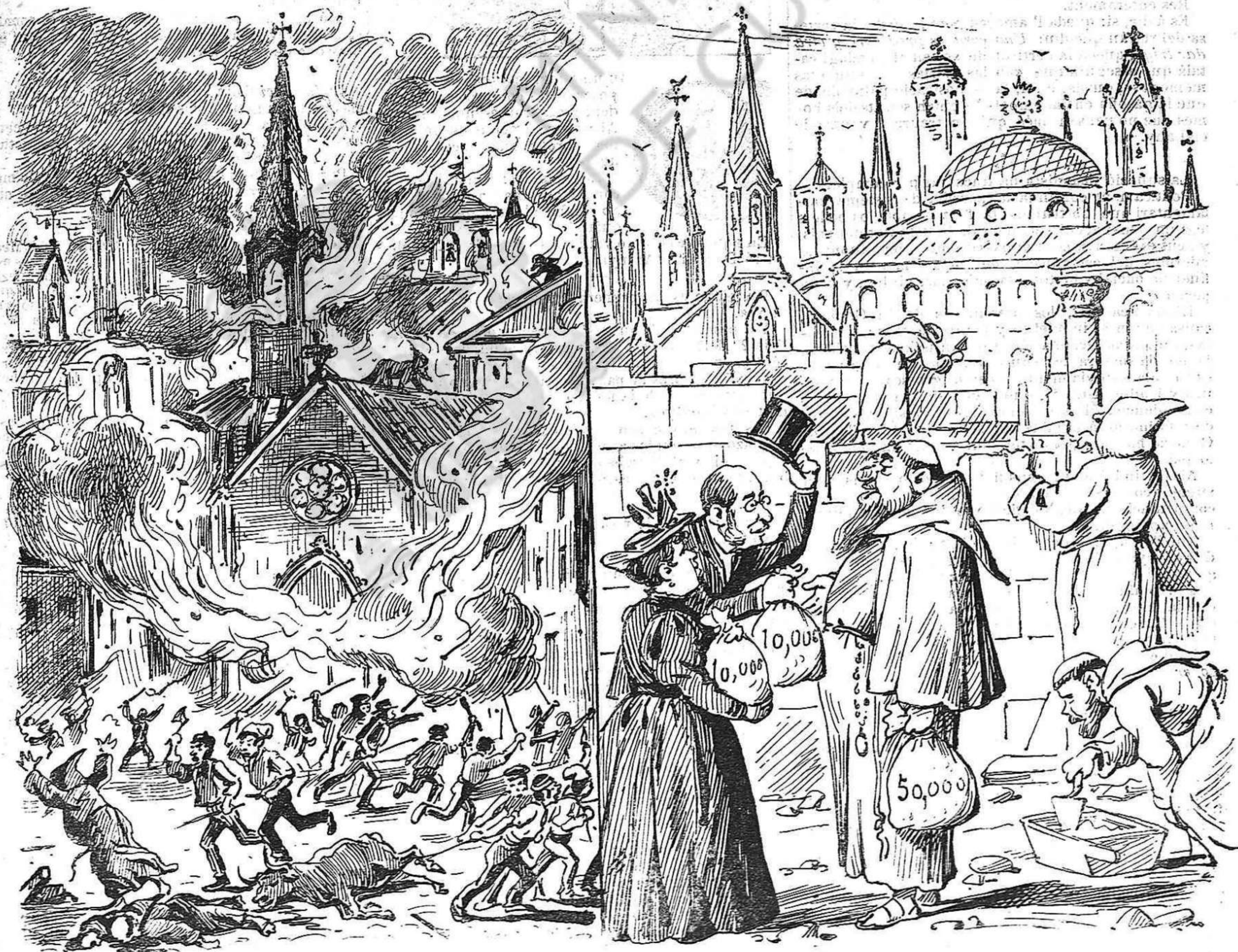
Al any 35 ho pelavan aixis