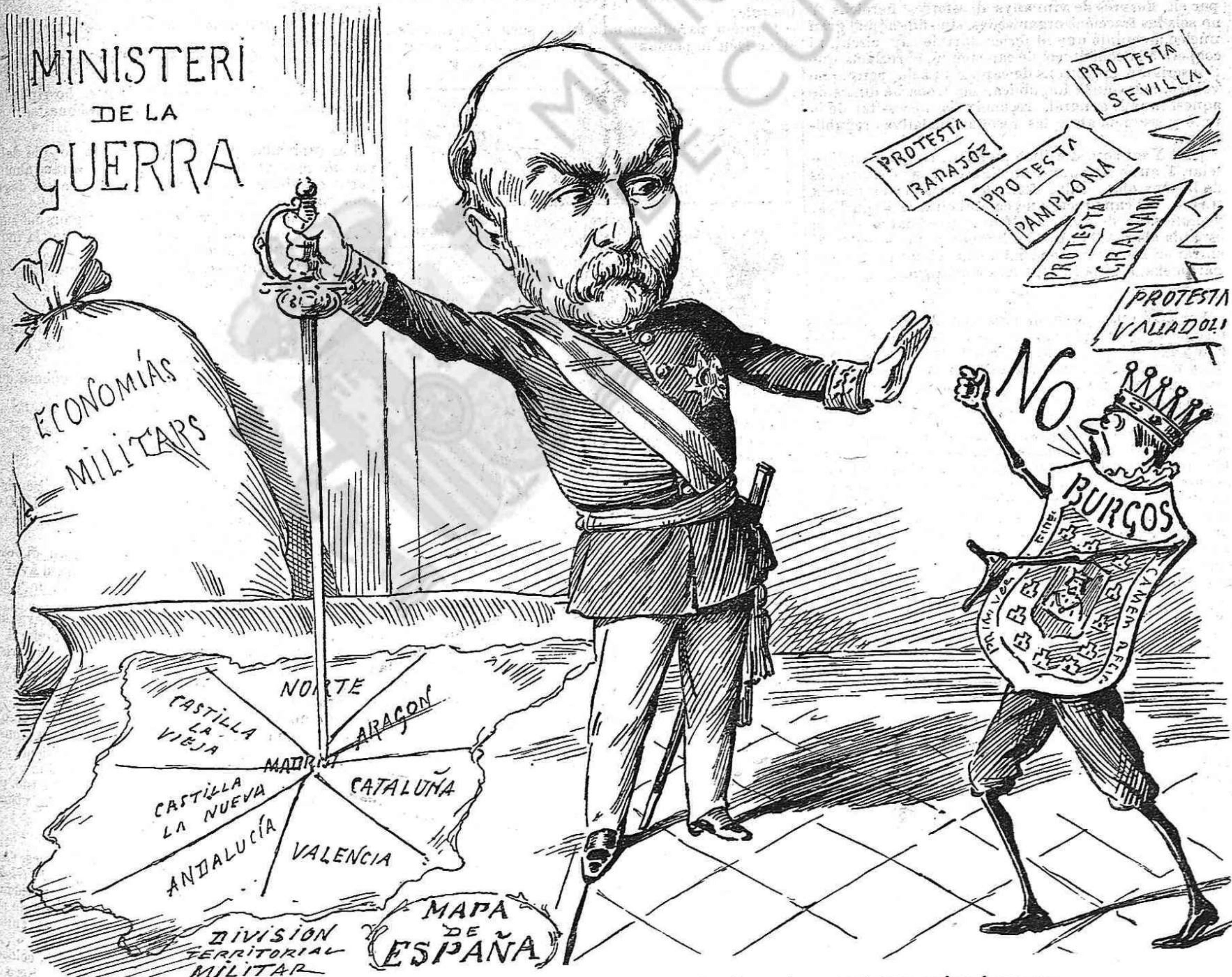
Algunas economías ja las farà en Lopez Dominguez; pero de disgustos no n' economizará gayres