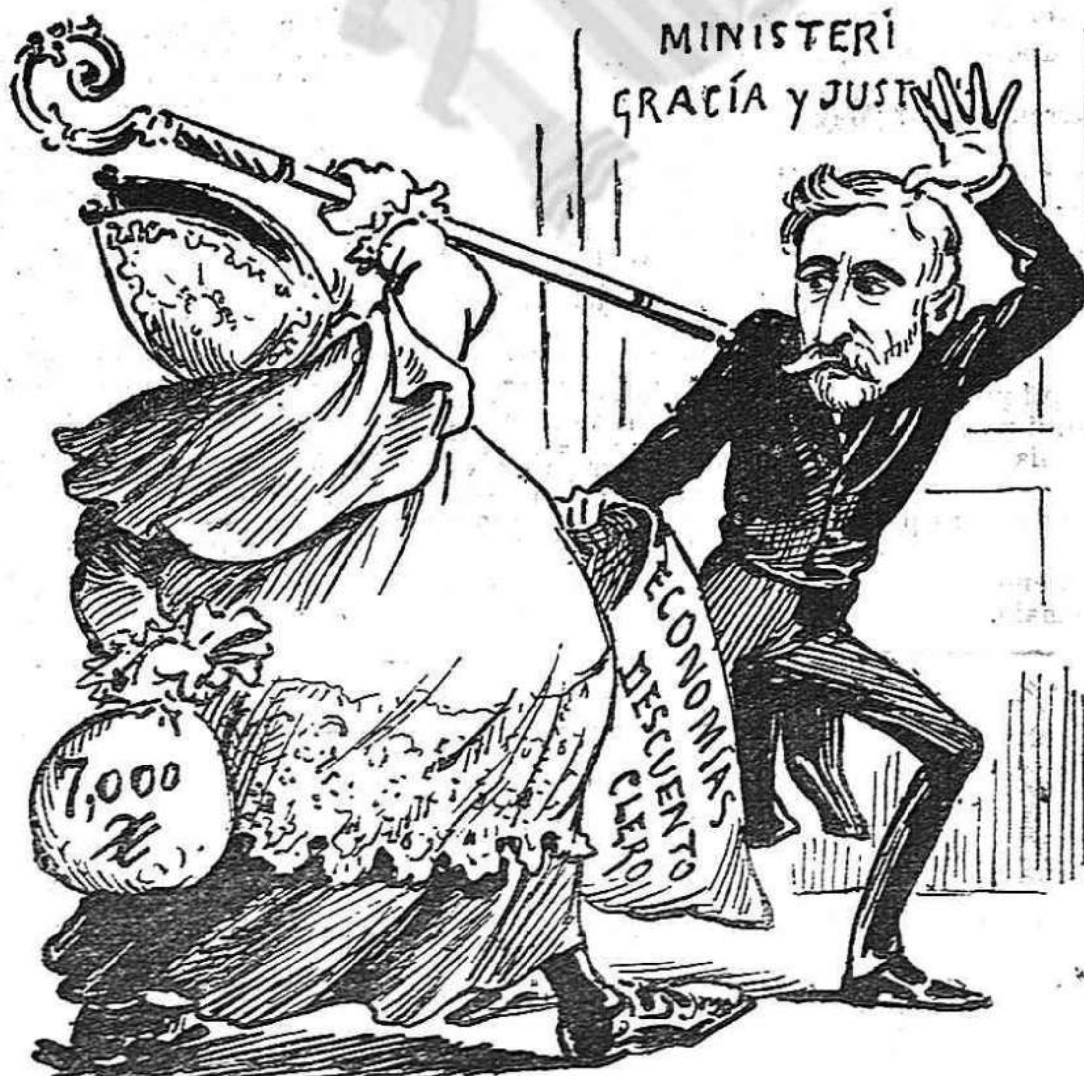
En materia d'economias lo clero no hi vol saber res. Lo clero sortirà sempre á la defensa de las masses.