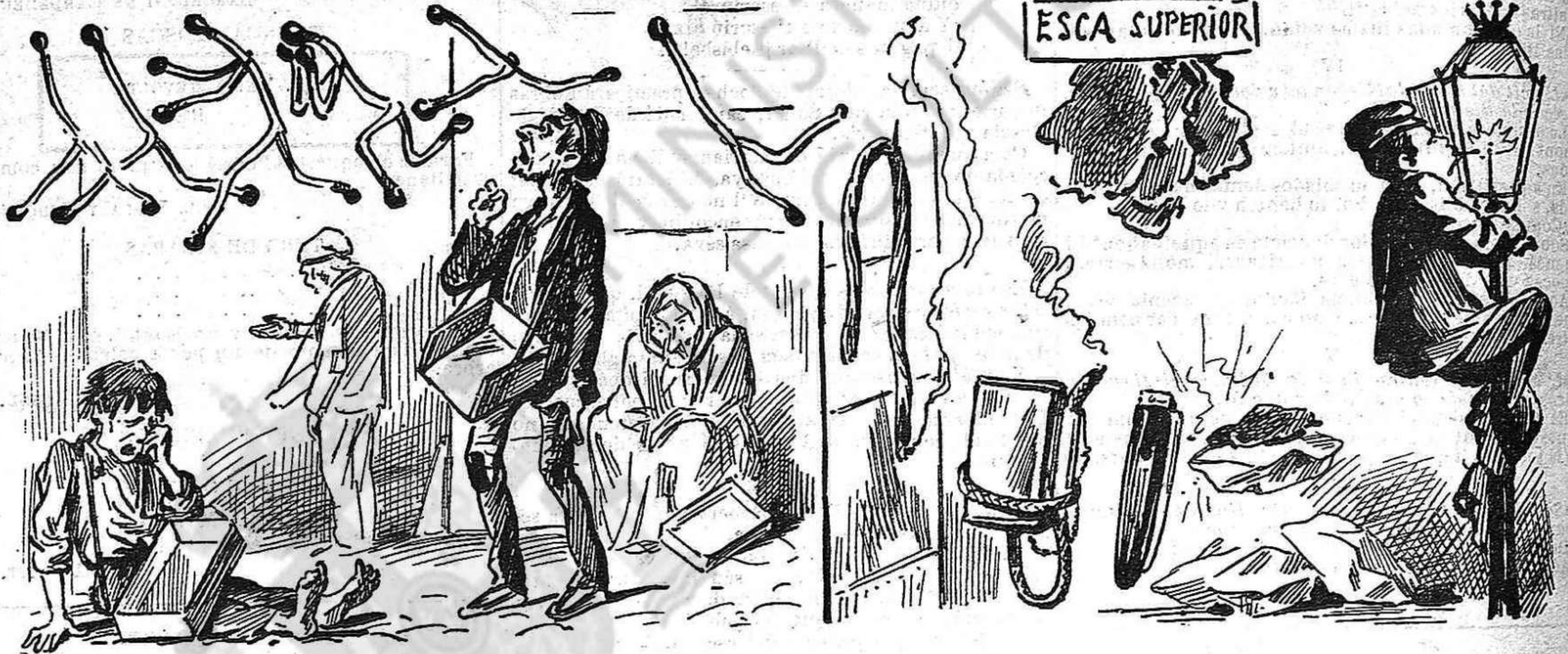
Ab aixó de l'estanch de las cerillas, los pobres mistaires han quedat á las capsas.