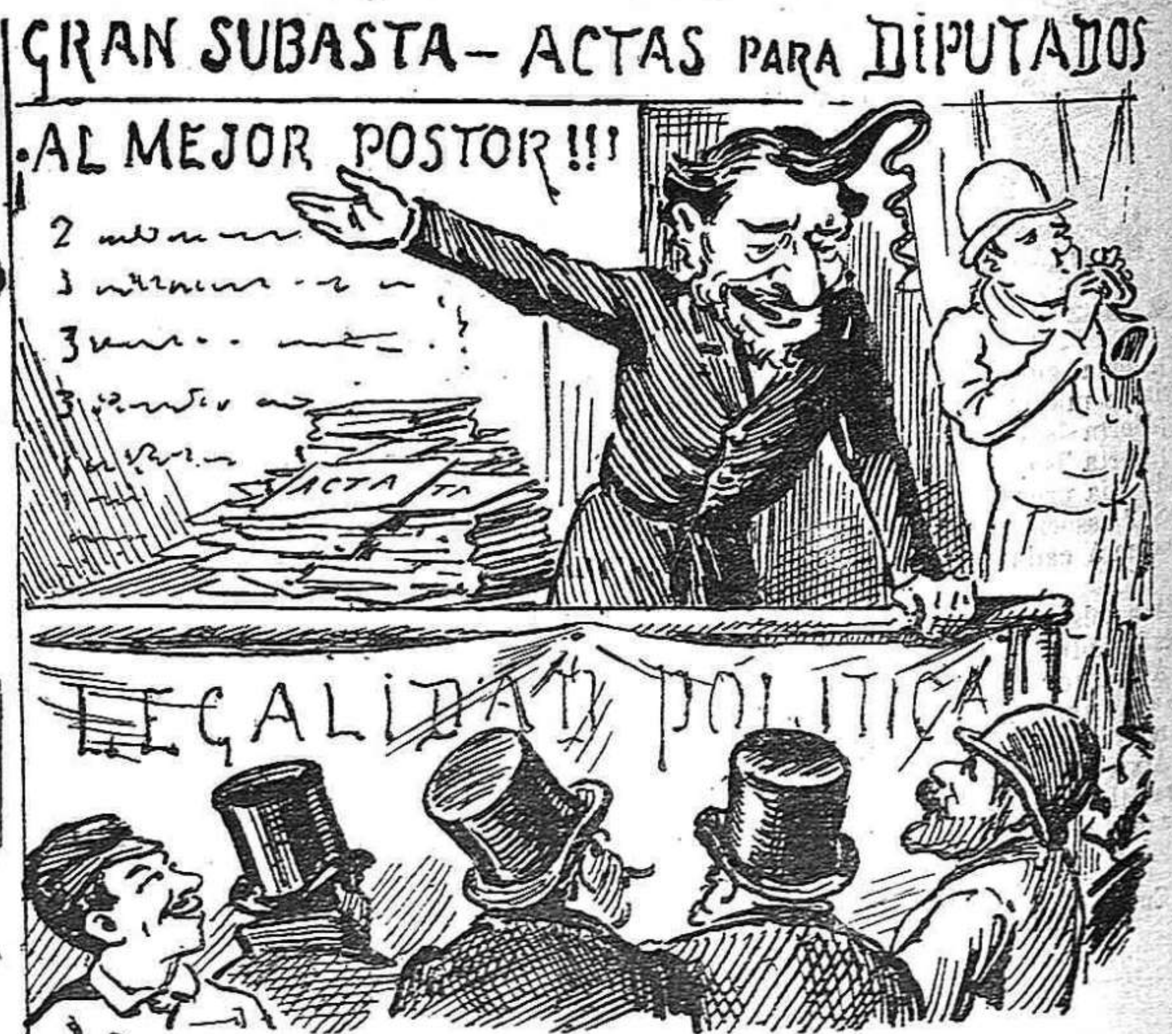
Única manera de cubri 'l déficit del pressupost.