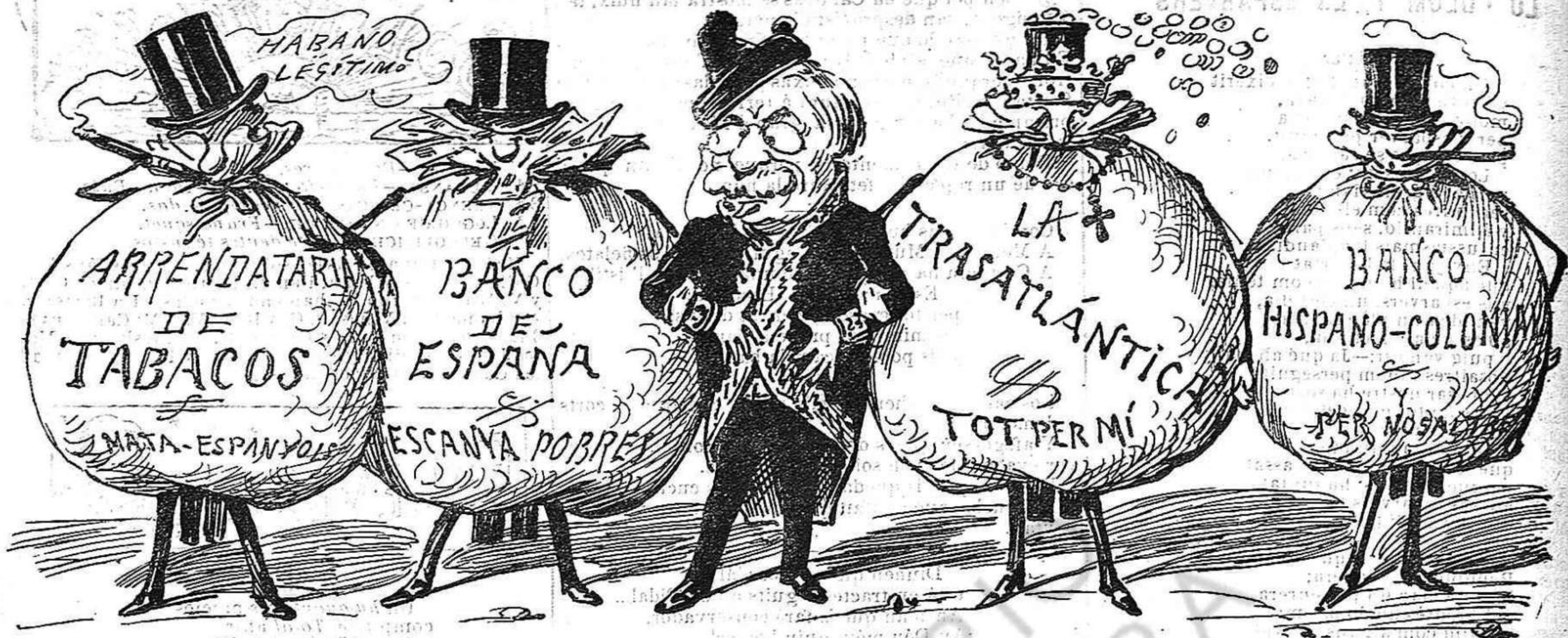
Aquí tenen als noys mimats del Govern: podrà D. Antón no fer felis á España, pero que n' está fent á aquestos no hi cab dupte