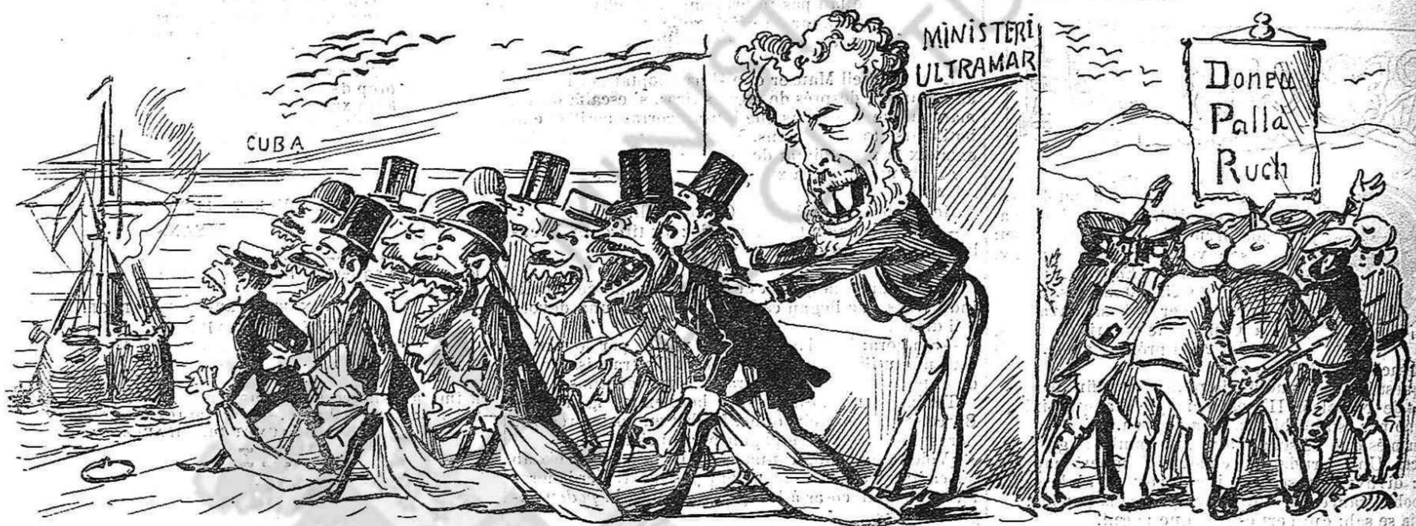
Embarch de reformistus.—¡Ala, fills méus, aprofitarse!